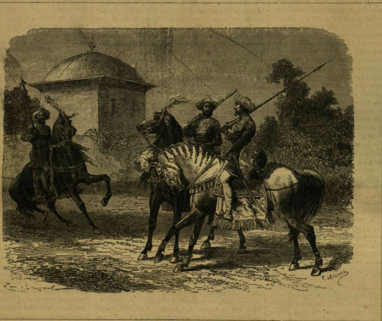
KELETINDIAI KÉPEK: Királyi testőrök Barodában.

Ebéd után még egyideig tart a beszélgetés, szivarozás (Kossuth cigarettet szí, melyet nagy ügyességgel és gyorsan szokott elkészíteni) és mintegy két óra hosszat a tekezés, a melyben Kossuth valódi művész. Tíz órakor a társaság szétoszlik, Kossuth szobájába vonul, s olvas késő éjjel. A rendszeres életmód, mértékletesség, testi mozgás és hidegvízben fürdés oly edzettké tették egész constitutióját, hogy lehetetlen rá ismerni benne arra az emberre, a kit 1848 jun. 14-ki nagy beszéde előtt úgy kellett a szószerkebe karon fogva fölvezetni. Valódi aczélimai vannak. Sok időt tölt a szellős, légyo-