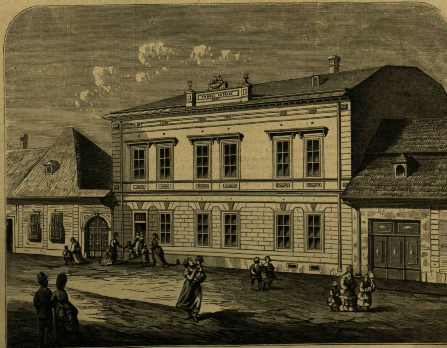
A kolozsvári Fröbel-intézet.

ban ő nem elégedett meg. A természetesen fejlődés eszközül a szemléltető oktatás mellett, sőt azt megelőzőleg, egy más, annál sokkal hatásosabb modort választott, t. i.: a gyermek cselekvés-vágyát tette a fejlesztés eszközévé, az által hogy mára két éves gyermekeknek oly foglalkozásokra nyitott alkalmat, melyek ösztönöszerű cselekvés-vágyának megfelelők, s míg egyfelől a gyermeket hasznos foglalkozásra képésítik, másfelől képzeteket fokozkint ujjabb meg ujjabb képzetekkel gyarapítják. E tekintetben Fröbel kitünő tapintattal járt el. Elleste a kis gyermekek játékait; kifürkészte, hogy mily eszközökkel és miként szeretnek ők foglalkozni s eként szerzett tapasztalatai alapján oly foglalkoztató eszközöket állított egybe, melyek által a kis gyermek fokozkint vezetetik a czéltalan cselekvésről az öntudatos alkotásra, az egyszerűről az összetettre, az egésznek ismeretéről a részek ismeretére, egy szóval a játékról a munkára, a szemléltető vizsgáldásra, a sejtelméről a tudásra. Az egytetemes fejlesztés elvének megvalósítása céljából pedig kiterjeszté figyelmét arra, hogy a gyermek mindenik tehetsége s lehetőleg ugyanazon eszközök által, de mindenkor a természetes fejlődésnek megfelelő mérvben gyakoroltassék. Az általa egybeállított foglalkoztató eszközök — természetesen szakértő egyén által kezelve — nemcsak a mun-