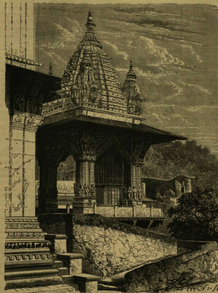
KELETINDIAI KÉPEK: Az arany kioszk Amberben.

Fröbel Thüringia Oberweisbach nevű községében született 1782-ben. Tanulmányait különböző egyetemeken végezve, elébb iskolai tanító, majd nevelő lett. Az utóbbi minőségben meglátogatta Pestalozzi intézetét Yverdun-ban s csakhamar lelkesült apostola lón Pestalozzi elveinek. Elveinek igen, de nem azon eszközöknek, melyeket Pestalozzi elvei megvalósítására választott. Ő is a nevelés alapelveit az tekintette, hogy a nevelést a születésnél kell kezdeni s mindig természetesen vezetni, de ez alapelv érvényre juttatására nem tartá elégséges eszköznek a Pestalozsi által gyakorlatba vett szemléltető oktatást. Ő a nevelésnek a születés után megkezdését úgy értelmezte, hogy már a csesemő testi s lelki képességeit fejleszteni kell azon eszközök által melyek e célnak megfelelnek. Szerinte a kisedd figyelmét egyszerű tárgyak szemléltetése által, azokna leginkább feltűnő tulajdonságaira kell irányozni, kedélyét dalokkal kell képezni, test-tagjait pedig kellő mérvben gyakorolni. Ezzel azon