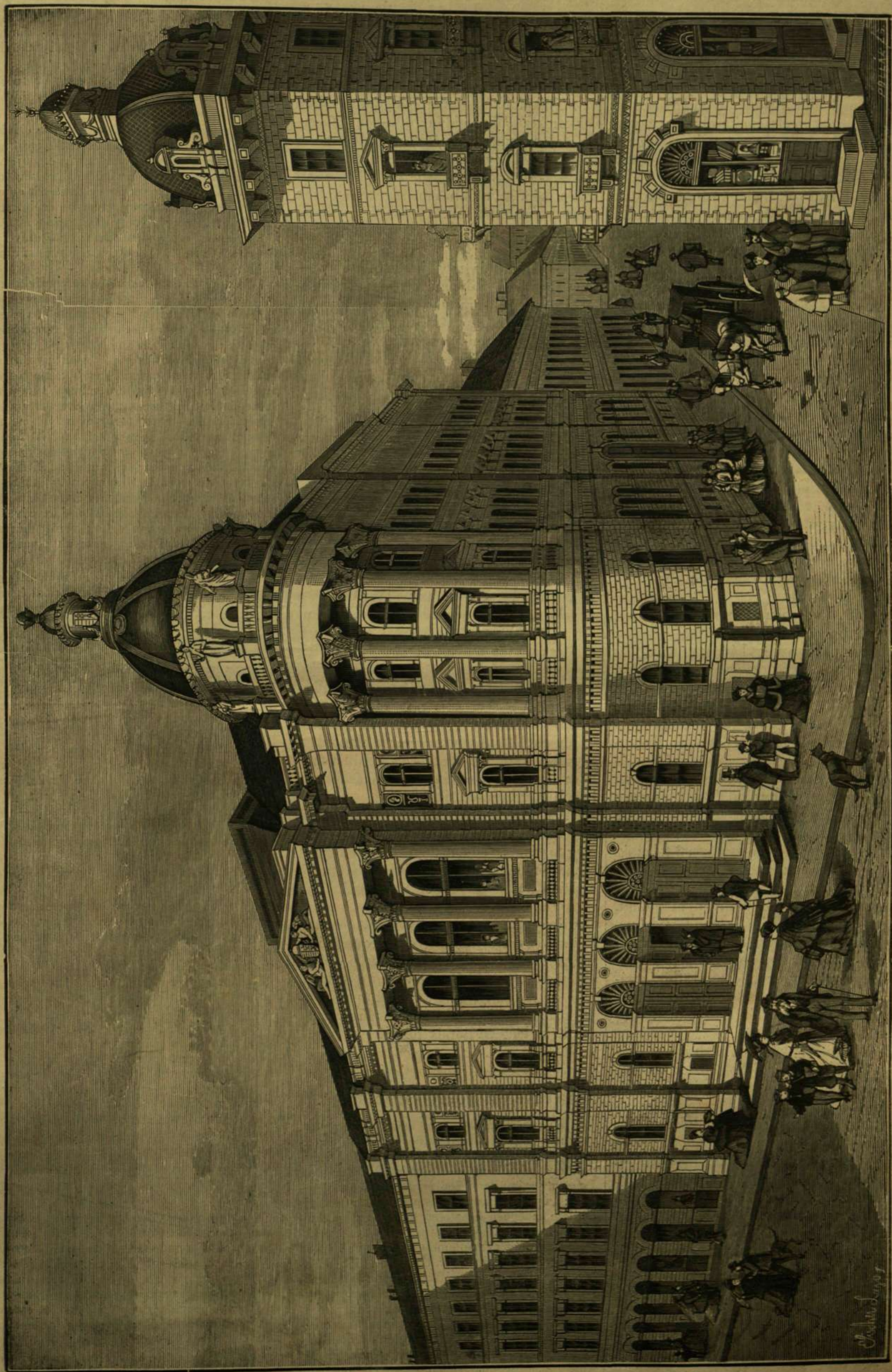
A BUDAPESTI EGYETEMTUDOMÁNYTÁR ÚJ ÉPÜLETE.