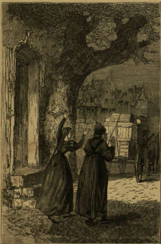
Még soká integettek a kecsi után.

A Sandwich-szigetek királya Amerikában. Ő felsége Kalakua király valóságos „nap hősvé” lett az Egyesült-Államokban, hol jelenleg királyi