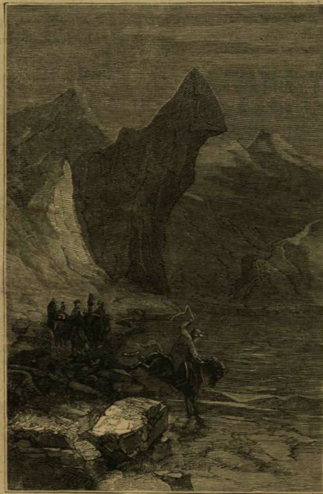
„Mint egy könyöklő sphinx.”