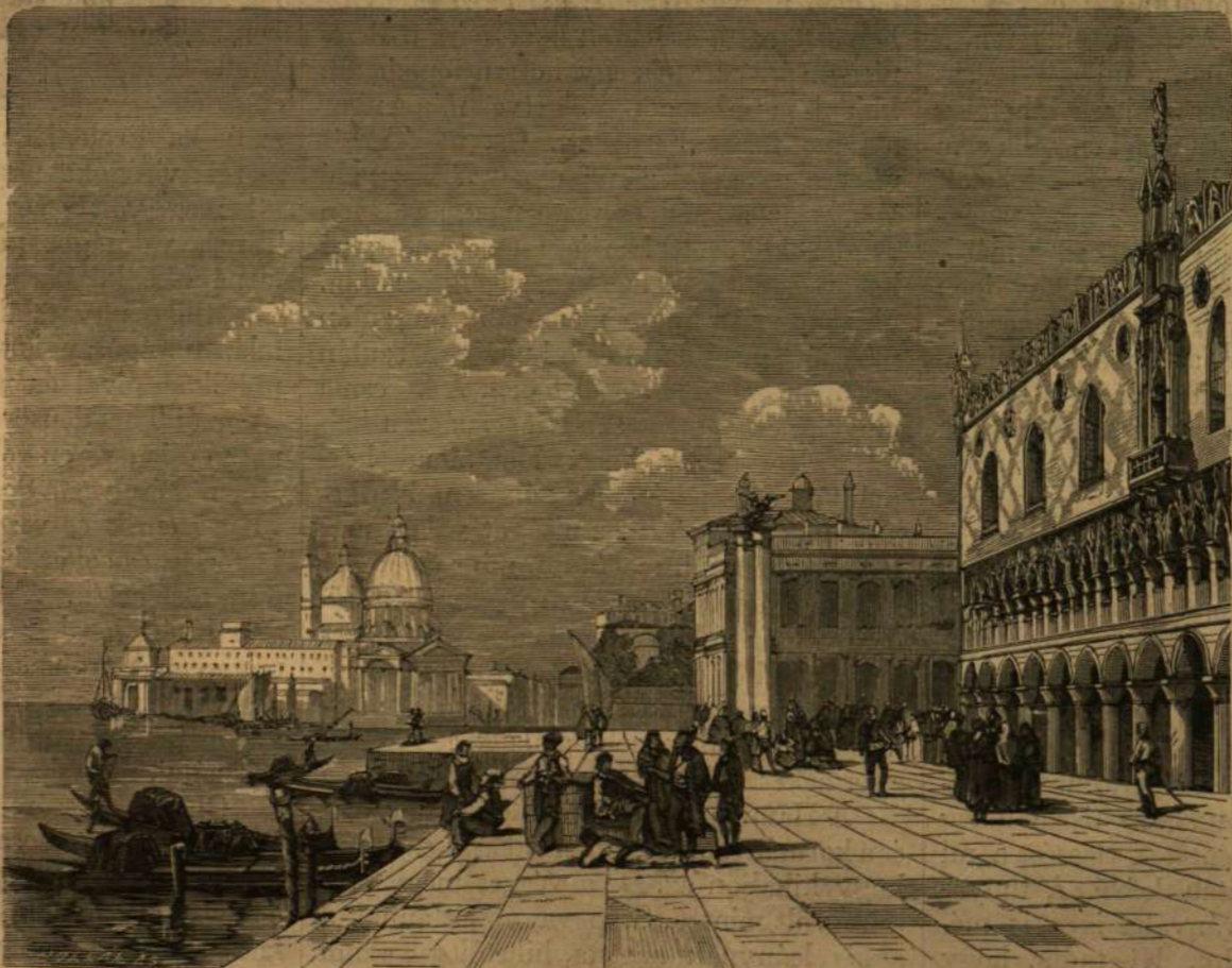
VELENCE: A doge-palota előtt.

zene ma már csak ritkán hangzik föl itt. Azok a napok elmúltak, de a szépség maig megmaradt. Államok dőlhetnek romba, sziveket takarhat el az enyészet, de a természet nem hal meg soha és nem feledheti, hogy Velence egykor kedvencze volt, az ünnepélyek ünnepelt színhelye, a föld büszkesége és Itália álarcza.“ És Byronnak igaza van: Velence romjaiban is nagyszerű, magasztos. E csodás tündérvároshoz, mely