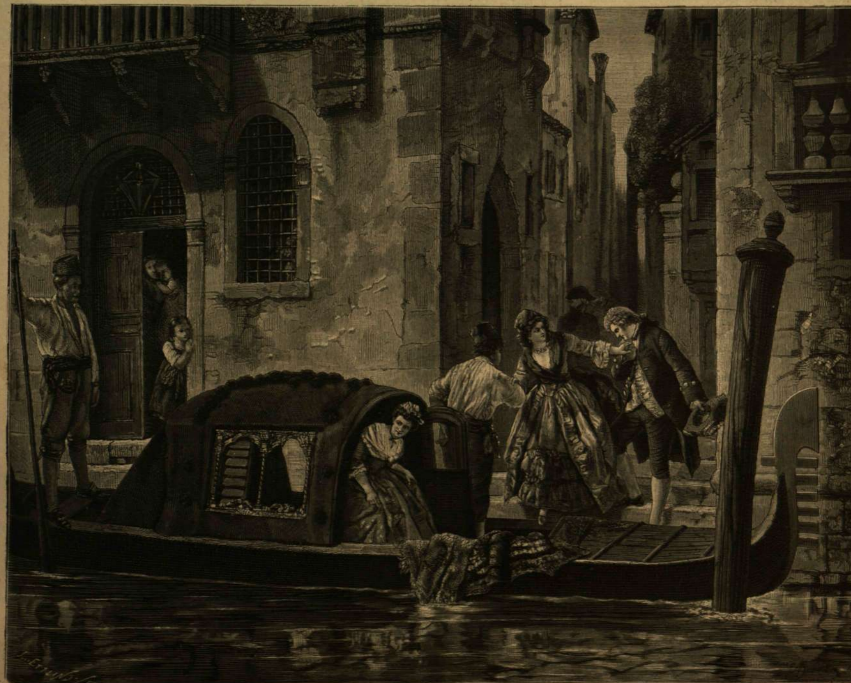
VELENCEI DISZGONDOLA A MULT SZÁZADBÓL.

körül Rivoalto nevű kis várossá tömörültek össze, a melynek lakói minden városnegyedben egy-egy tribunt választottak, míg aztán közös előjáróul 697-ben neveztetett ki az első doge. Majd megkezdődtek az ősi alkotmányban szűkségessé vált módosítások és változtatások, melyeknek következtében az ugynevezett örökös nemesek minden állam-hivatalt kezökbe kerítették s a dogei méltóság hatalom nélküli