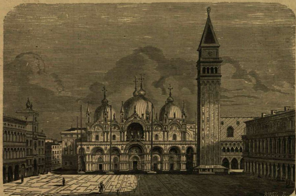
VELENCE: Sz.-Márk tere.

De azért a benyomás, melyet Velence az idegen látogató lelkére gyakorol, valóban csodásnak mondható, mert részint azért, hogy teljesen vízzel, sőt mi több: tengerrel van körülveve, részint festői építészetű díszpalotái, részint pedig nagy multjának emlékezete miatt