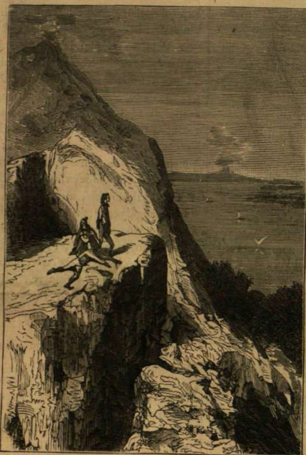
A vulkán oldalából.

A gyermek nem értette, csak nézett s nem válaszolt.