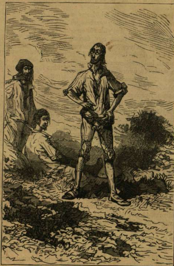
Félig meztelen, ijesztő vázalakok.

A stromboli halászkok nagyon barátságosan