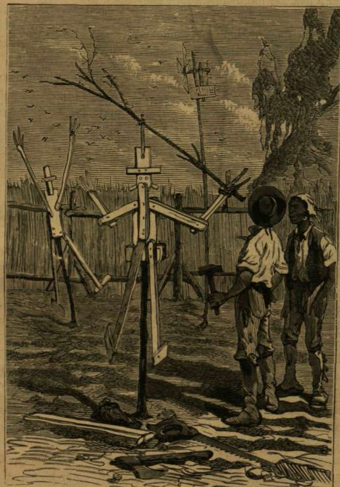
A Pencroff madár-ijesztői.