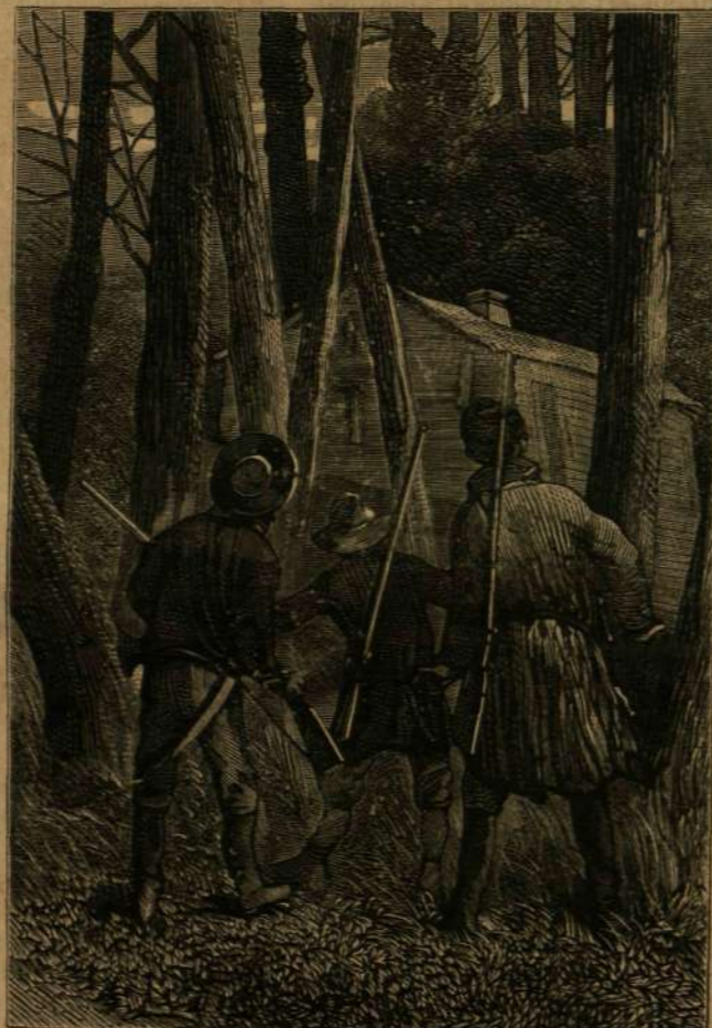
Egy ház a vadonban.