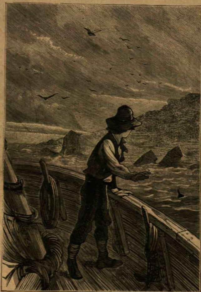
A vizen uszó palack.

— Szigorú tél s késő tavasz Észak-Amerikában. Az