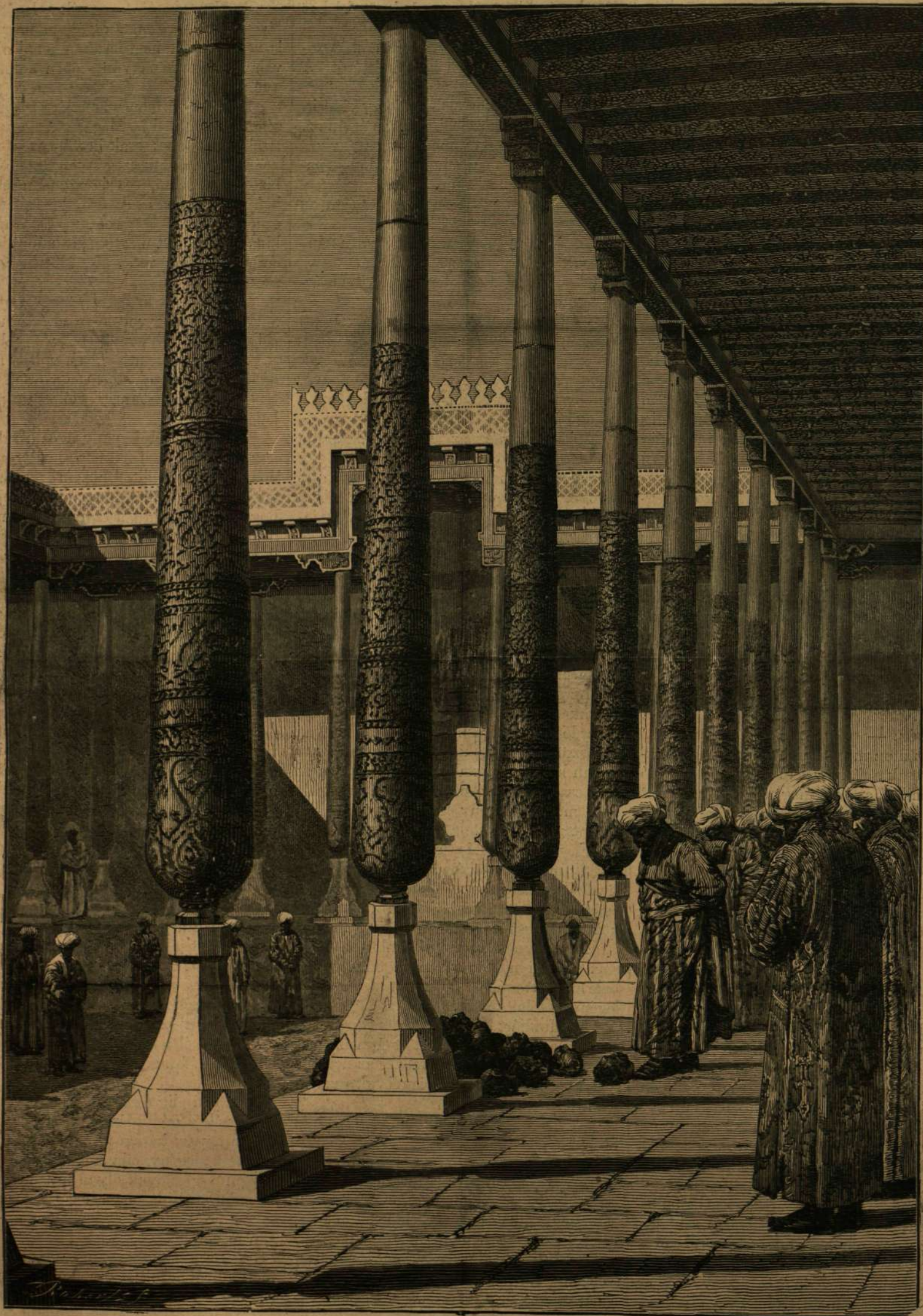
KHIVÁBÓL: Diadaljelvény bemutatása ellenségeikből a szamarkandi emir előtt.

birodalmába kerítette a khivai khánság legnagyobb részét, az egykori közép-ázsiai mohamedán műveltség főfészkeivel, Szamarkanddal együtt. Oroszország terjeszkedési vágyait Keleten most még nem politikai, hanem inkább keres-