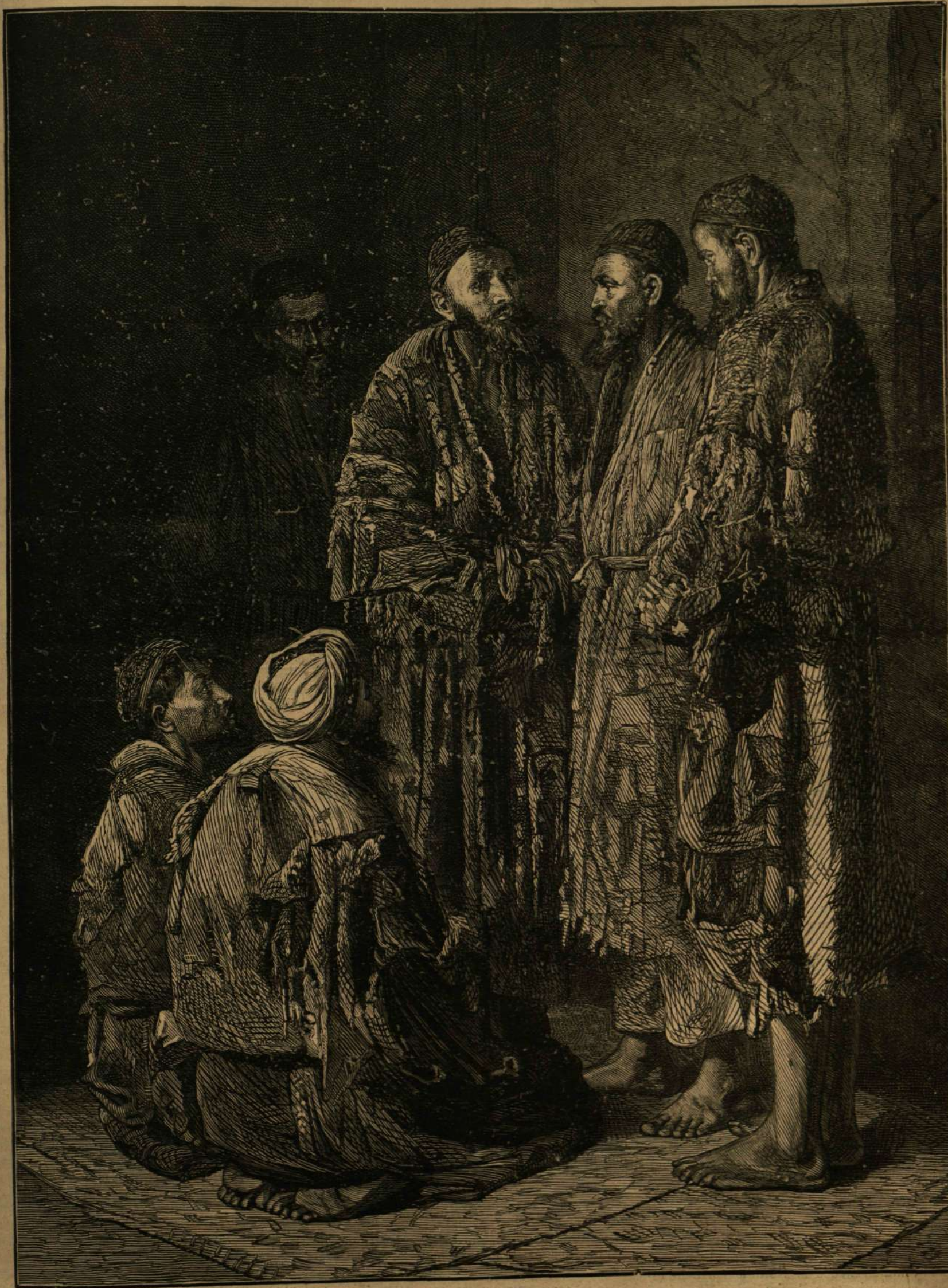
KHIVÁBÓL: Középázsiai tatár politikusok.

gazdag országnak mondható. A khánság összes népessége körülbelül 500,000 főre megy, hanem hadereje mégis oly csekély, hogy 5000 orosz katonával ágyúkkal felszerelve, magát a fővárost is könnyen hatalmába kerithette. A khánság s