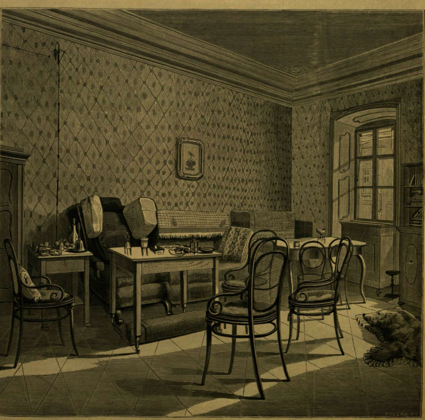
DEÁK LAKÓSZOBÁJA, A MELYBEN MEGHALT. (Természet után rajzolta Elischer Lajos.)

VASÁRNAPI UJSÁG Előfizetési feltételek: VASÁRNAPI UJSÁG és POLITIKAI UDONSÁGOK együtt: egész évre .. 42 frt félre .. 6 * Csupán a VASÁRNAPI UJSÁG: egész évre .. 8 frt félre .. 4 * Csupán a POLITIKAI UDONSÁGOK: egész évre .. 6 frt félre .. 3 * 7. szám. — 1876. Budapest, február 13. XXIII. évfolyam.