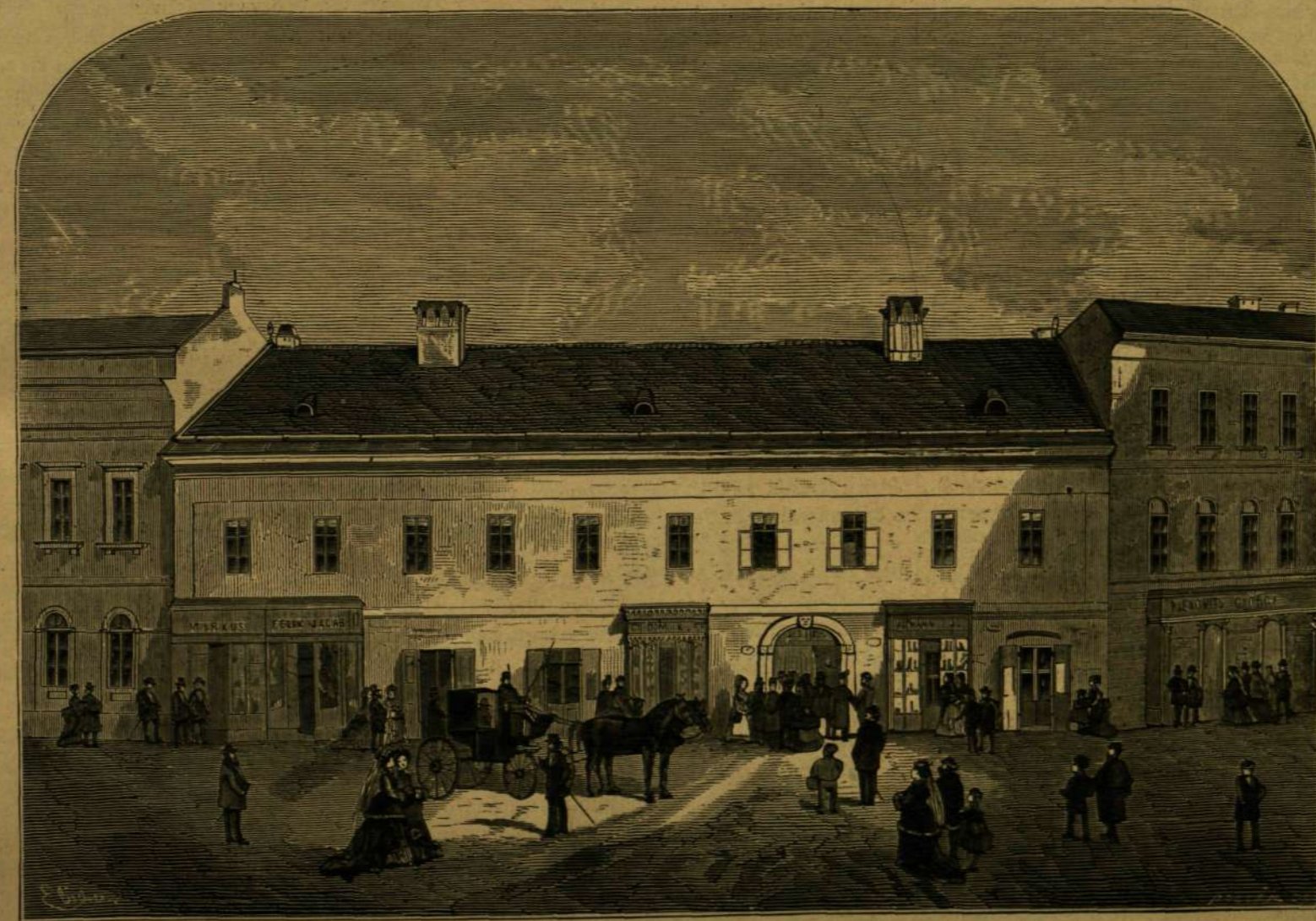
DEÁK UTOLSÓ LAKÁSA A FŐVÁROSBAN.