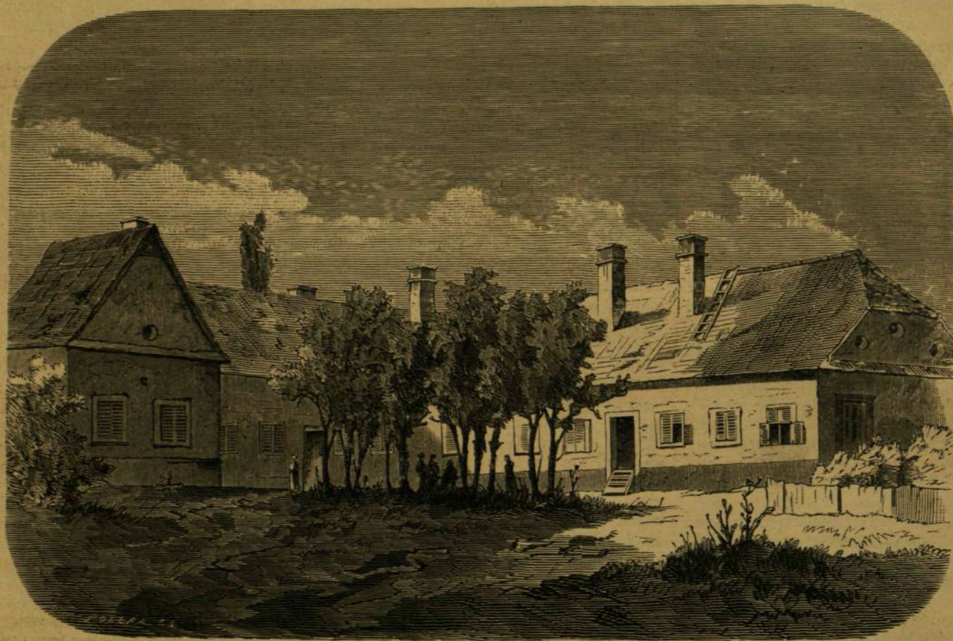
A KEHIDAI HÁZ.