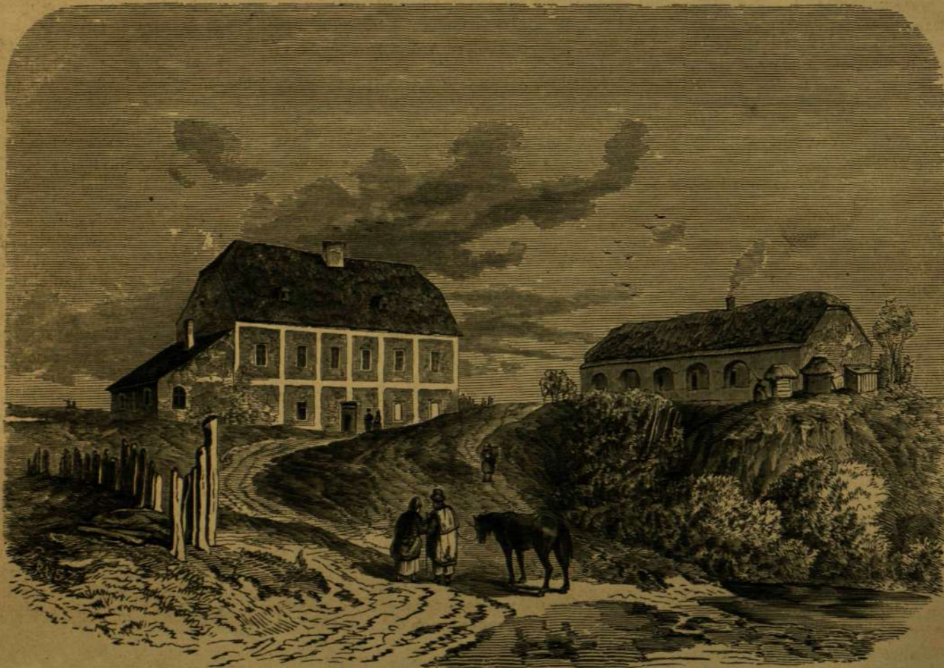
DEÁK FERENCZ SZÜLŐHÁZA SÖJTÖRÖN.

hető, mindenkinek ugyszólván lelkéből merített érveivel, nem is kételkedtek azon, hogy neki mindig s mindenben igaza van.