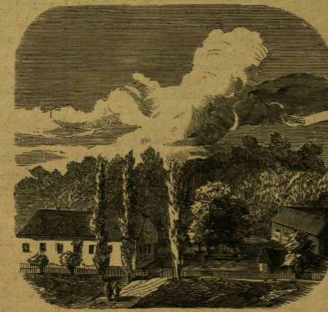
DEÁK LAKÁSA PUSZTA-SZENT-LÁSZLÓN.