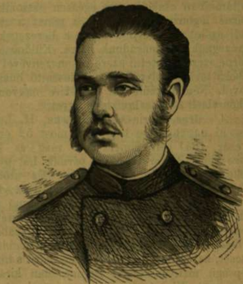
ALEXANDROVICS-VLADIMIR NAGYHERCZEG. (A CZÁR MÁSODIK FIA.)