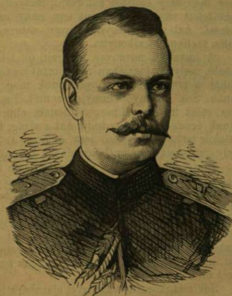
ALEXANDROVICS-SÁNDOR NAGYHERCZEG. (CZEZAREVICUS.)

Ámde azért az „összes oroszok császára“ mégis hatalmas ur. Megmutatta vagy legalább is félni lehet, hogy megmutatja nemsokára óriási — s általa még óriásibbnak képzelt — hatalmát, midőn az eleinte kisszerű hercegovinai és szerb lázadásból előbb-utóbb európai, vagy talán világháborút rogtánóz, hogy őseinek hagyományos politikáját diadalra segítve, Konstantinápolyt s az egész Balkán-félszigetet hatalmába ejthesse és halálos ellenét, a törököt megsemmisíthesse. Ezért lett a kegyetlenségéről világhírű orosz nemzet és uralkodóház oly hirtelen s váratlanul az emberiség szószólójává, a törökök által állítólag elkövetett borzasztó kegyetlenségek ostromozójává s az „elnyomott“ szerb és más délszláv testvérek nagylelkű védnökévé. A kik Lengyelországban nem egyszer árasztottak vérfürdőket, azoknak szívök ma oly érzékeny, hogy déli rokonainak török uralom alatt maradását el nem viselheti, s szép szerével és erőszakosan mindent elkövetnek, hogy Bul-