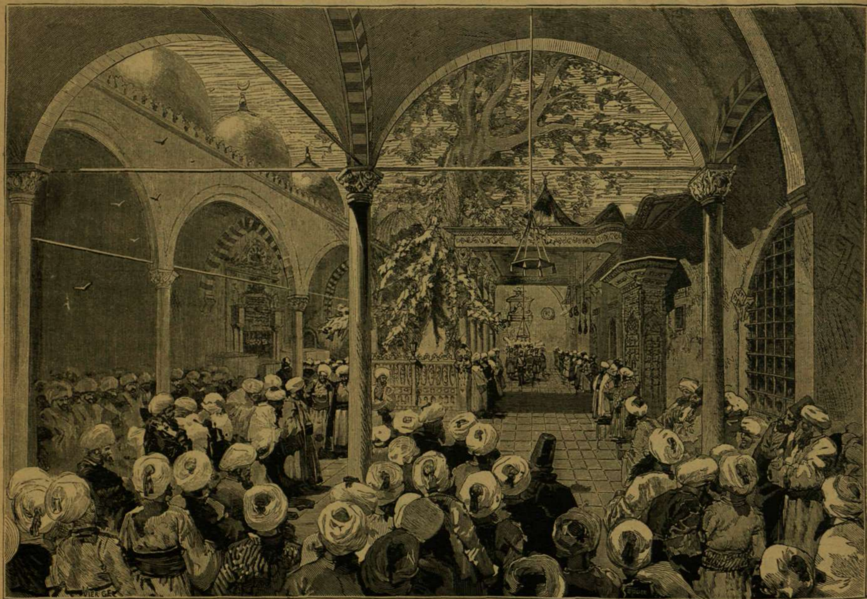
ABDUL-HAMID SZULTÁN FÖLAVATÁSA. — A szultán bevonulása az Ejub-mecsetbe.

Az orosz birodalom, jelenlegi állásában és terjedelmében, a világtörténet színpadán egymás után tett s többnyire sikeres lépéseknek valóságos élő krónikája. Ez óriási mammut, melyet ép állapotban ástak ki a rideg Sziberia évezredes hava és jege közül, Európában meglevenült és megerősödött és most fenyegeti a nyugati művelt világot. Európa és Ázsia egész északi részét magába ölelve, ma már közel 400,000 négyzetmérföldnyi területen körülbelül 85 millió lakost számlál s szükség esetén másfél, sőt két millió harcost is képes csatasíkra állítani. Szerencse, hogy ama roppant néptömeg és így ez óriási hadsereg is a legkülönbözőbb s nagybőrára műveletlen, félbarbar néptörzsekből áll, mely a művelt nyugati hatalmak jól szervezett és jól felszerelt hadseregeivel