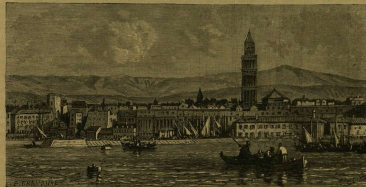
KÉPEK DALMÁCZIÁBÓL: Spalato a tenger felől.

férhetők és fölismerhetők, mert a falak mellé s az oszlopcsarnokok közé nemcsak hogy kisebb-nagyobb házakat építettek, hanem a palotát sok helyen az omladékok is többé-kevésbé betemetették. A régi palota 705 láb széles és hosszú négyszögöt képezett, kívülől falakkal és tornyokkal volt körülveve, belül pedig, mint valami állandó táborhely, kisebb-nagyobb udvarok s egymást keresztül-kasul metsző utcák által több egyenközü apróbb részre volt fel-