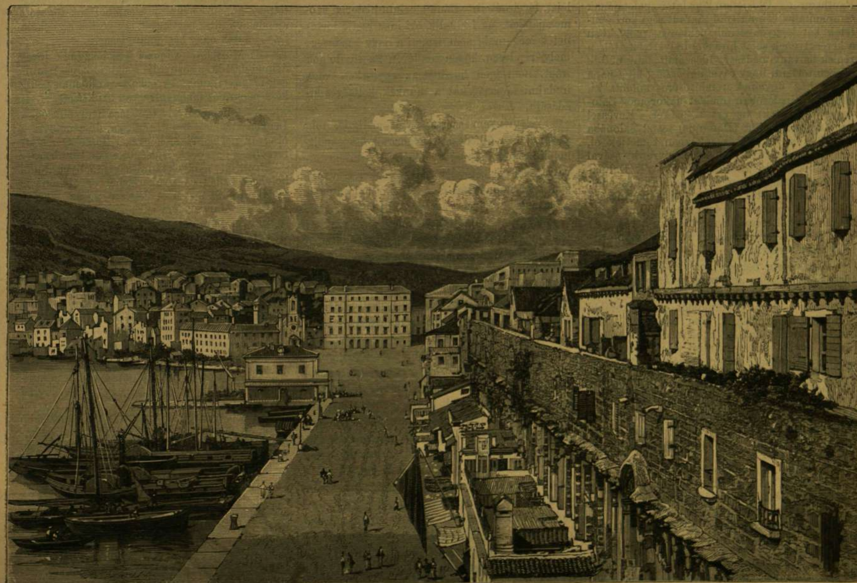
KÉPEK DALMÁCZIÁBÓL: A spalatói rakpart a Diocletian-palota körfalával.

tották át lakásul, vagy pedig új házakat építettek a térs udvarokon, míg aztán a későbbben jövők nem találván helyet a palota belsejében, annak körfalai mellett külvárosokat építettek, a melyeknek utcái az öböl mellett emelkedő Mária-hegy oldalán félholdat képeztek.