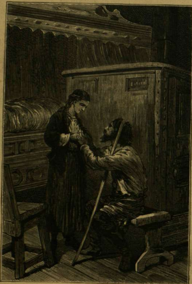
Itt vagy, Nadia?

•/• A különböző gyorsaságok összehasonlítása. Másodpercenként egy rendes járási ember 6 lábnyit, egy folszerszámozott és jó járási ló 12 lábnyit.