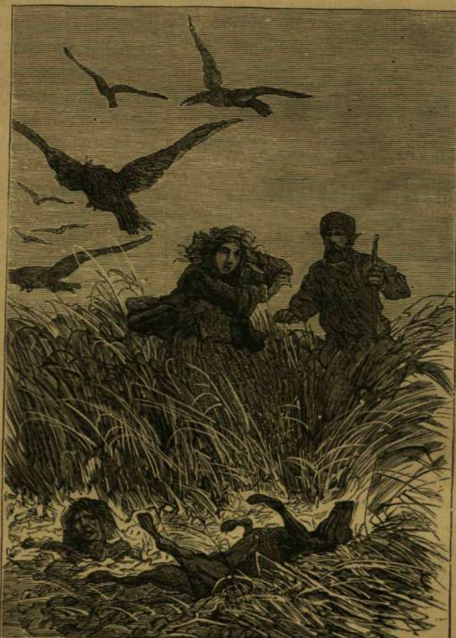
A földből kinöve egy emberfej látszott.

/. Őriási kéziratgyűjtemény. A legnagyobb magán kéziratgyűjtemény jelenleg Becher Stowe Henriette-nek, a „Tamás bátya kunyhója“ s több más többé-kevésbé olvasott regény szerzőjének