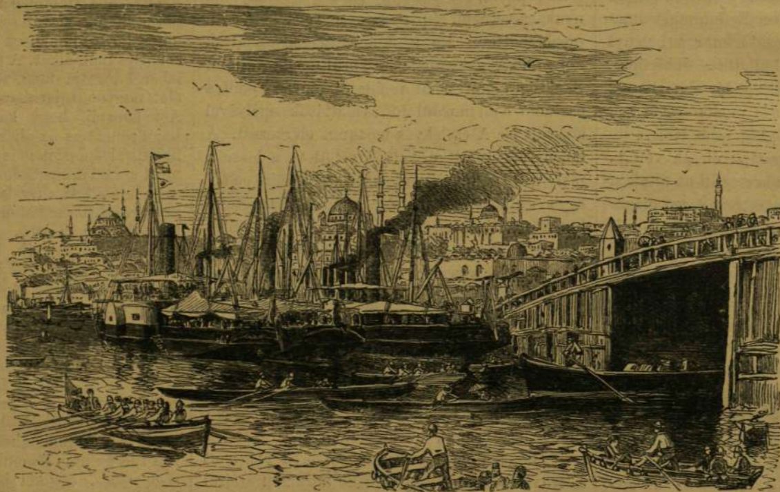
Az Arany-szarv hidja.

A bazárok szomszédságában és a dsámik (nagyobb mecsetek) udvarain levő kávéházak rendezen leglátogatottabbak. A kereskedők között is, majd minden ötödik bolt előtt találunk kisebb kávéházakat, melyekből a szomszédos bolttulajdonosok a kávé hozatják vendégeiknek. A mecsetek udvarai rendezen igen tágasak, például a II. Mohammed dsámijának udvarán egy dandár katonaság is végezheti gyakorlatait. A mecsetek