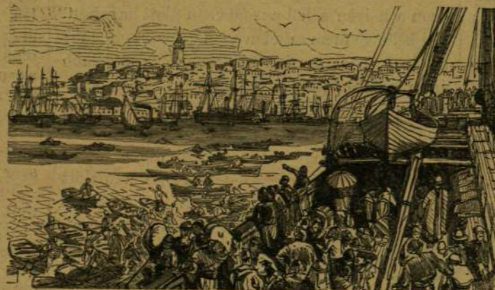
Megérkezés a kikötőbe.