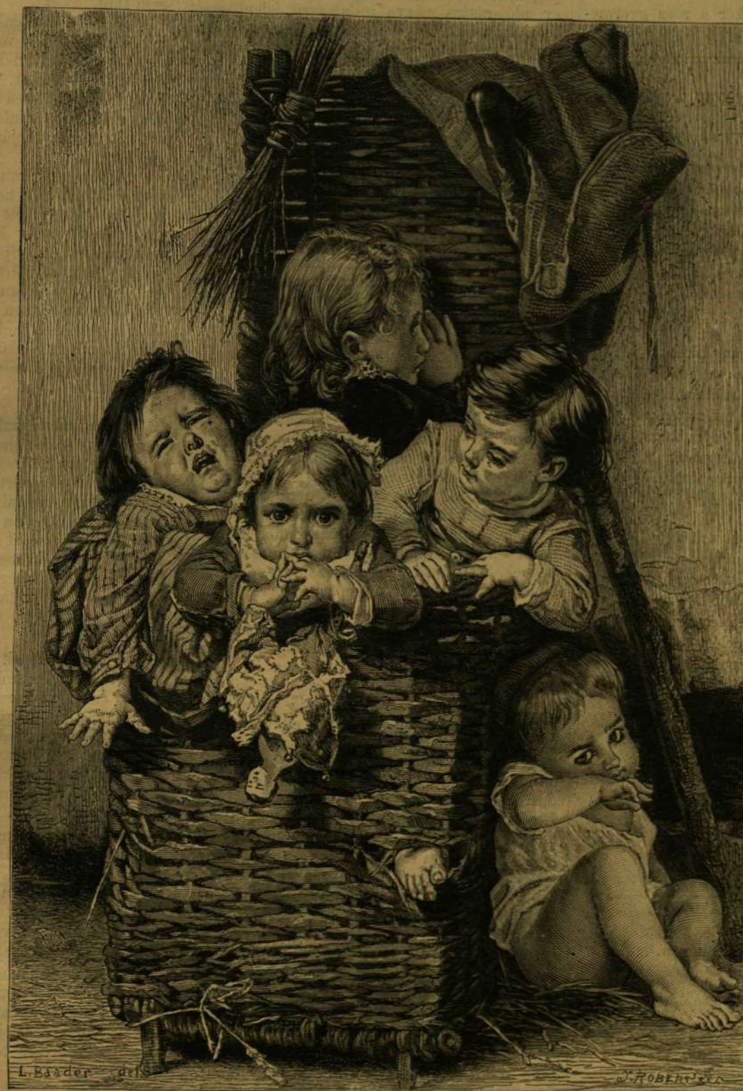
A „GONOSZ KOSÁR.“

Egyik közelebbi párisi műkiállításán egy geniális festvény vonta magára a közönség és a műértők figyelmét. „A Croquemitaine kosara“ volt ez, Lobrichontól. Száz meg száz fénykép és metszet készült róla s bejárta az angol és francia képes lapokban az egész világot. A Croquemitaine a középkori breton népmondá-