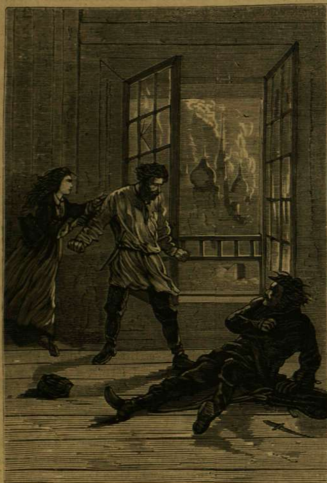
Ogareff is ráismert...