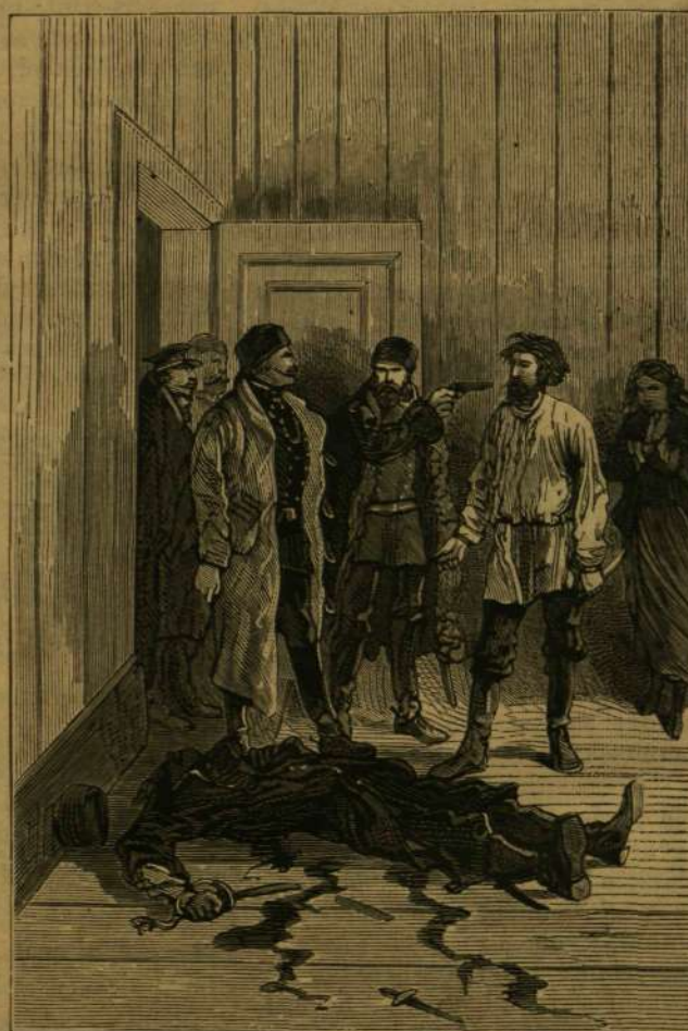
„Ki ölte meg ez embert?”