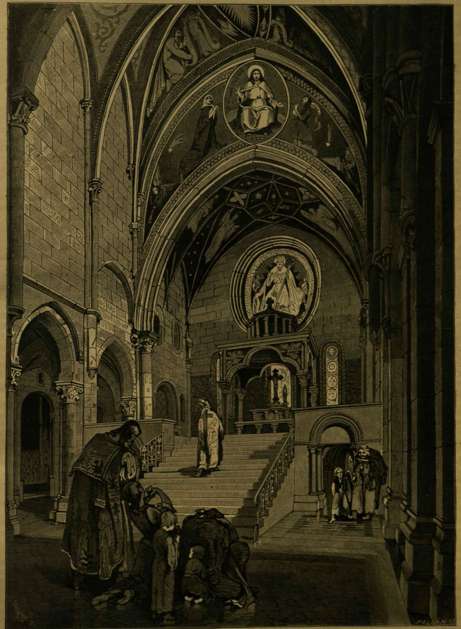
A PANNONHALMI SZÉKESEGYHÁZ SZENTÉLYE.