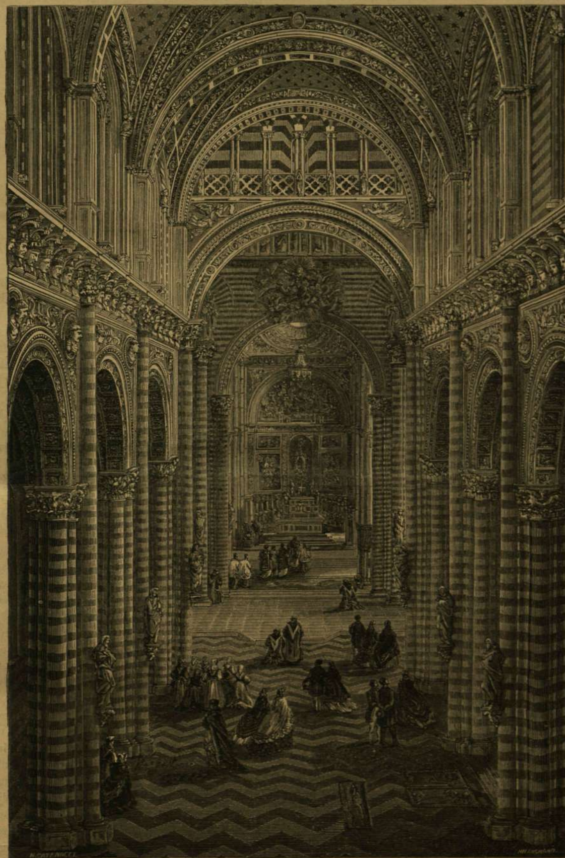
A SIENAI SZÉKESEGYHÁZ BELSEJE.

A városnak még több, szintén igen díszes építészeti temploma is van, melyeket hasonlóképen a művészet kiválóbb termékei tesznek érdekesebbé. A városházát szép freskófestmények díszítik; a szépművészetek akadémiaja, az egyetem, számos zárda, siktetmák és árvák menháza, az előkelő toskáni családok díszes