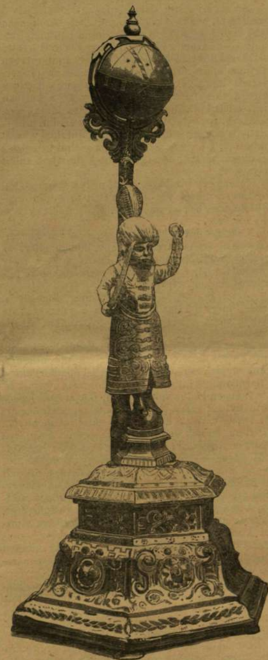
Thököly Imre órája.

Hogy egyik óra a másik után mulik s délre kezd járnai az idő: elérsz a pusztá kellő közepén