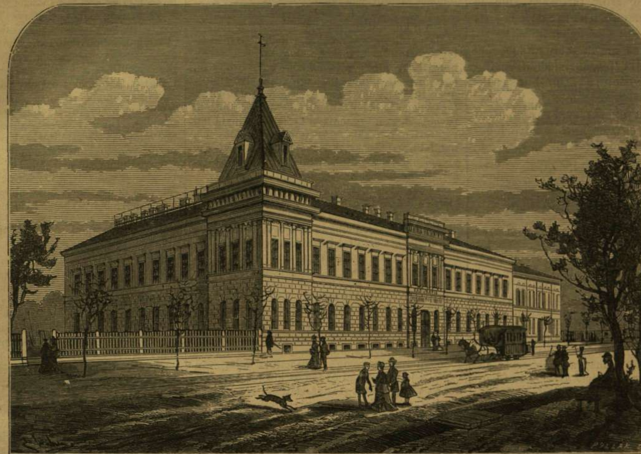
A MAGYAR GAZDASSZONYOK EGYLETÉNEK LEÁNYÁRVÁHÁZA BUDAPESTEN.

Meglepő látvány várt reájok. Az ősz főnök ott feküdt a sátor földjén, turbánját messze dobta fejéről, s jajgatva sirta két-