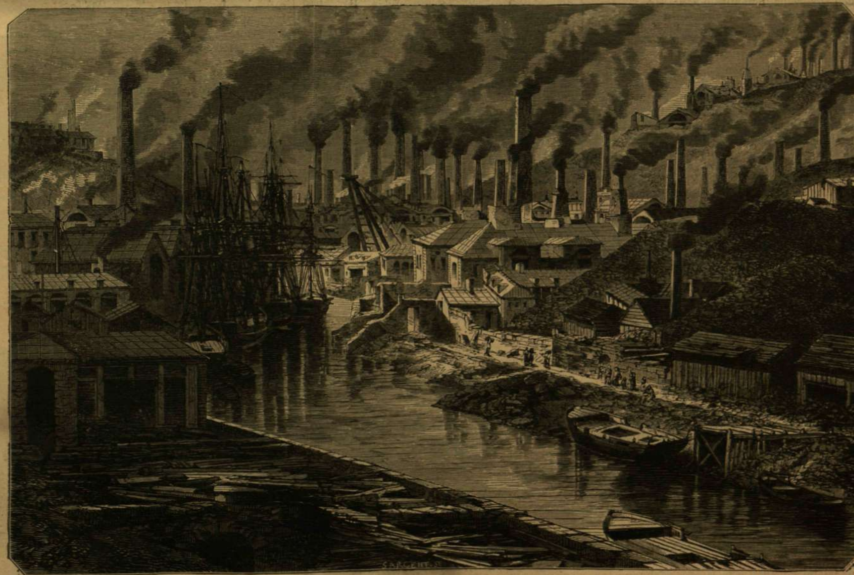
A VIVIAN-FÉLE GYÁRTELEP SWANSEA-BEN ANGLIÁBAN.