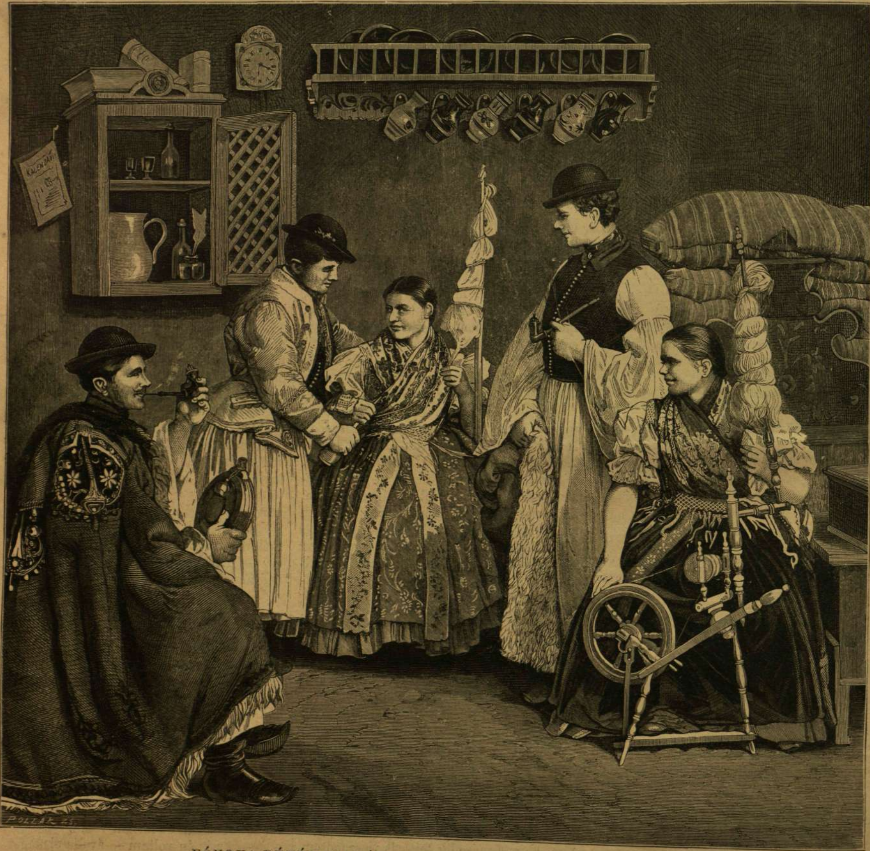
FÓNOKA BÉKÉS-CSABÁN. — (VARSÁGH János fényképe után rajz. JANKÓ.)

Szelima nem felelt, csak fejét hajtotta megmentője kebelére, s Hatem kezére,