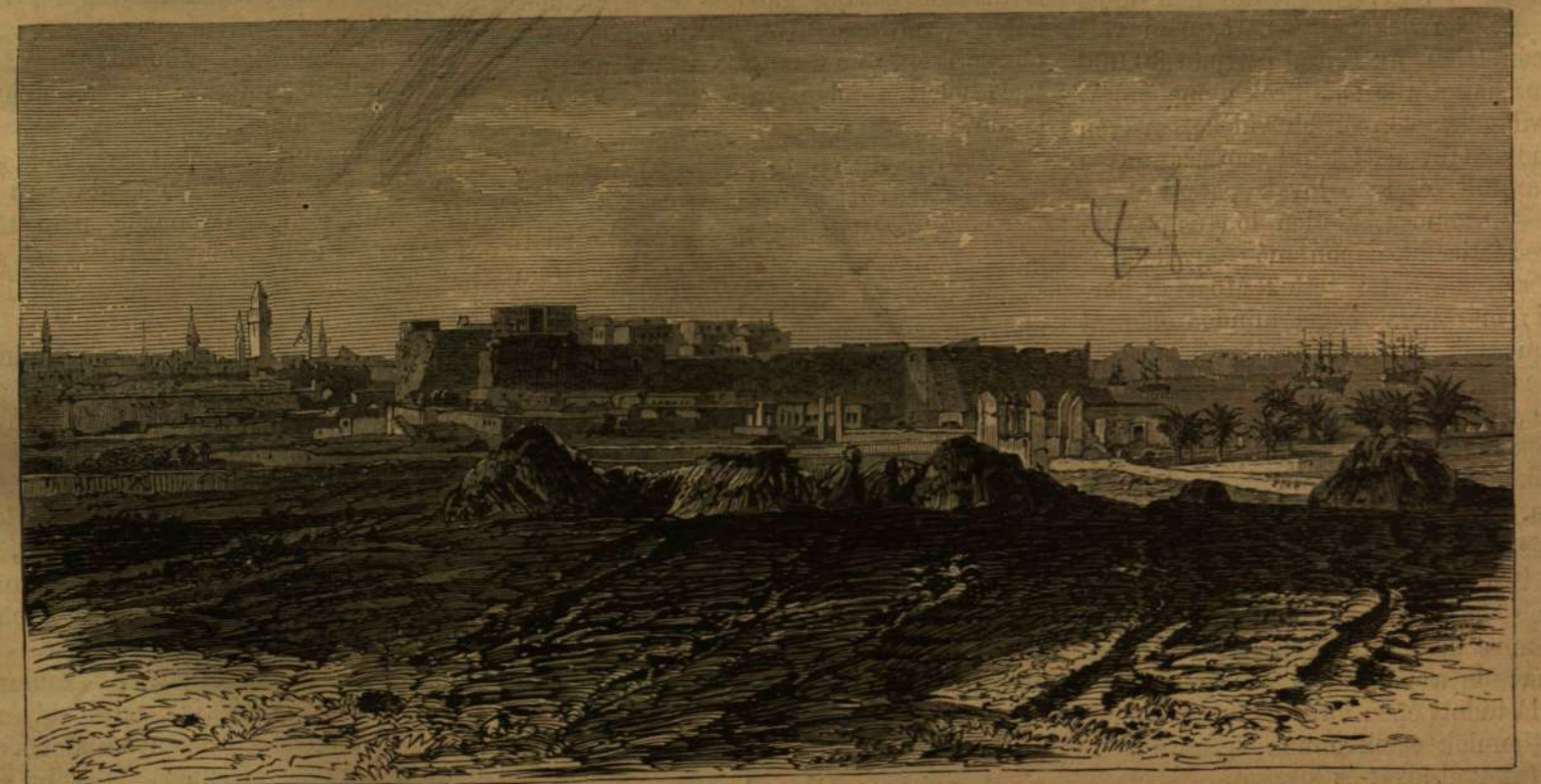
Tripolis, a szárazföldről tekintve. KÉPEK TRIPOLISBÓL.