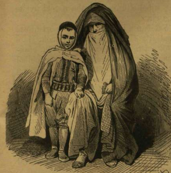
Előkelő mohammedán nő fiával.