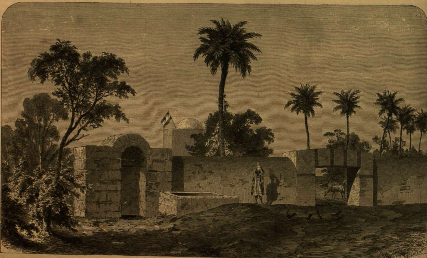
KARAVÁNSZERÁJ TRIPOLIS MELLETT.

1860-ban, az októberi diploma, az alkotmányos élet visszatértenek ez első fecskeje, őt is megint a közügyek szolgálatába szólította. B. Vay kancellár előterjesztésére Máramaros vármegye főispánjává neveztetvén ki, megyéje