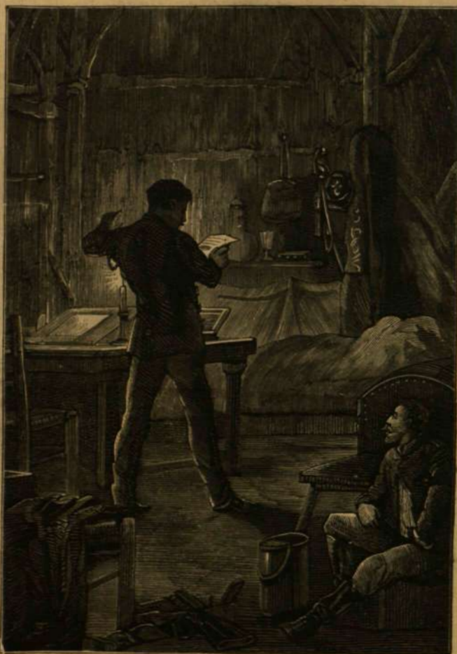
ÉLÉNK TAGLEJTÉSEKKEL SZAVALT.

A villámhárító a régi korban. Ha hihetünk Herodotusnak, a „történetírás atyjának“, a régiek jól tudták, hogyan kell a villámot hegyes vasrud segítségével az égből, illetőleg a viharos felhőkből lecsalni. Herodot azt írja, hogy a thrákok az eget le tudták fegyverezni mennyeiköveitől, még pedig azáltal, hogy vasnyilvesszöket lövöldöztek a fellegek közé; és a hyperboreusok (az Ural tájékán lakó törpe néptörzs) vashegyekkel ellátott végű dárdákat dobva a levegőbe, ugyanezt az eredményt érték el. Plinius szintén említi valami készüléket, melynek segítségével Porsenna égbeli tűz általsújtott agyon egy szörnyállatot, mely az ország egy részét pusztította. Azt is említi, hogy Numa Pompilius és Tullius Hostilius római királyok szintén értéktek bizonyos titokszerű fogáshoz, mely által tüzet csaltak le az égből. Hogy mi lehetett az a titokszerű fogás, nem érdemes kutatni; abból az egyszerű eseményből, hogy Tullius az előírt ovatosságot megteni elmulasztván, őt magát ölte meg az égi szikra, eléggé kitűnik, hogy neki a Newton által később feltalált villanyfogó-féle készülékkel volt dolga.