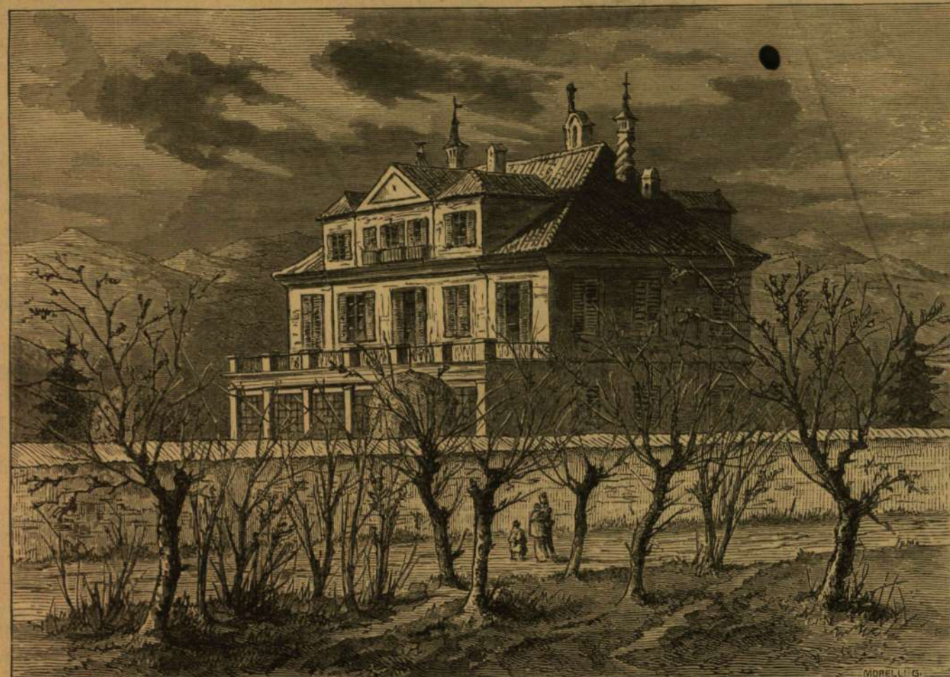
COLLEGNO (AL BARACCONE). — KOSSUTH HÁZA.