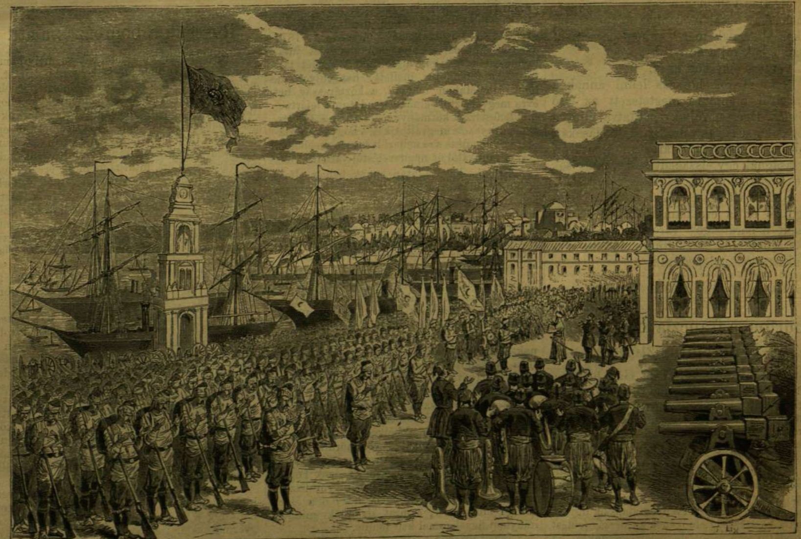
A HÁBORUBÓL. — A HARCZTÉRRE INDULÓ ZEJBEK CSAPATOK IMÁDKOZÁSA, A SZULTÁN ELŐTT, KONSTANTINÓPOLYBAN.