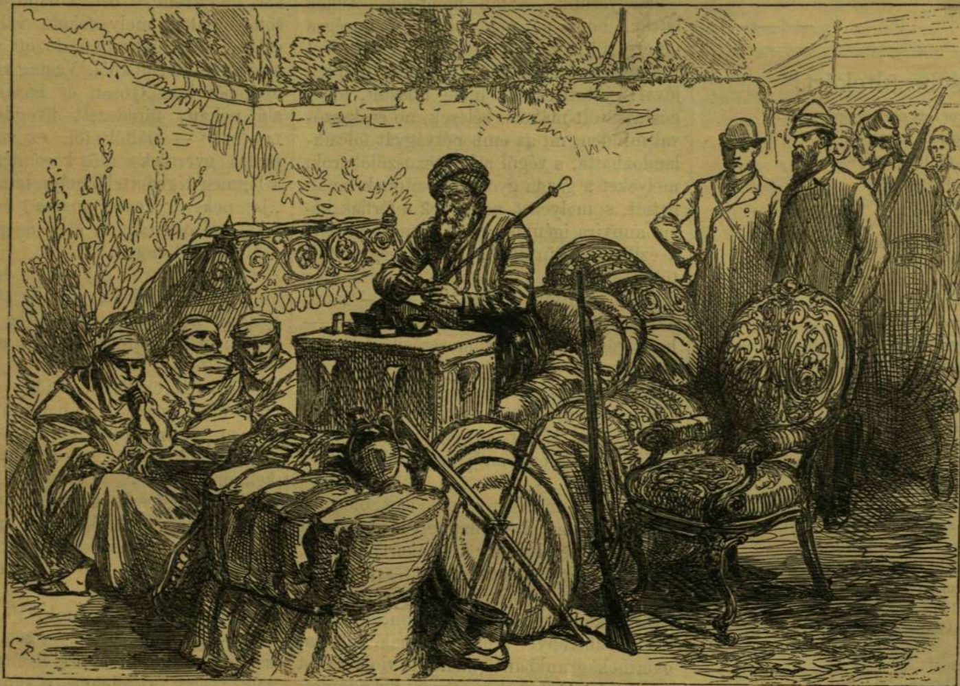
A HÁBORUBÓL. — RUSCSUKBÓL MENERÜLT ÖREG TÖRÖK HÁREMÉVEL.