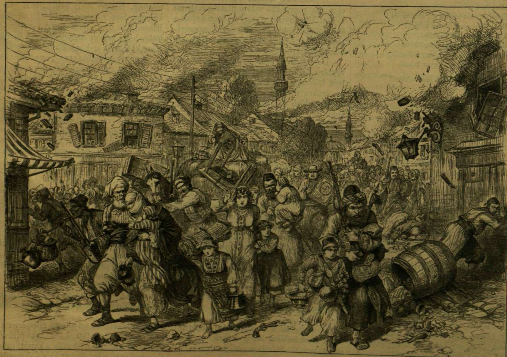
A HÁBORUBÓL. — TÖRÖK CSALÁDOK MENEKÜLÉSE RUSCSUKBÓL.