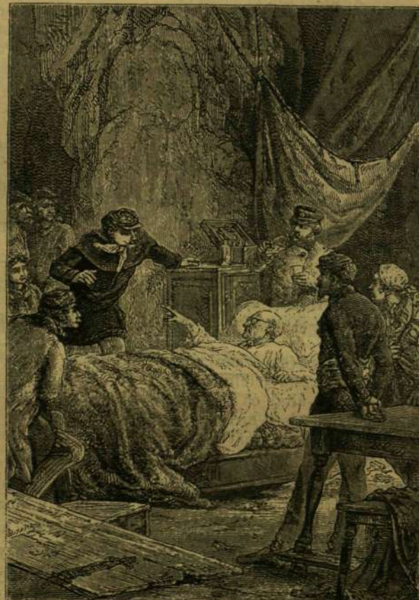
CSONTUJJÁVAL SERVADACRA MUTATOTT.

— E szerint, folytató Procop, a nagyszerű fényes égi test, mely egy ideig világítá éjeinket, az az üstökös lehetett, mely — miután földünk-ből egy darabot kiszakított, s azt velünk együtt a világűrbe lökte — más irányt vett, s folytatta utját, nagyobb levén mintsem a föld vonzása leköthette volna.