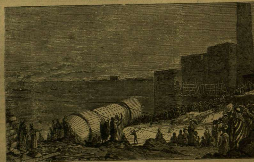
KLEOPATRA TŰJE: A LEDŐLT OBELISZK TENGERRRE SZÁLLÍTÁSA ALEXANDRIA MELLETT.