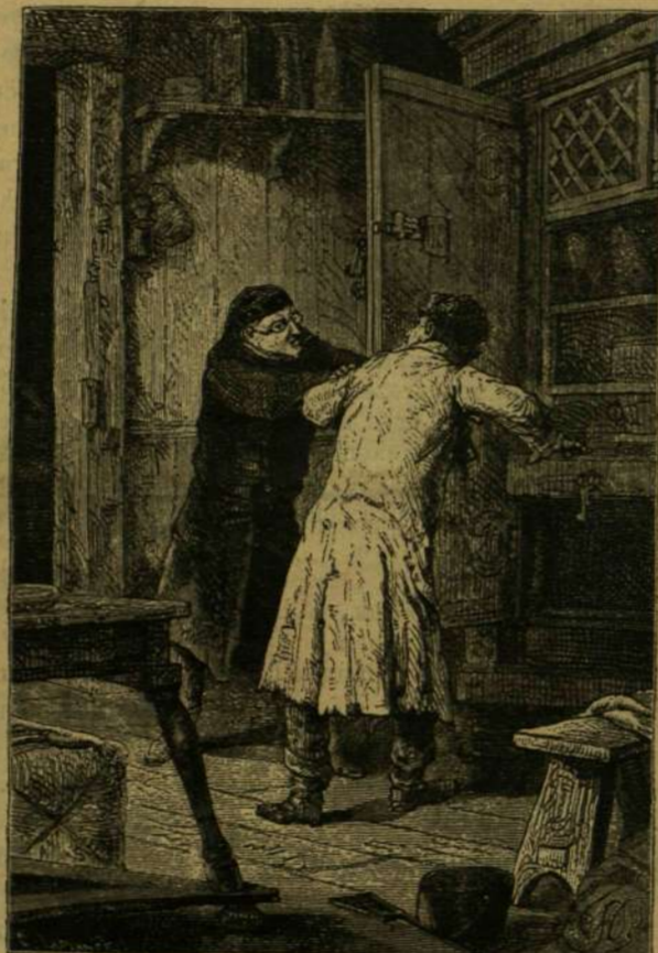
ODAUGROTT S NYAKON RAGADTA A ZSIDÓT.