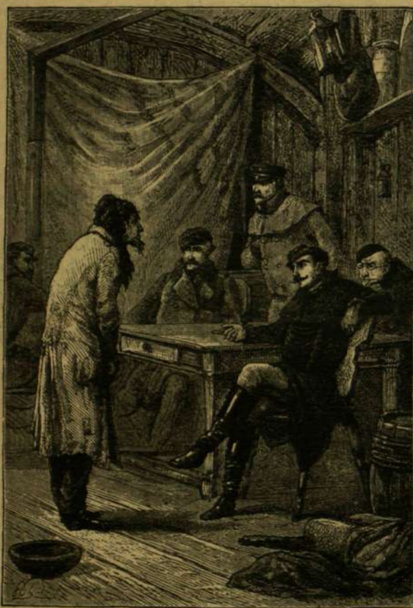
ISZÁK GÖRCSÖSEN, SZIGOROGVA ÁLLOTT ELŐTTE.

Spagolári falu délkeleti részén augusztus 23-án ütött tábor a török sereg, a legnagyobb esendben, eldugva az erdőszeg között. Sem trombita szó, sem dobergés nem zavarta az áttelenni ellent. Csak 25-én ment a cserkesz s basibozuk lovasság egy kis csapatja (50 ember) az ellen állását fölkeresni. A tüzes cserkeszek mindjárt meg is támadták a muszkat, megrohanták az ágyutelepet, az ágyukat elhozni nem bírták, de két ágyuslovat igen. Ez alkalomkor 4 zászlóalj mutatkozott az ellenél részéről. A következő napok csendesen végződtek, míg augusztus 30-án reggel hat órakor fölkerekedtünk, s egész két óráig tartott az elnyomó-