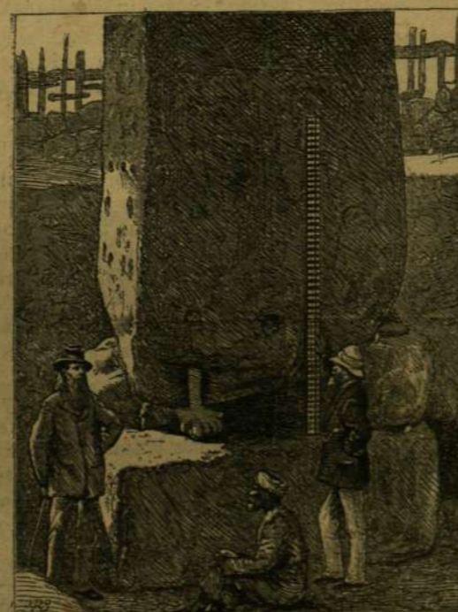
KLEOPATRA TŰJE: AZ ÁLLÓ OBELISZK.