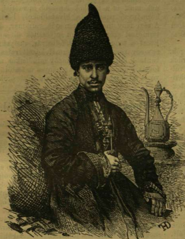
TRAPEZUNTI PERSA KERESKEDŐ.