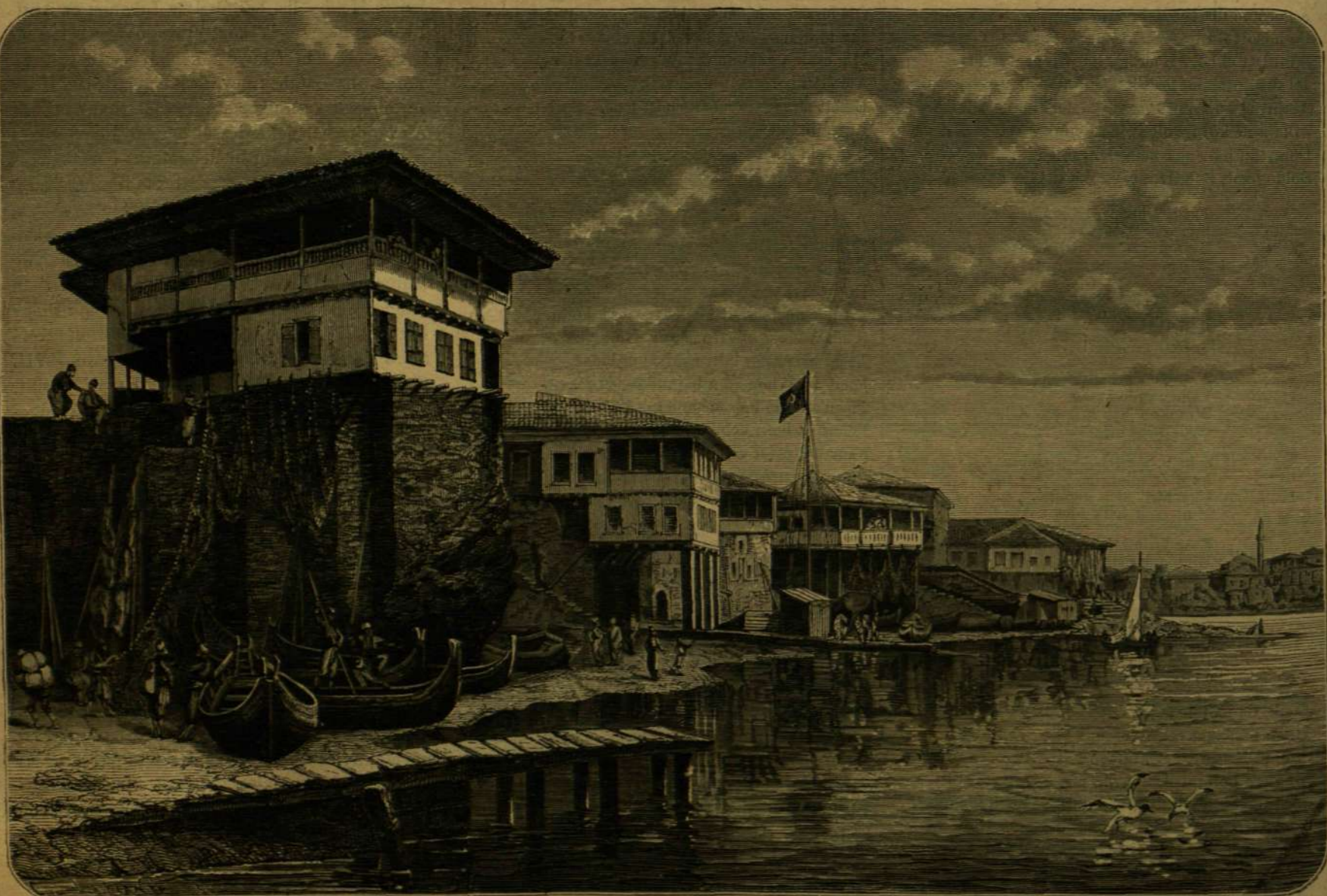
TÖRÖK-ÖRMÉNYORSZÁGBÓL. — A TENGERPART TRAPEZUNTNÁL.