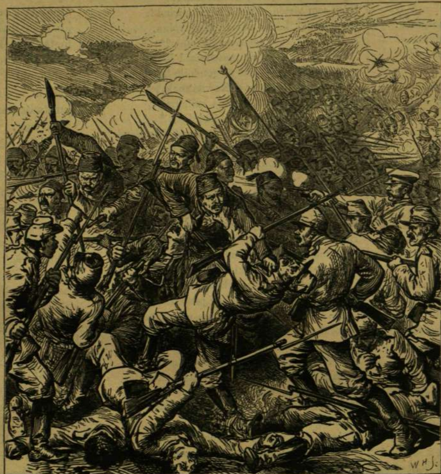
A HÁBORUBÓL. — VIADAL A PLEVNAI SÁNCZONNÁL.

Innen, mint egy közös központból, durván kövezett szűk utak indulnak ki a kertekben gazdag külvároson át minden irány felé. A jobbra menő út egy második terraszra kapaszkodik föl, mely szintén házakkal, szántóföldekkel és kertekkel borított nagy terjedelmű tért képez; a balra vivő út pe-