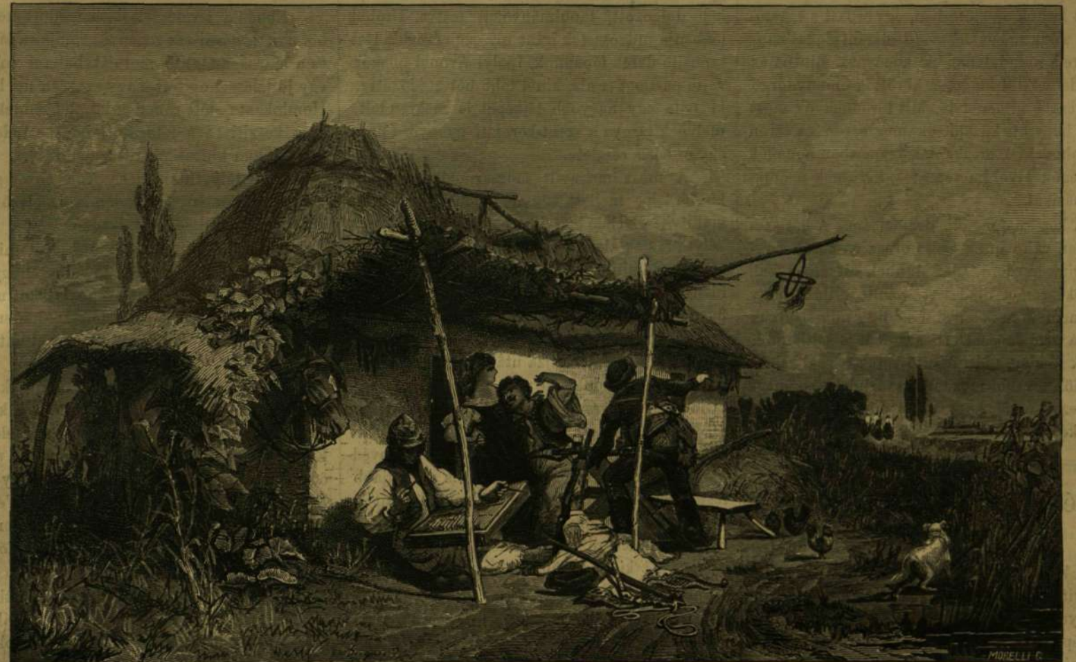
MEGZAVART BETYÁROK. — SAJÁT FESTMÉNYE UTÁN RAJZ. GREGUSS IMRE.