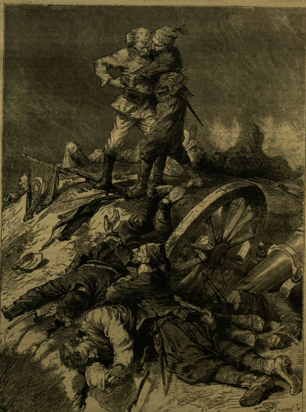
A HÁBORUBÓL. — A SÁNCZTETŐN.

VASÁRNAPI UJSÁG Előfizetési feltételek: VASÁRNAPI UJSÁG és POLITIKAI UJDONSÁGOK együtt: egész évre — 12 frt, fél évre — 6 * Csupán a VASÁRNAPI UJSÁG: egész évre — 8 frt, fél évre — 4 * Csupán a POLITIKAI UJDONSÁGOK: egész évre — 6 frt, fél évre — 3 * 45. szám. — 1877. Budapest, november 11. XXIV. évfolyam.