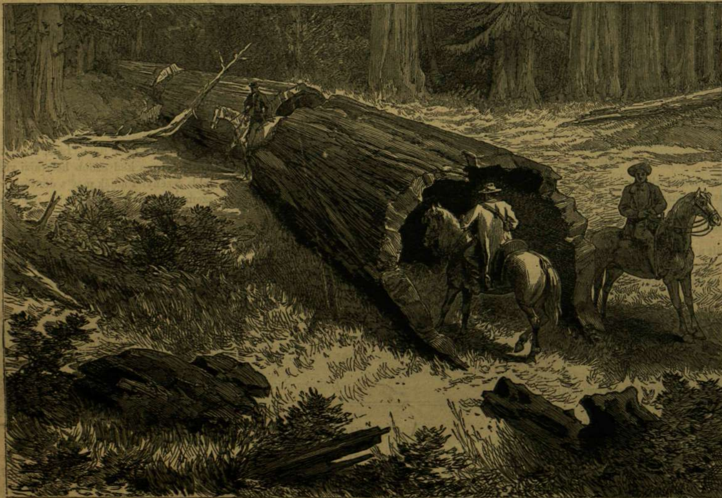
LEDÖLT ÓRIÁS FÁK KALIFORNIÁBAN.