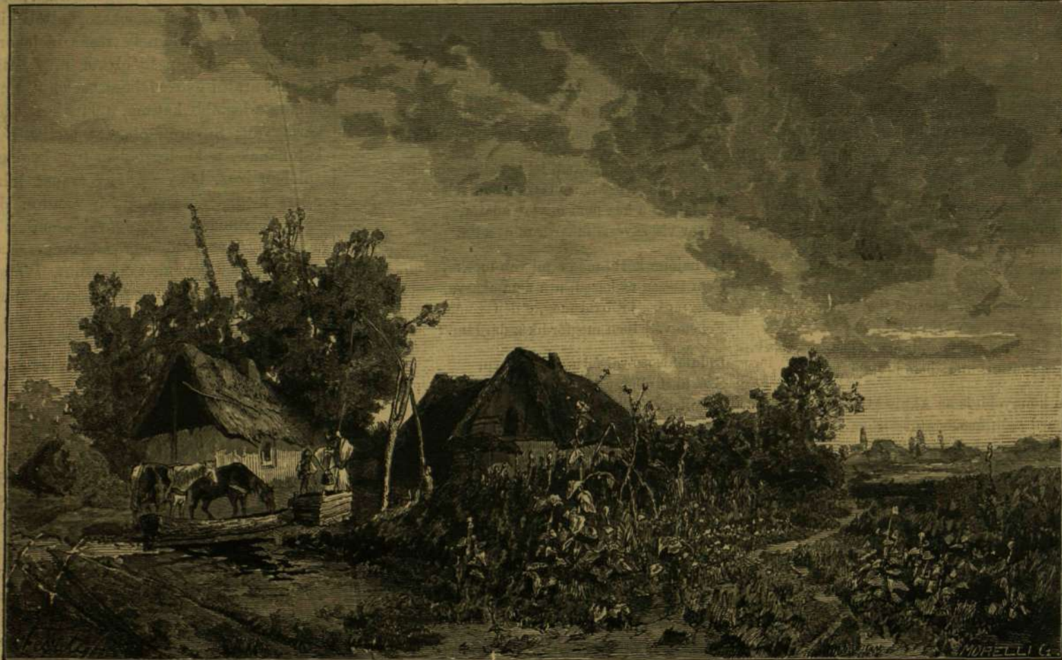
ALFÖLDI TANYA. — (SAJÁT FESTMÉNYE UTÁN RAJZ. FESZTY ÁRPÁD.)