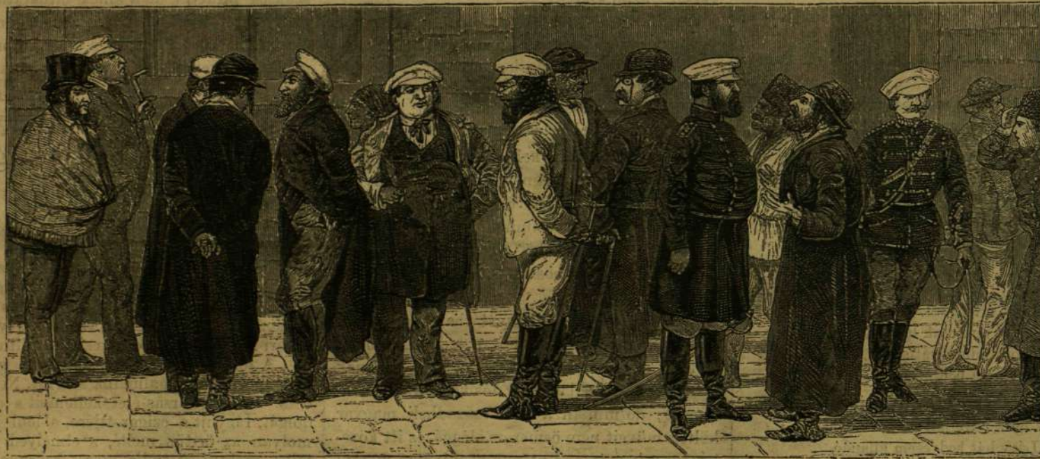
A BUKARESTI BÖRZÉN.

A mi a katonák élelmezését illeti, az rendkívül esetek kivételével elég jónak mondható, háromszor kapnak enni egy nap; — reggelire rizslevest, ebédre vagy pilafot hussal, vagy valami nemű főzeléket, szintén elegendő mennyiségű hussal, vacsorára tészta étellel kell megelégedniük. Ez ételmennyiséghez jár még egy okka (1 kilogram) kenyér, mely nem mondható rosznak. Nagyon természetes azouban,