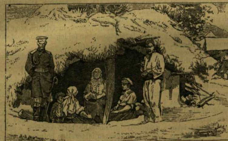
STRAKOFF TÁBOROK TANIJA GORNI-STUDENBEN.

vedésének enyhítésére. E most említett tájon, s az imént nevezett jótékony intézetek sorában méltó helyet foglal el a folyó hó 17-én ünnepélyesen megnyitott országos, protestans uj árvaház,