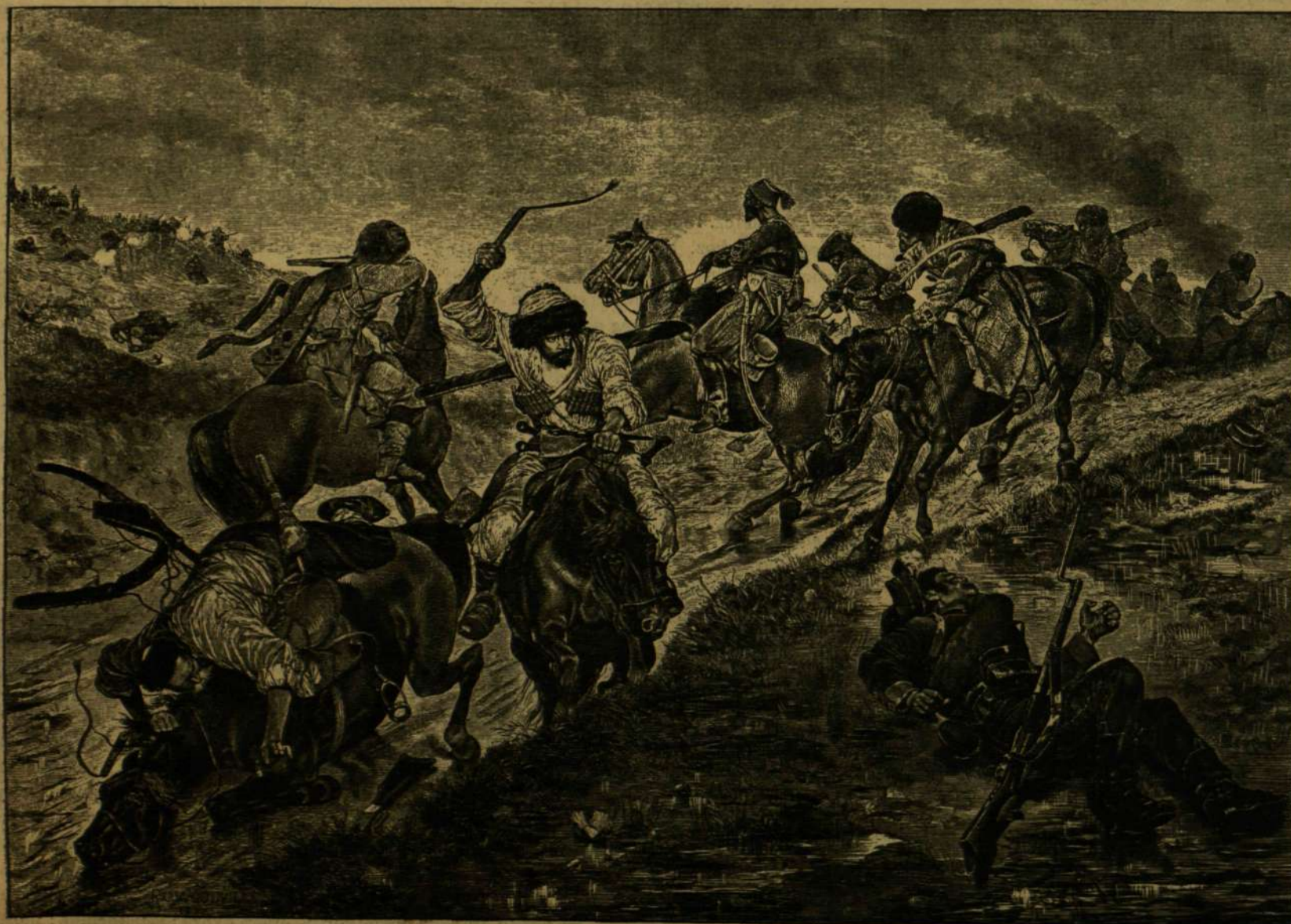
CSATÁROZÁS A PLEVNAI UTON. A HÁBORUBÓL.

nyos paszomántos bársony vagy atlatzsuba, 8 aranyos gyémántokkal, gyöngyökkel boglárókkal kirakott fejkötő, öt korona, 3 párta hasonlólag arany szemekkel, gyöngyökkel, boglárókkal kirakva, hat épen oly drága süveg. Arányban állott ezekkel a fehéremük száma: ezek közt arannyal, ezüsttel, selyemmel kivarrott „orzatakarók“ (fátylak), fejkötők, török varrások kérevaló taczlak, atlatz hajfonók, nyakba való fodrok — ide nem számítva a lepedőket, ingeket, párnahajakat, stb.