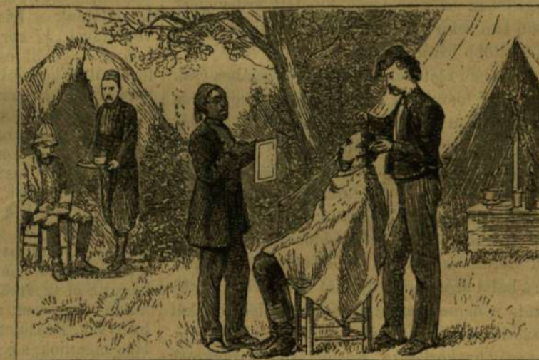
TÖRÖK TÁBORI BORRÉLYI.