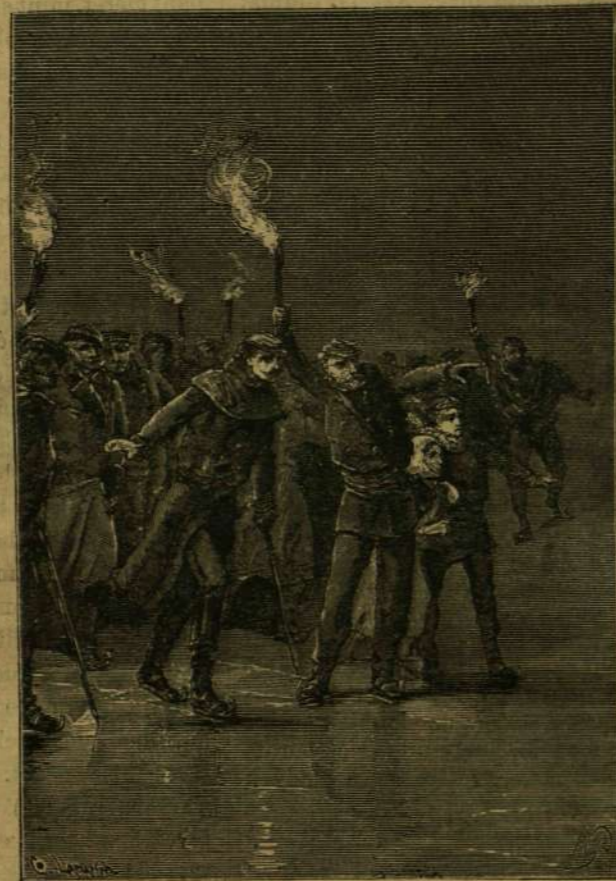
BEN-ZOUF A VULKÁN FELÉ MUTATOTT.