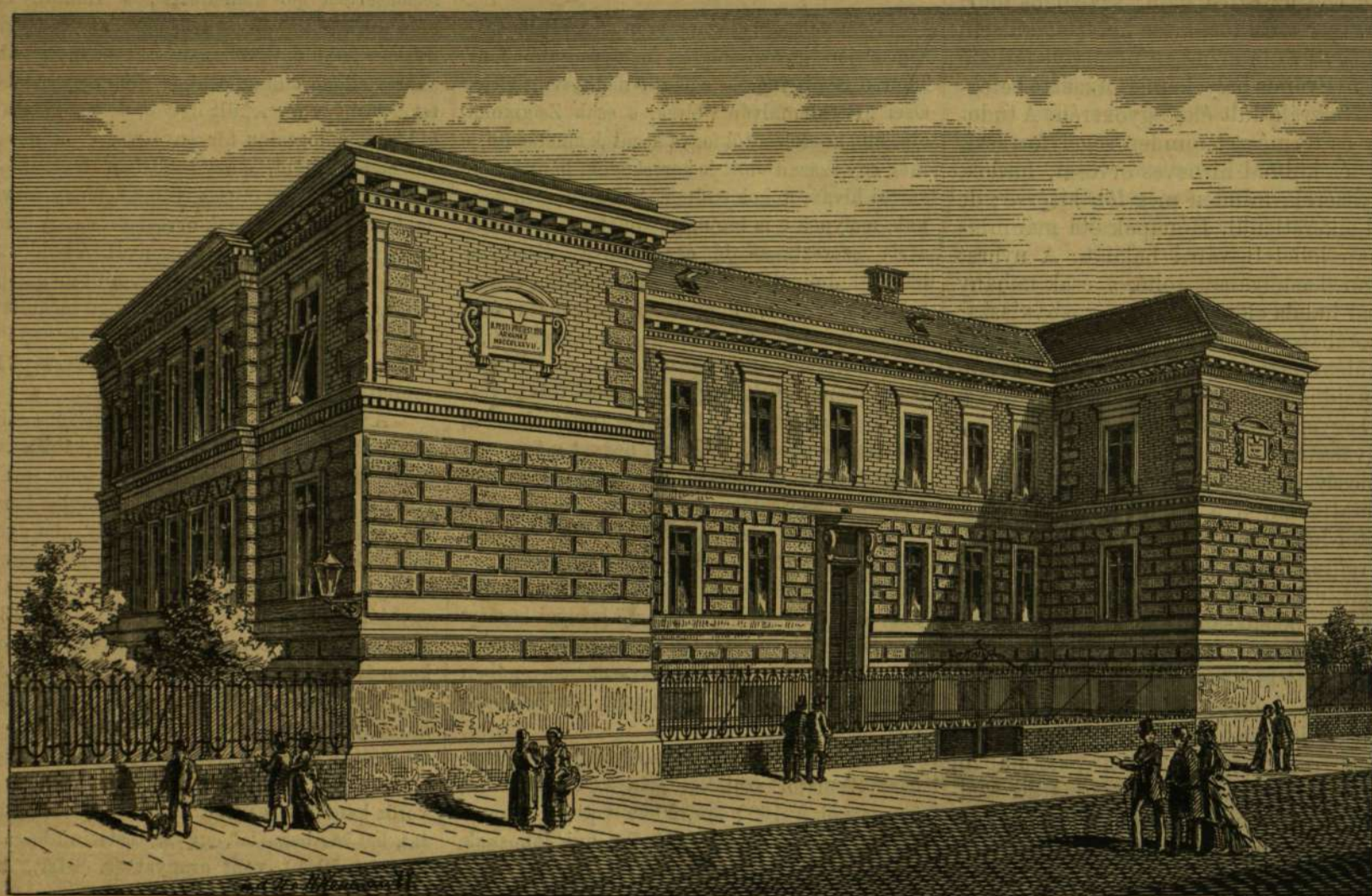
AZ ORSZÁGOS PROTESTÁNS UJ ÁRVAHÁZ.