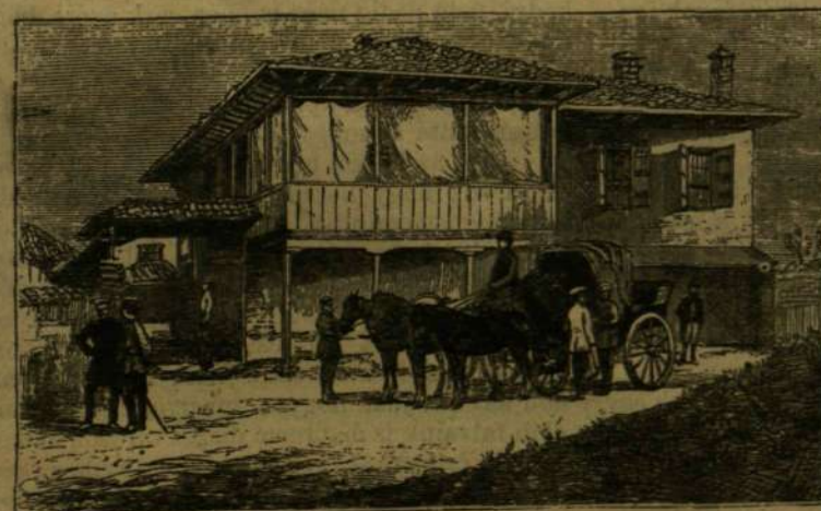
A CZÁR LAKÁSA GORNI-STUDENBEN.