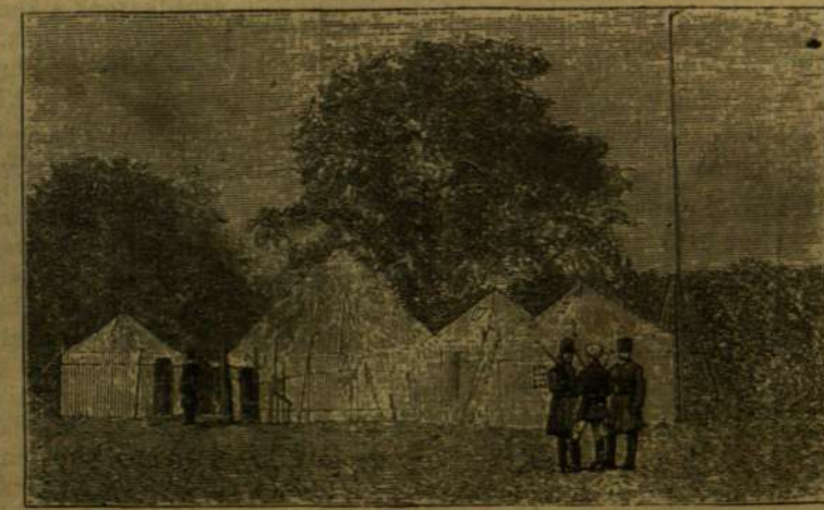
A CZAREVIC SÁTRA OBIRTENKIBEN.