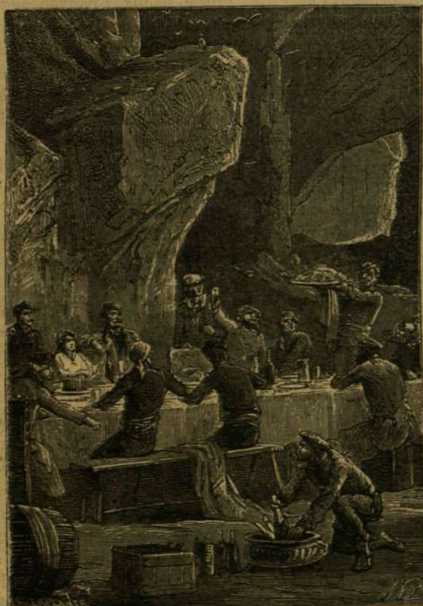
FELKÖSZÖNTÉS FELKÖSZÖNTÉST KÖVETETT.

A római Szt.-Péter templom kupolája ismét komoly aggodalmakra szolgáltat okot, mert a repedések és hasadások a kupola felső részén egyre szaporodnak és tágulnak. Egy bizottság, mely a monumentális épületet közelebbről megvizsgálta,