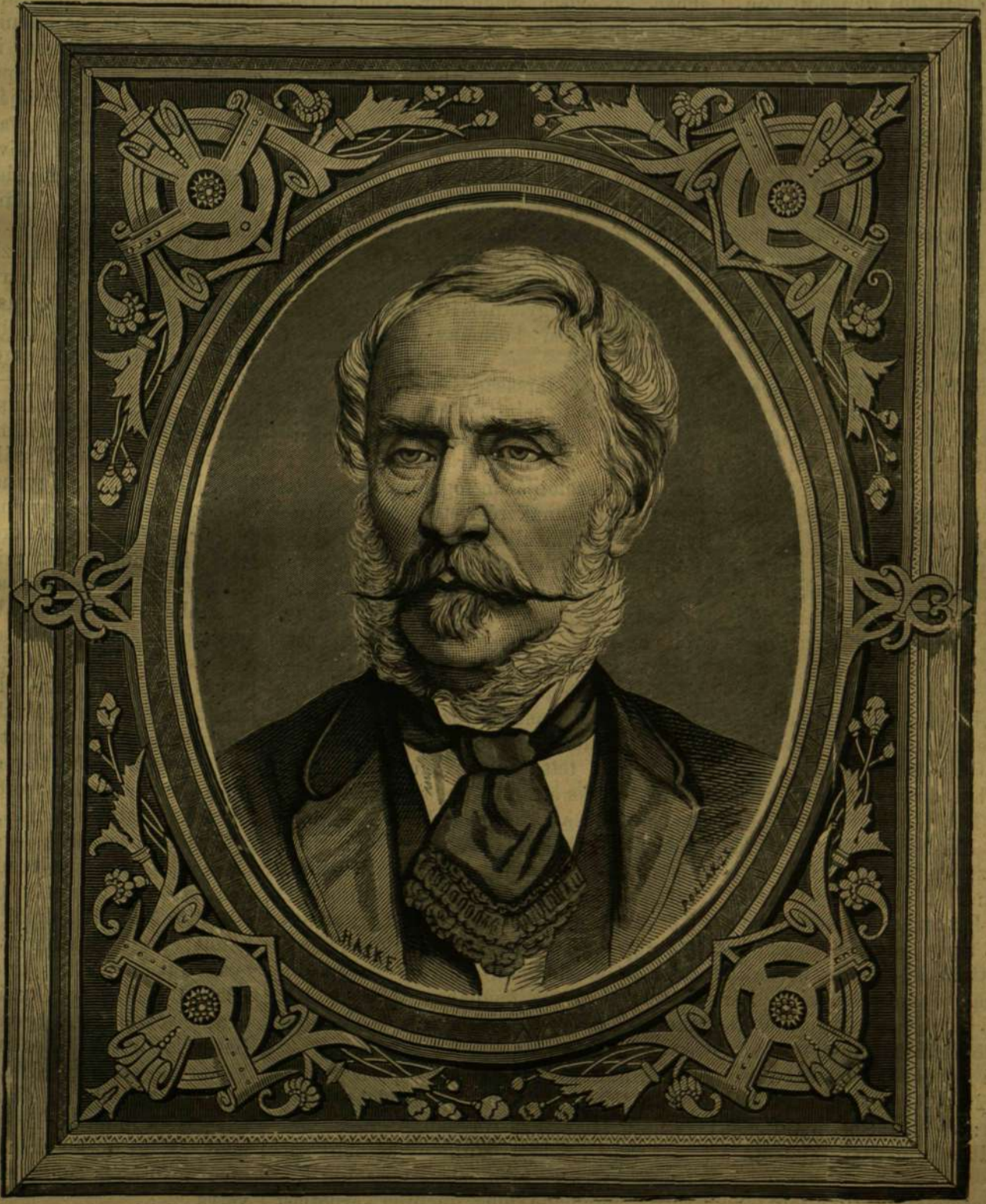
GRÓF KÁROLYI GYÖRGY.

Előfizetési föltételek: VASÁRNAPI UJSÁG és POLITIKAI UJDONSÁGOK együtt: egész évre - 12 frt félévre - 6 „ Csupán a VASÁRNAPI UJSÁG: egész évre - 6 frt félévre - 3 „ Csupán a POLITIKAI UJDONSÁGOK: egész évre - 6 frt félévre - 3 „ 46. szám. — 1877. Budapest, november 18. XXIV. évfolyam.