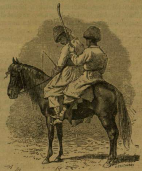
Tatár gyermekek lóháton.

is. Máskülönbben a kozákok, mikor békeben otthon tanyáznak, s földjeiket művelik, nem igen különböznek Kis-Oroszország egyszerű földmivelőtől; ugyanoly sapkát és ködmönt viselnek, mint amazok. A nők is majd mindig és mindeütt ugy öltöznek, mint a kis-orosz nők.