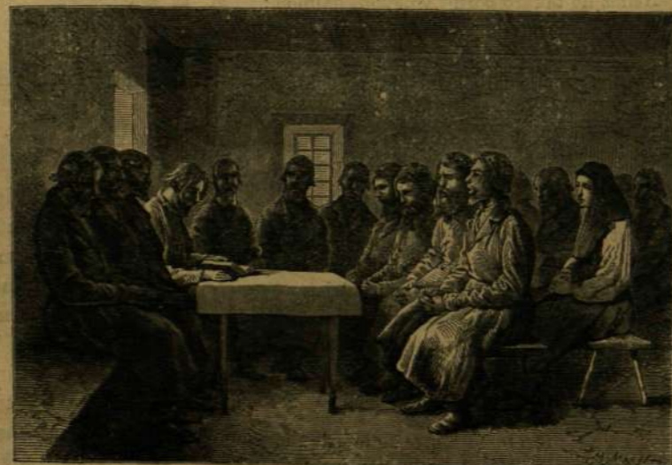
A malakhany-felekezet isteni tisztelete.