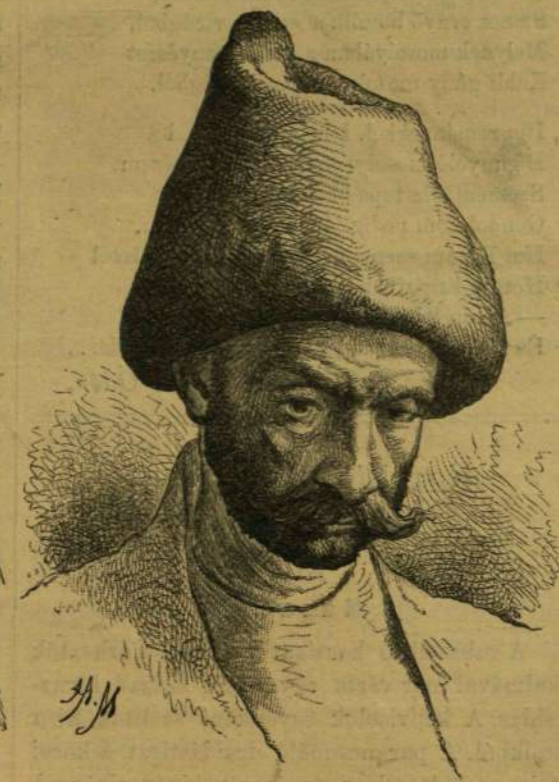
Tatár férfi (Sohsábó')