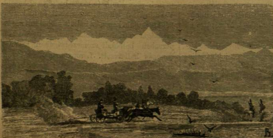
A Kankázus közép csoportjának távképe.