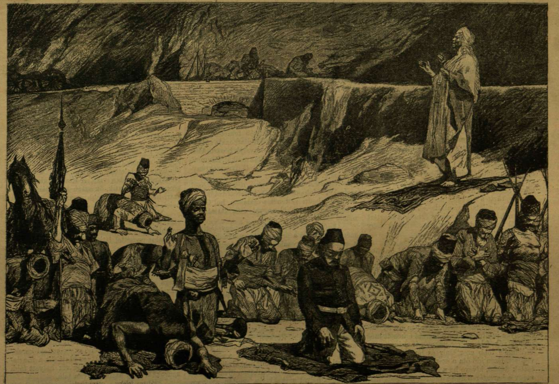
AZ ÁZSIAI HARCZTÉRRŐL. — TÖRÖK HARCZOSOK IMÁJA A CSATA ELŐTT.

Szabadságukban állott egész napon át összefűzött karokkal, és lábukat egymásra vetve, szalmaszékükön pihenni. De hol volt az ágy? Hol feküdtek? Napközben sehol, mert a börtönben nem volt ágy. Este nyolcz órakor a porkoláb belépett a börtönbe és a padozat tetejéről lebocsátott egy függő ággyat. Ezzel jó éjt kívánt és távozott. A függő ággyban volt takaró, néha mintegy két ujjnyi matracz. A fogoly a vászontakaróba burkolta magát és megkísérlé az alvást, de e helyett legfeljebb csak didergett. Másnap reggel azonban remélhetőleg az egész délelőtöt ággyában tölthette? A világért sem!