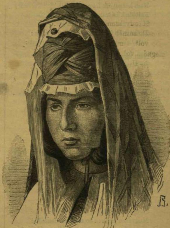
Fiatal tatár nő.