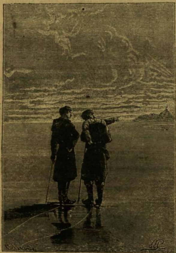
TELEGRAF, A MI A KARJÁT MOZGATJA.

Az indulás másnapra, november 2-dikára volt határozva. Az utasok megtették előkészületeiket. Táskájukba füstölt és préselt húst, egy kézi távosót s egy iránymutató delectt tettek; prémes ruhákkal pedig jól ellátták magokat. Servadacnak, az említett emberbaráti czél mellett még egy más mellékgondolata is lehetett,