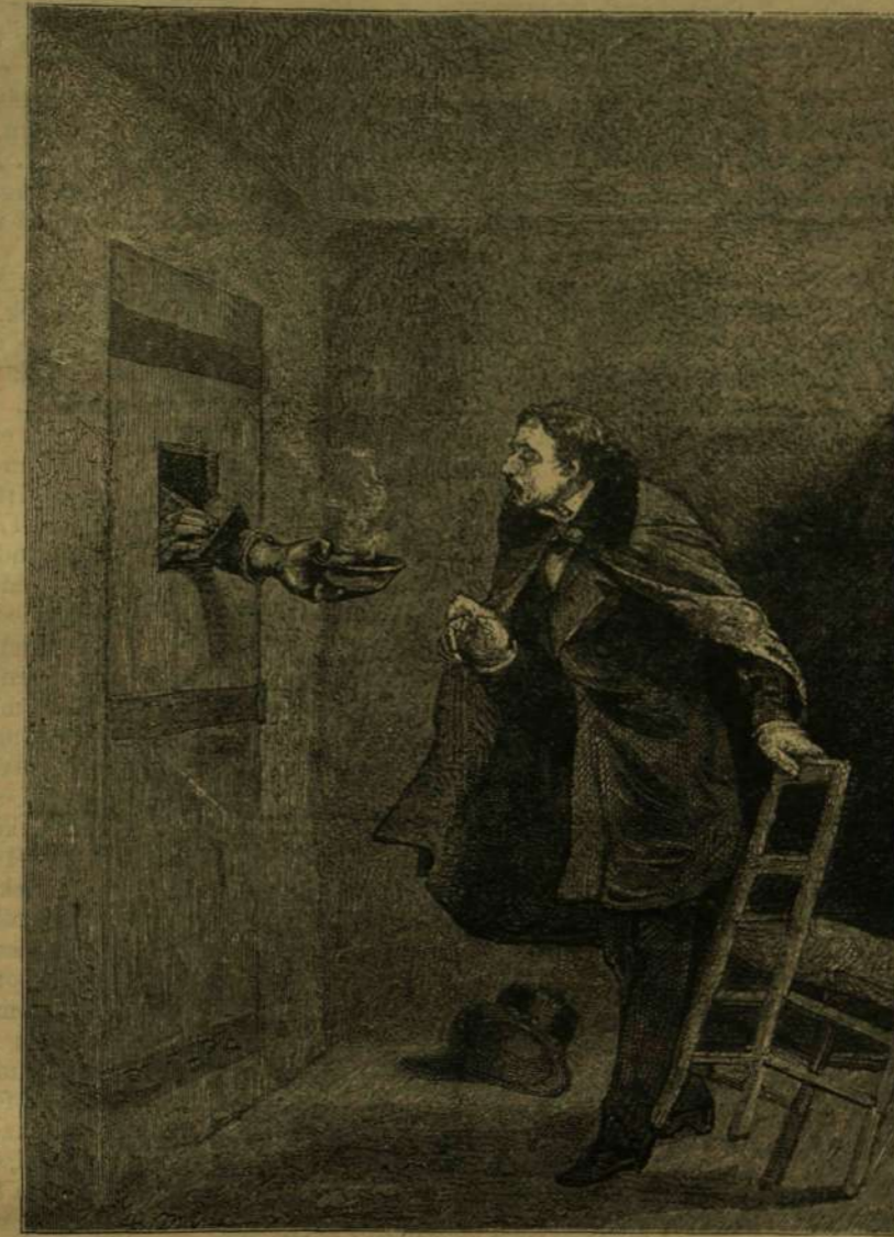
A képviselő a Mazasban. — A fogház harangja megszólalt, s az ajtó nyílásán keresztül egy kéz kenyérdarabot és czintányért nyújtott be a fogolynak.

— Beszéljünk tehát tolvajnyelven, kiáltott át neki tolvaj szomszédja, kit ezen szavaiért sötét börtönbe zártak.