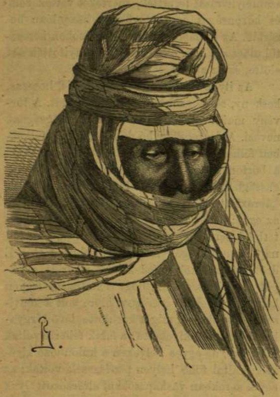
Öreg tatár nő.