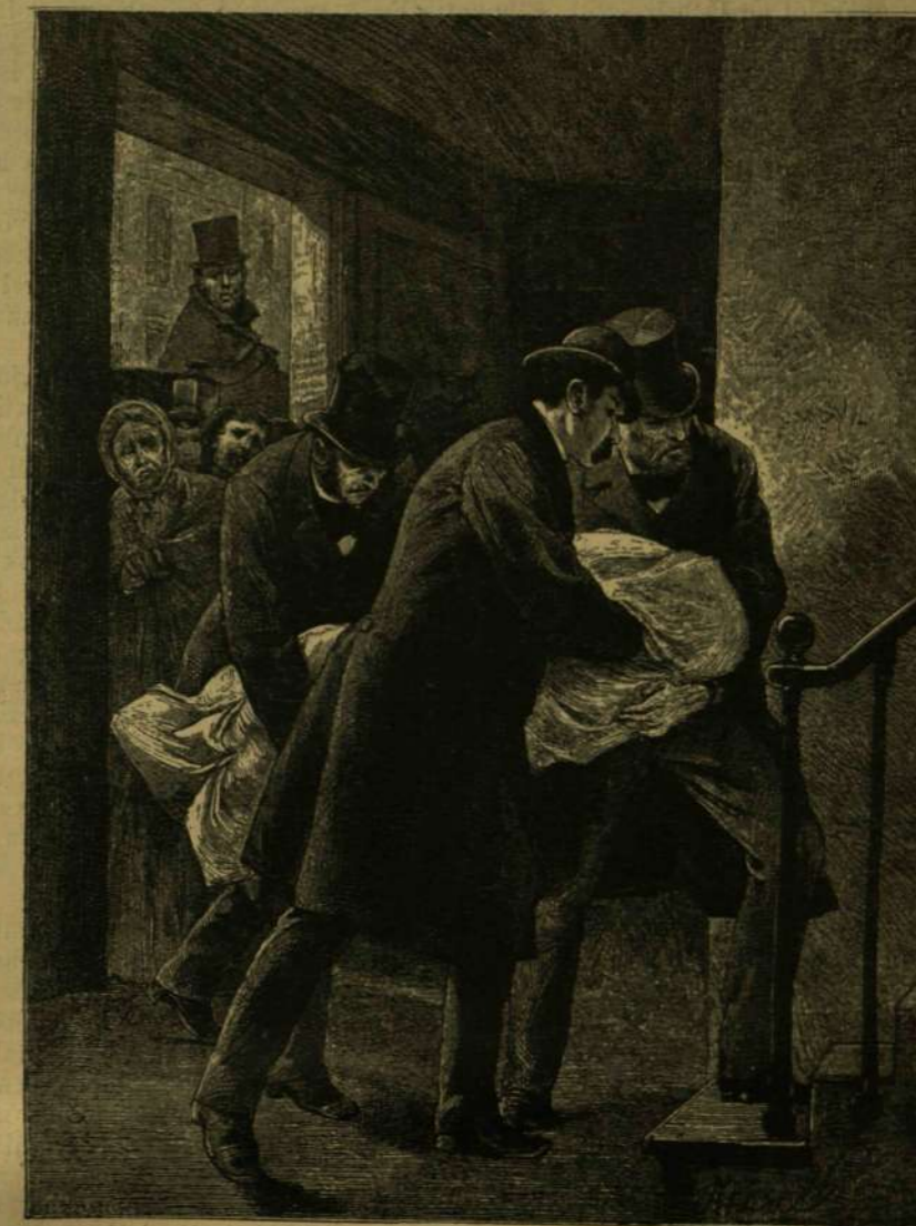
EGY BŰN TÖRTÉNETE.