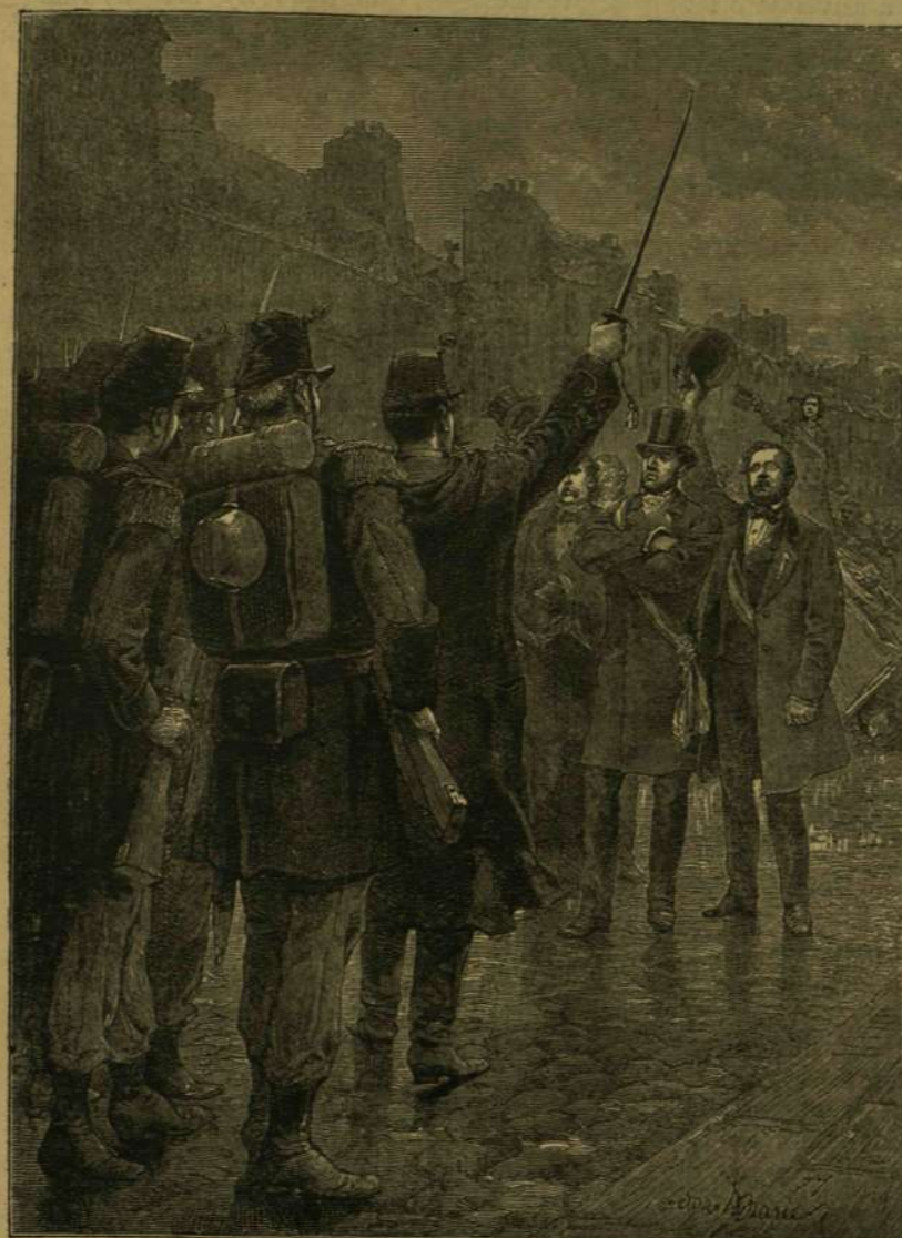
A St.-Antoine utcai torlasz. — „Szuronyt szegezz, előre!” vezényelt a kapitány. „Eljen a köztársaság!” válaszolák a képviselők.