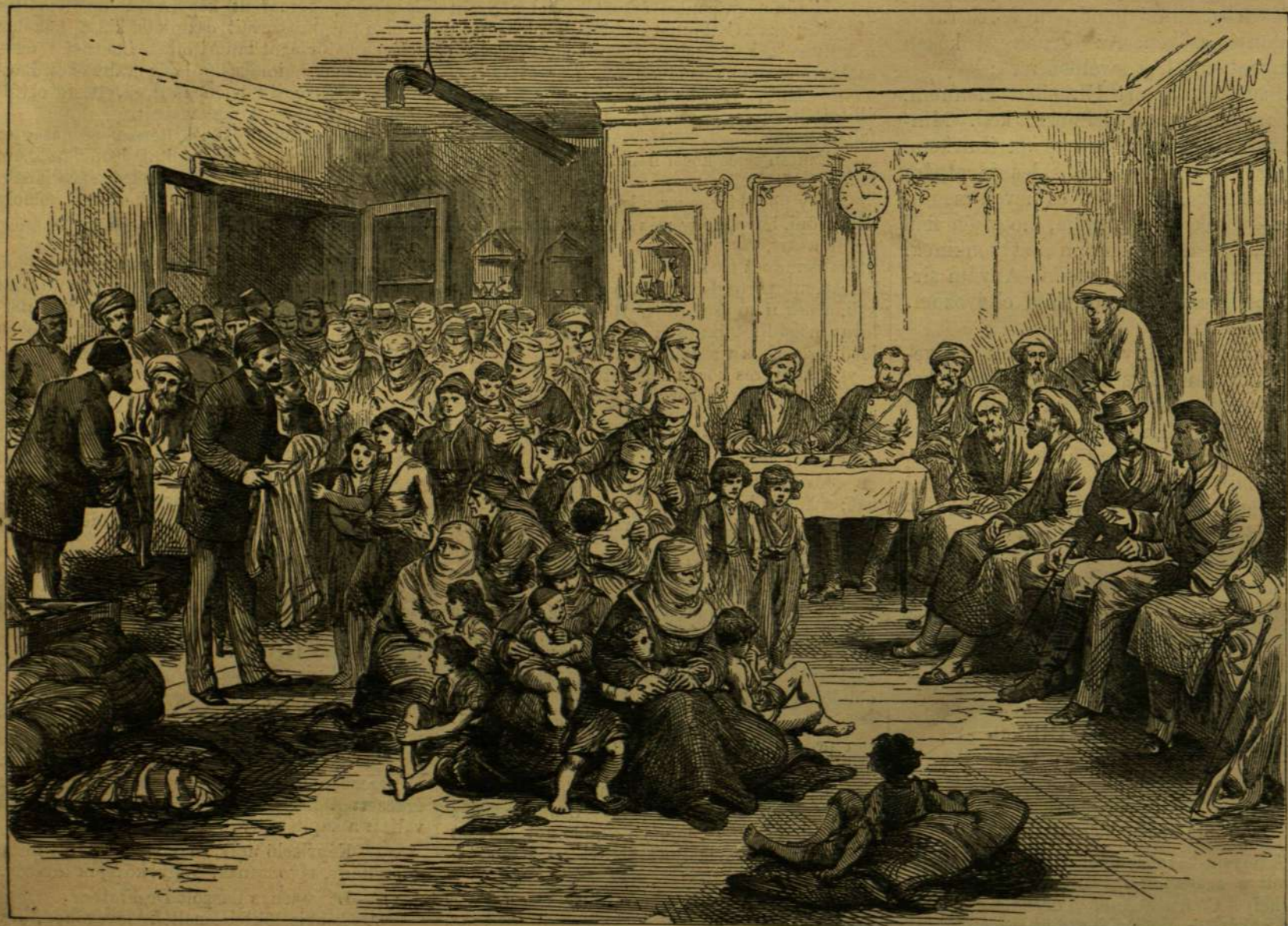
SZERETETADOMÁNYOK KIOSZTÁSA TÖRÖK MENEKÜLTEK KÖZT SUMLÁBAN.