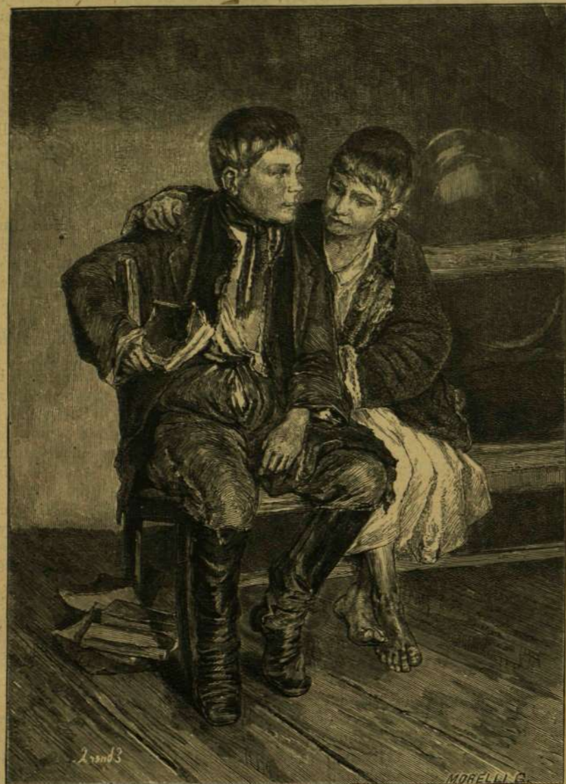
A KÉT JÓ BARÁT.

A katonák egyike ugyanis a kapitánynak akart utat csinálni, és e közben szuronyával megérintette. A szurony hegye a képviselők név- és czimtarába ütözött, melyet Schoelcher magánál hordott, és ennek folytán csak felöltőjét szurta keresztül. A katonák egyike azt mondá