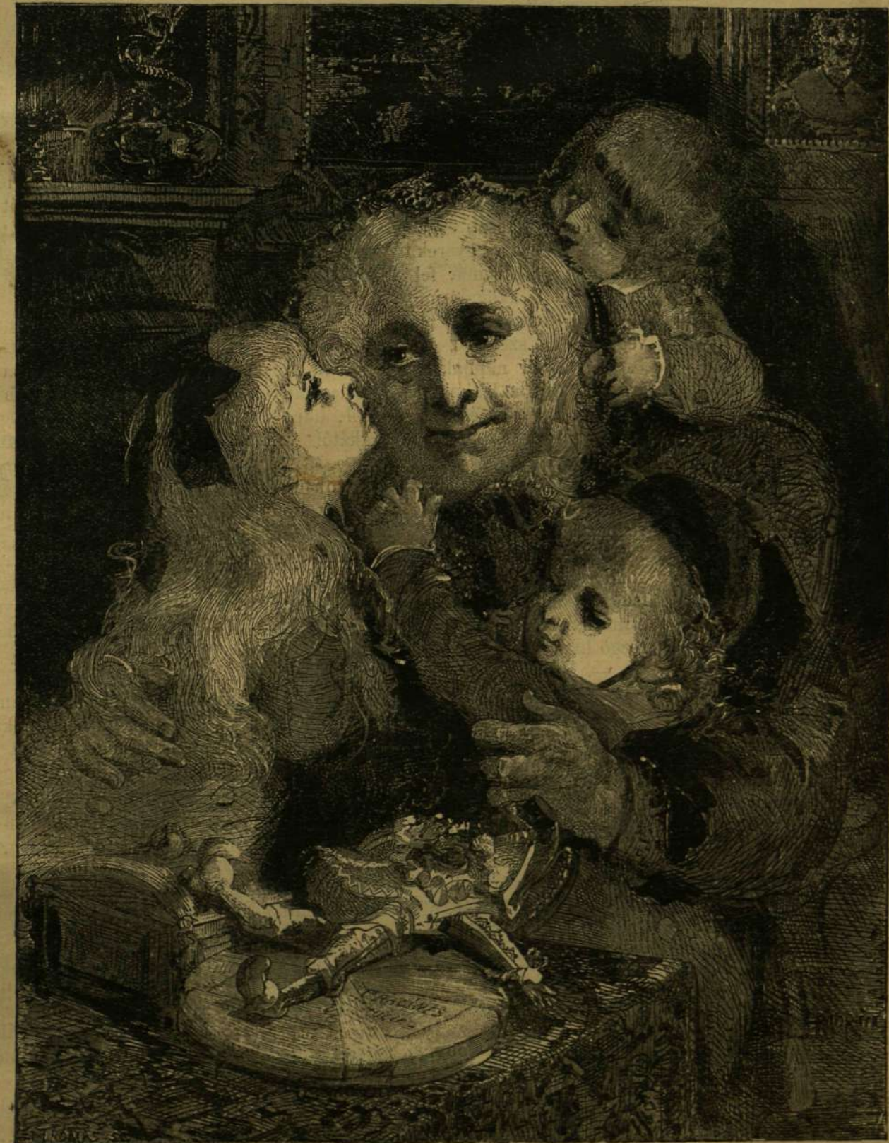
A NAGYANYA KARÁCSONYA. — ARANY HAJAK, EZÜST HAJAK.