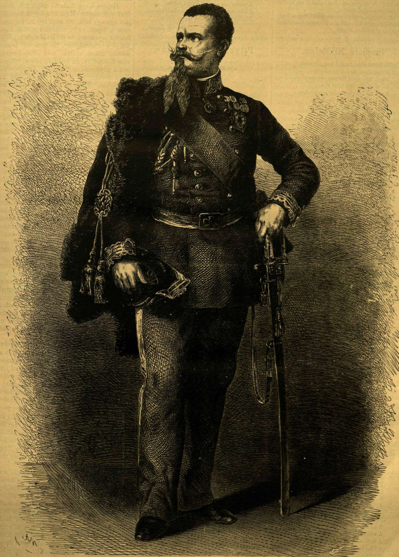
VIKTOR EMÁNUEL, OLASZ KIRÁLY.