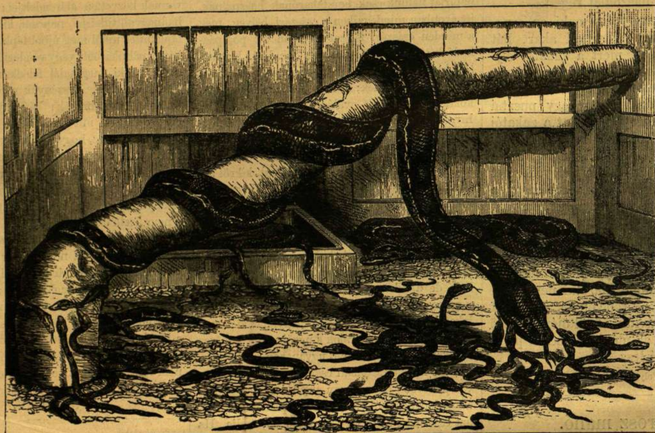
AZ ÓRIÁSI KIGYÓ CSALÁDJA A NEW-YORKI AQUARIUMBAN.