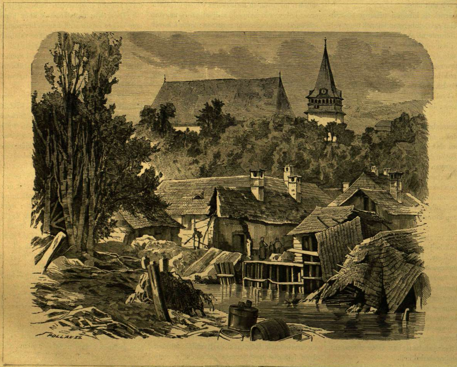
MISKOLCZI VÉSZ. — A „TORONYALJA“.