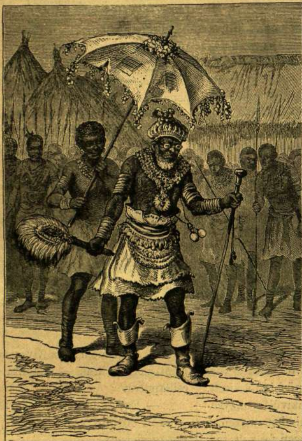
A KAZONDEI KIRÁLY EGÉSZ POMPÁJÁBAN.