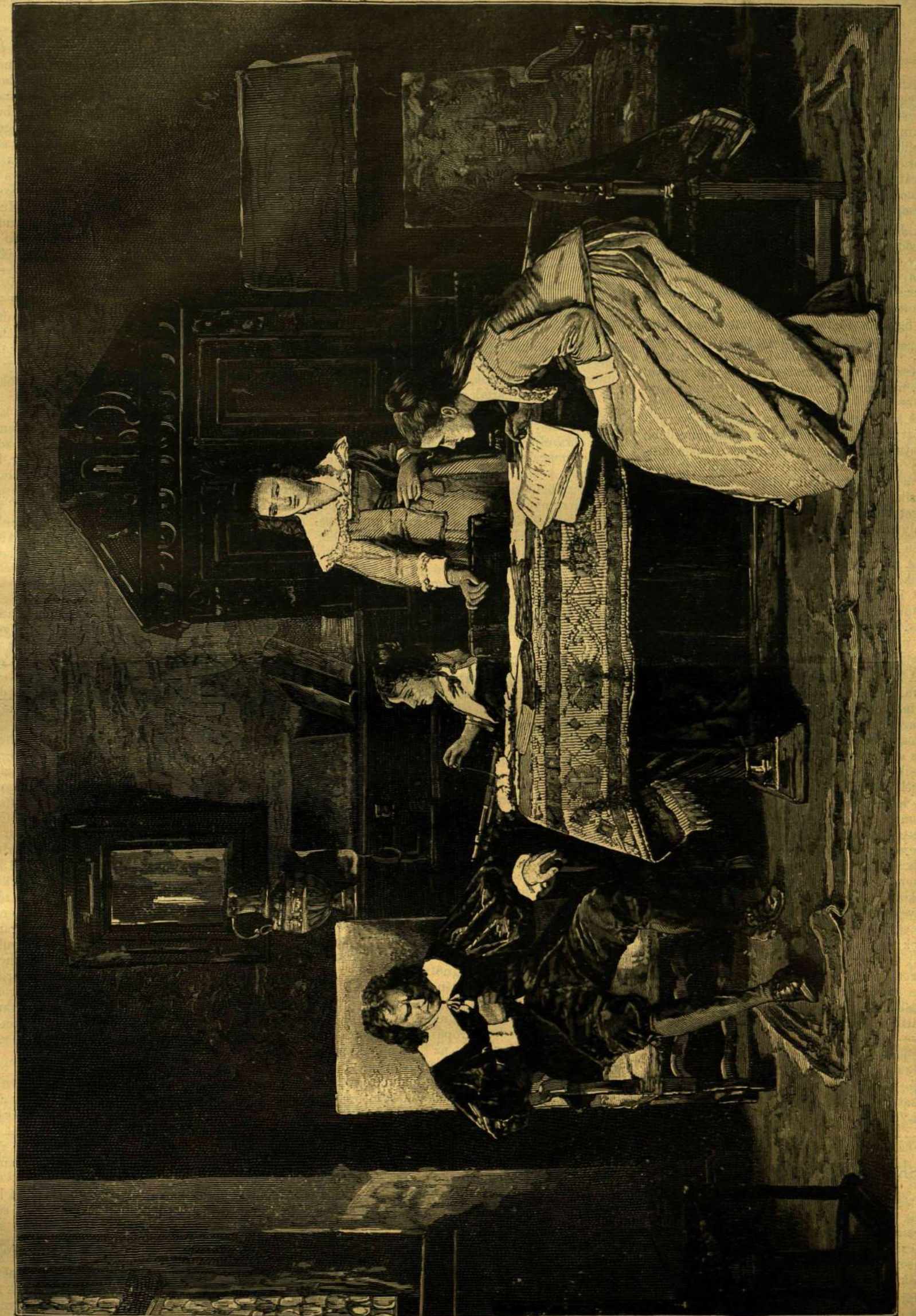
MILTON TOLLEBA MONDJA AZ „ELVESZTETT PARADICSOM“-OT LEANYAINAK. — MUNKÁCSY MIHÁLY FÉNYKÉPE UTÁN.