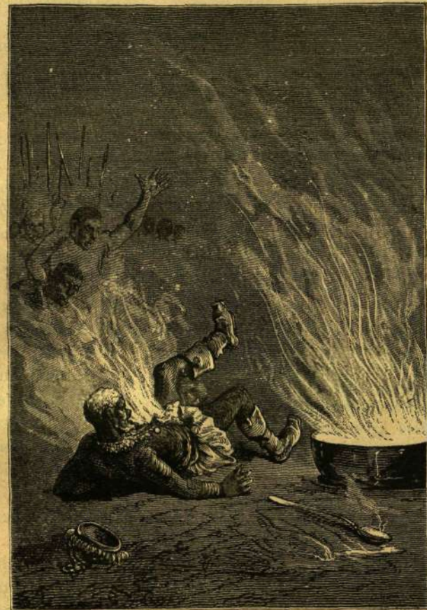
A MEGGYÚLT KIRÁLY.