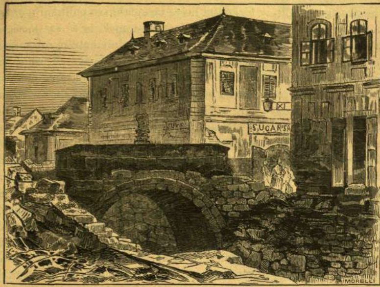
A PIACSI HÍD.