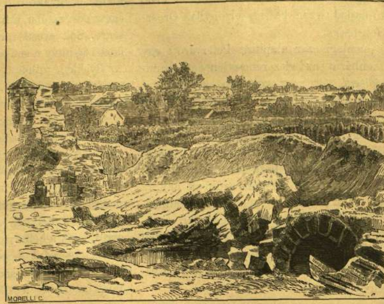
A VÁROS BESZAKADT BÁSTYÁJA.