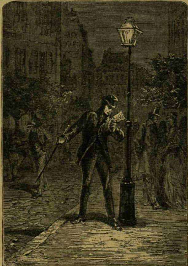
UJRA ELÖLVASTA A LEVELET.