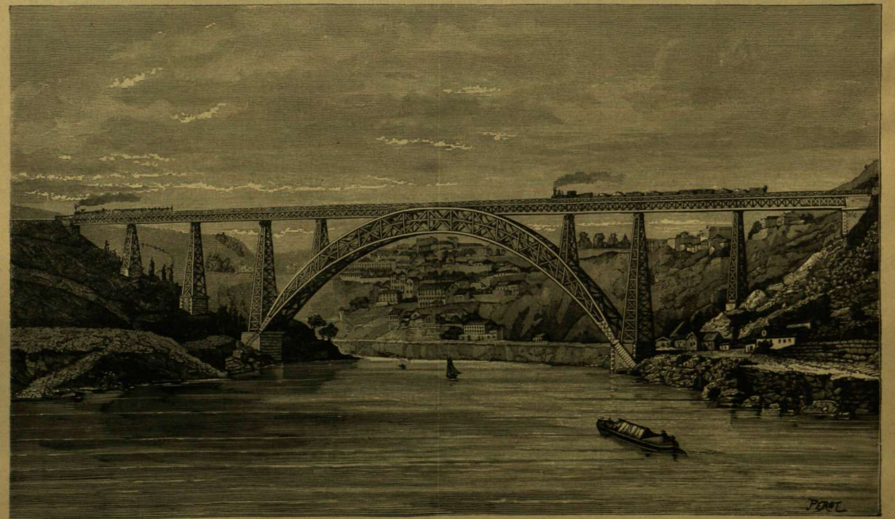
A VILÁG LEGNAGYOBB BOLTÍVES HIDJA: MARIA PIA HID PORTUGÁLIÁBAN PORTÓ MELLETT.