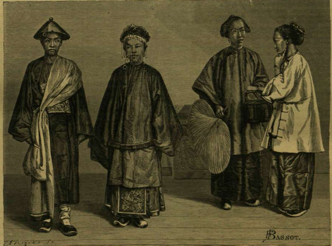
KÉPEK CHINÁBÓL: JEGYESEK.

Sajátságosan hat az idegenre a nagy bizalmatlanság, melyvel Chinában a kereskedők iránt viselkednek. A chinai azt tartja, a mit a magyar közmondás: Szemesek a vásár. De szemesnek is kell ám lenni a chinai kereskedővel szemben, mert a család a chinai kereskedő érényé közé tartozik. Csal minden lépten-nyomon, csal árucikkeinek nem-valódiságával, csal a pénzben és csal a mérésben. Felelősnak kell lenni a vevőknek és mindenkinek óvatosságot kell tanítani el