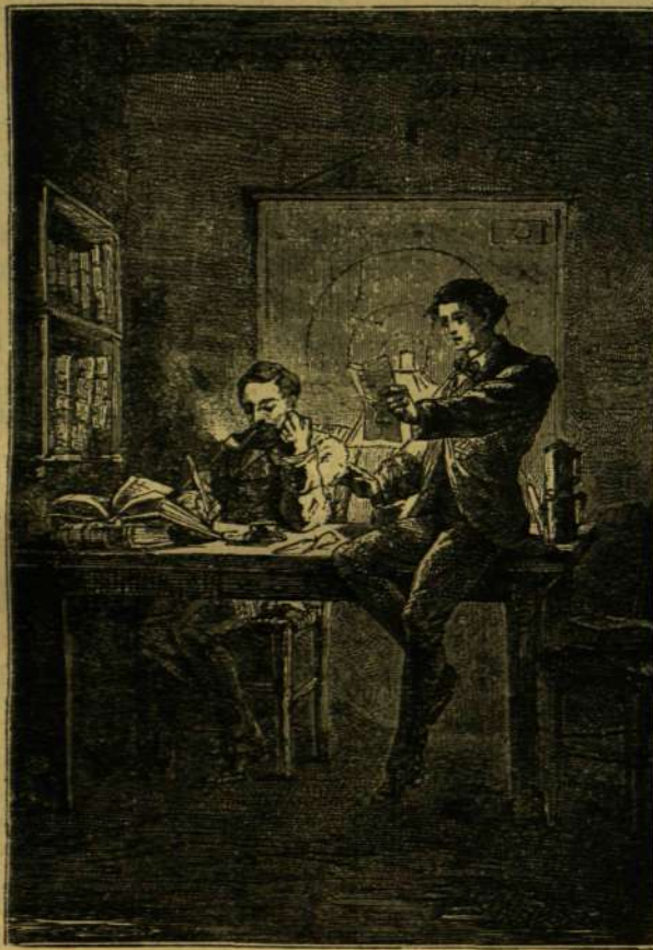
OKTÁV A LEVELET OLVASSA.

Alig ért az utcára, egy lámpa-pózna alatt