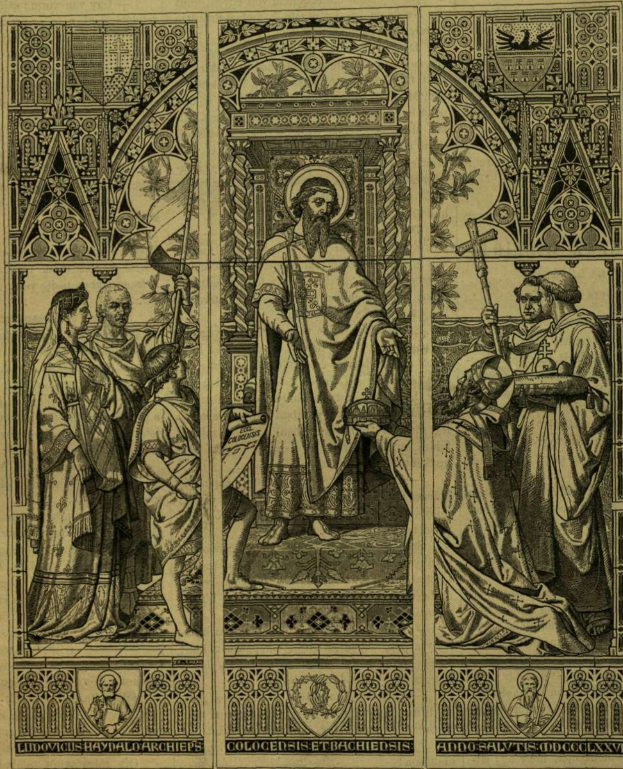
ABLAKFESTMÉNY A BÉCSI FOGADALMI TEMPLOMBAN: „Szent István elfogadja a koronát.”

— De, veté ellent Marcell, ily rendkívüli feszérőnek semmiféle ágyu nem állhat ellen;