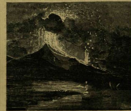
A Vezuv kitörése 1858-ban.