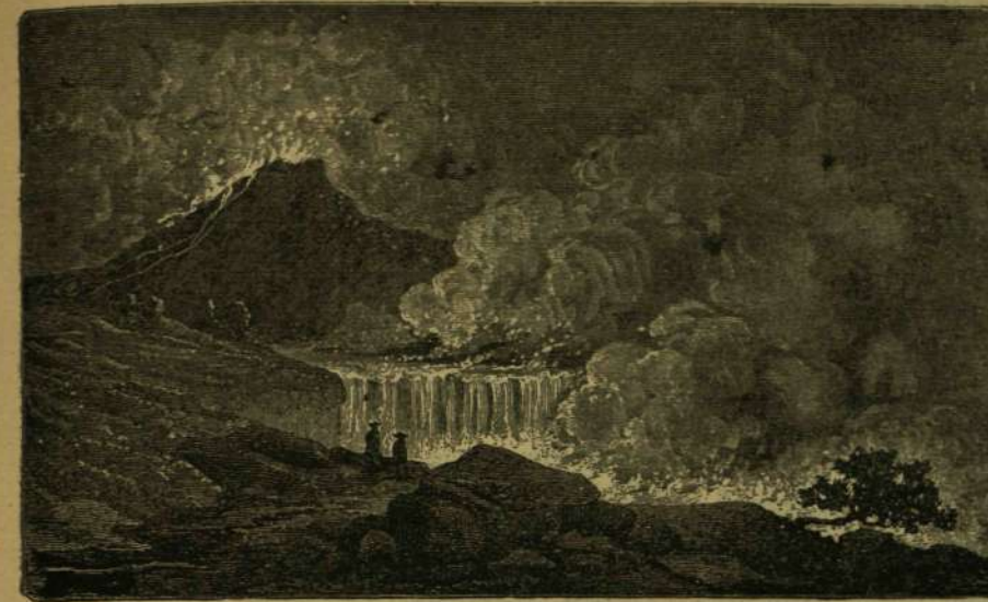
Az Aetna kitörése 1771-ben; tűz-zuhatag.