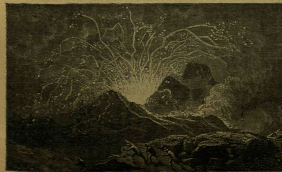
Az Aetna kitörése 1754-ben.