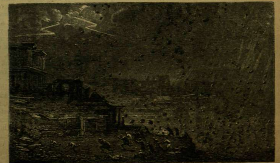
Pompéji pusztulása. (Ifj. Plinius leírása után.)