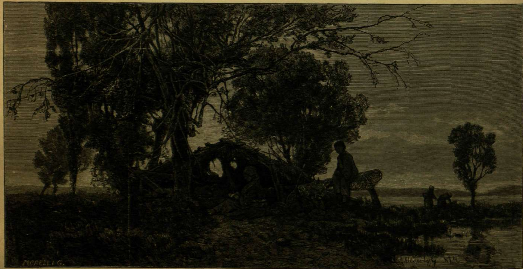
BALATONI HALÁSZKUNYHÓ. — MÉSZÖLY GÉZA FESTMÉNYE.

Közvetlen a kitörés előtt azonban merőben megváltozik a helyzet képe. Messze hangzó dőrej hirdeti néha napokkal előre a vihart, mely be fog állani, hasonlóan a létkör nagy szabású viharaihoz. A dőrejt erős földrengés követi, nem futólag egy-két rohamban, hanem a rázkódások egész hosszú láncolata követi egymást. A hegy