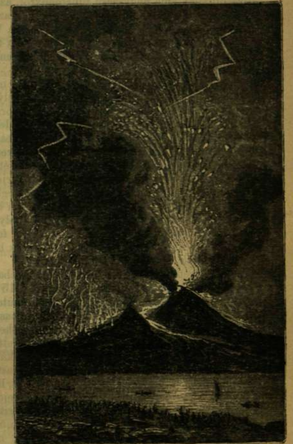
A Vezuv kitörése 1737-ben.