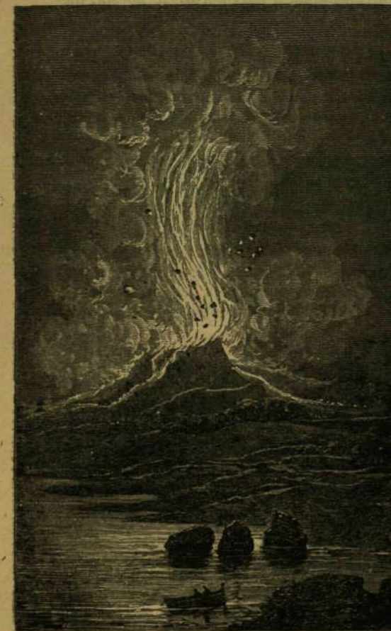
Az Aetna kitörése 1766-ban.