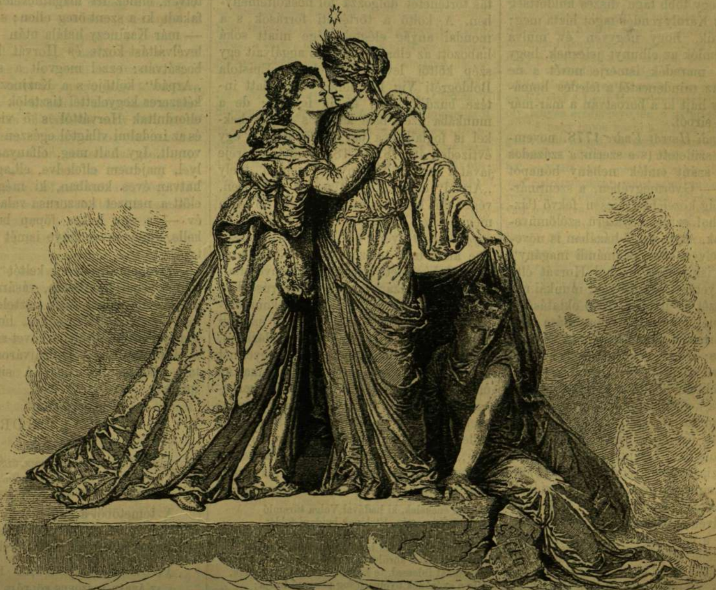
A francia Gouvier Armandnak, barátjához és kollégájához a műveinek jelennek és a jövőnek a magyar Zichy Mihály Paris, Junius 7. 1879.

Előfizetési feltételek: VASÁRNAPI UJSÁG és POLITIKAI UJDONSÁGOK együtt: egész évre ... 12 frt, félévre ... 6 * Csupán a VASÁRNAPI UJSÁG : egész évre ... 8 frt, félévre ... 4 * Csupán a POLITIKAI UJDONSÁGOK : egész évre ... 6 frt, félévre ... 3 * 25-dik szám. 1879. BUDAPEST, JUNIUS 22. XXVI. évfolyam