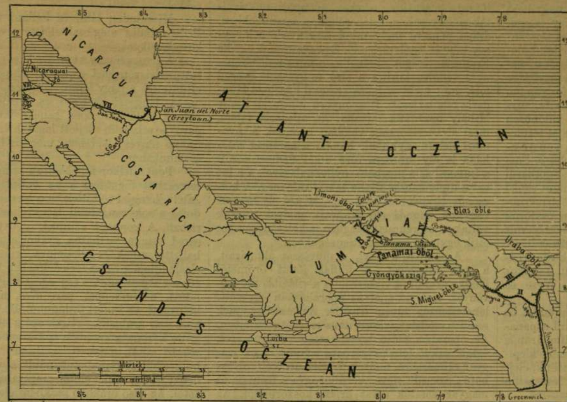
Nicaraguai terv. Panamai terv. Darieni terv.

Oroszország és a cenzura. Az orosz lapok most Kotzebuenak egy hátrahagyott emlékiratát ismertetik, mely sok pikáns részletet közöl I. Pál császár uralmának idejéből. A „Novoje Vremja“ a következő passzust közli az emlékiratból: „A cenzura egy darabomból kitérülte a szót, hogy Toulouseban „polgárok“ laktak; továbbá ezt sem volt szabad mondani: „hazám hegyei“. Egy abbénak, ki Párisból jött, nem volt szabad Párisról beszélni, sőt még Franciaországról sem. Egy tollvonással kitérülték darabomból ezen szavakat: „Buffon ismeretei a természetről, d'Alembert tudománya, Rousseau érzélgőssége, Voltaire szelleme.“ A „Titkár“ ez darabomból kitérülték mindenütt az „összeseküvő“ szót. A rigai cenzor pedig ezen szavak helyébe: „Megyek Oroszországba, mert ott hidegebb van, mint itt“, ezt írta: „Megyek Oroszországba, mert ott csupa becsületes emberek laknak.“