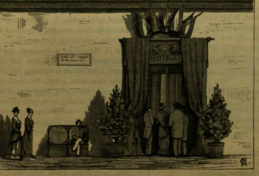
BUDAPEST FŐVÁROS GYŰJTEMÉNYES KIÁLLITÁSÁBÓL.