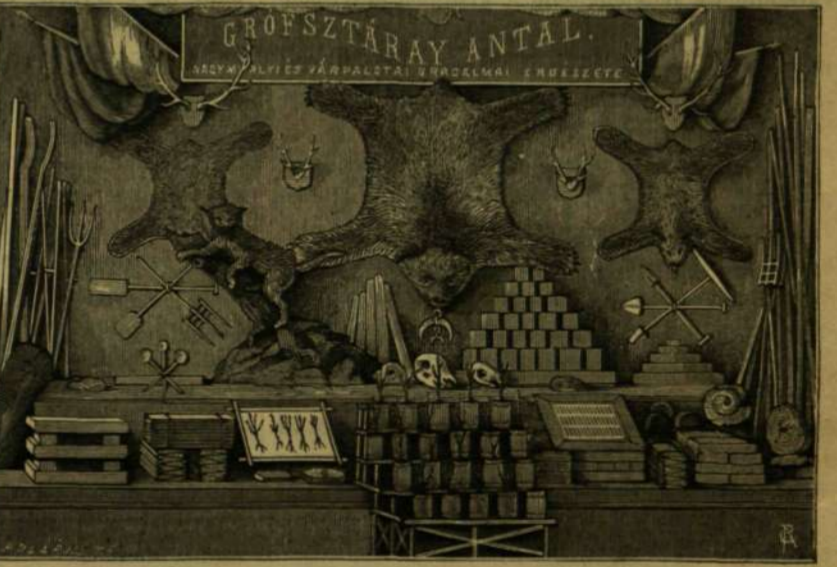
GR. SZTÁRAY VÁRPALOTAI ÉRDESZETI KIÁLLITÁSA.