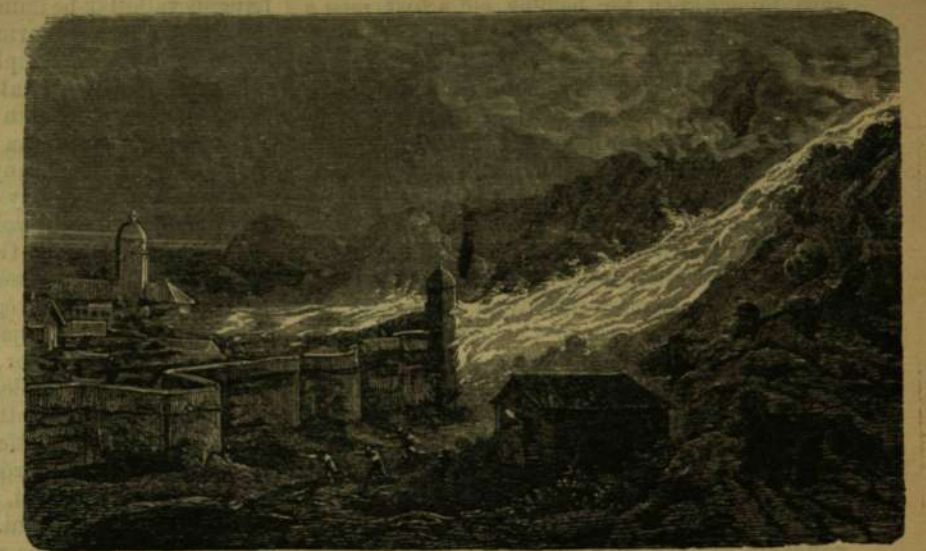
Az Aetna kitörése 1669-ben. A láva előtti Cataneát.