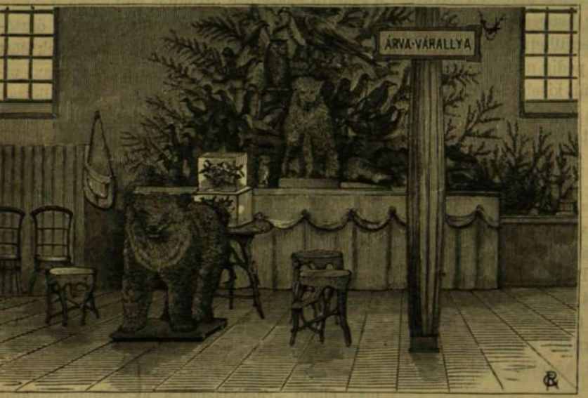
AZ ÁRVAI URADALOM GYŰJTEMÉNYES KIÁLLITÁSA.