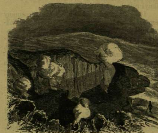
Az Aetna kitörése 1865-ben. A kráter a kitörés előtt.