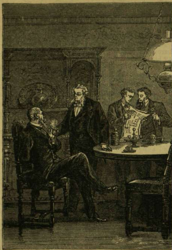
— GONDOLJA-E, EZREDES UR? ...