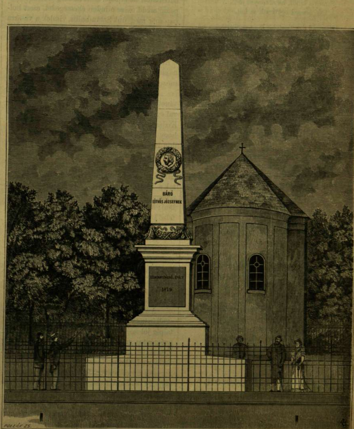
EÖTVÖS-EMLEK ERCSIBEN. Csanai Rezső rajza.

A kápolna mellett most magas obeliszk emelkedik, intve az utast, hogy tekintsen föl oda. Lehetetlen meg nem látni s meg nem emlékezni arról, a kinek sirját jelöli. S kinek ne jutna eszébe — míg a Duna folytonos szellője örökké nevét susogja itt — hogy a legnemesebb és legmelegebb sziv porlik e halmon, sziv, melynek min-