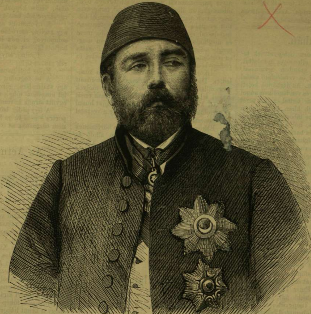
ISZMAIL PASA EGYIPTOMI ALKIRÁLY.

A mily szép, elragadó a város képe, ép oly sajátos tarka vegyületű a népség, mely e várost lakja. A legutolsó európai divat szerint öltözött európai gavallér, meztelen gyermekét karjain tartó rongyos arab asszony, fényesen öltözött pasa nagyszámu kíséretével, félmeztelen kopt és mohammedán szerzetesek, fehér palástba burkolt beduinok, katonák, apácák és lefátyolozott mohammedán nők vegyese hullámanak egy csoportban és egymást legkevésbé sem bántul-