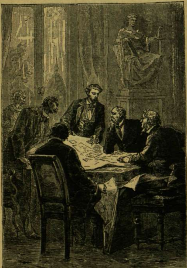
A VÉDELMI TANÁCS.

A birmai király Theeban a híres Aypongee vagy Phothoodon jóst, ki győzelmet jósolt neki,