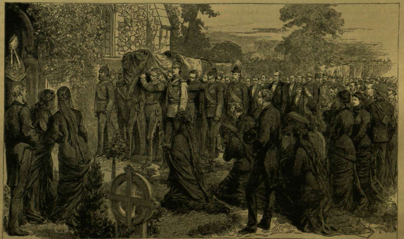
CHISLEHURST. — A GYÁSZMENET MEGÉRKEZÉSE A SZENT MÁRIA TEMPLOM ELÉ.