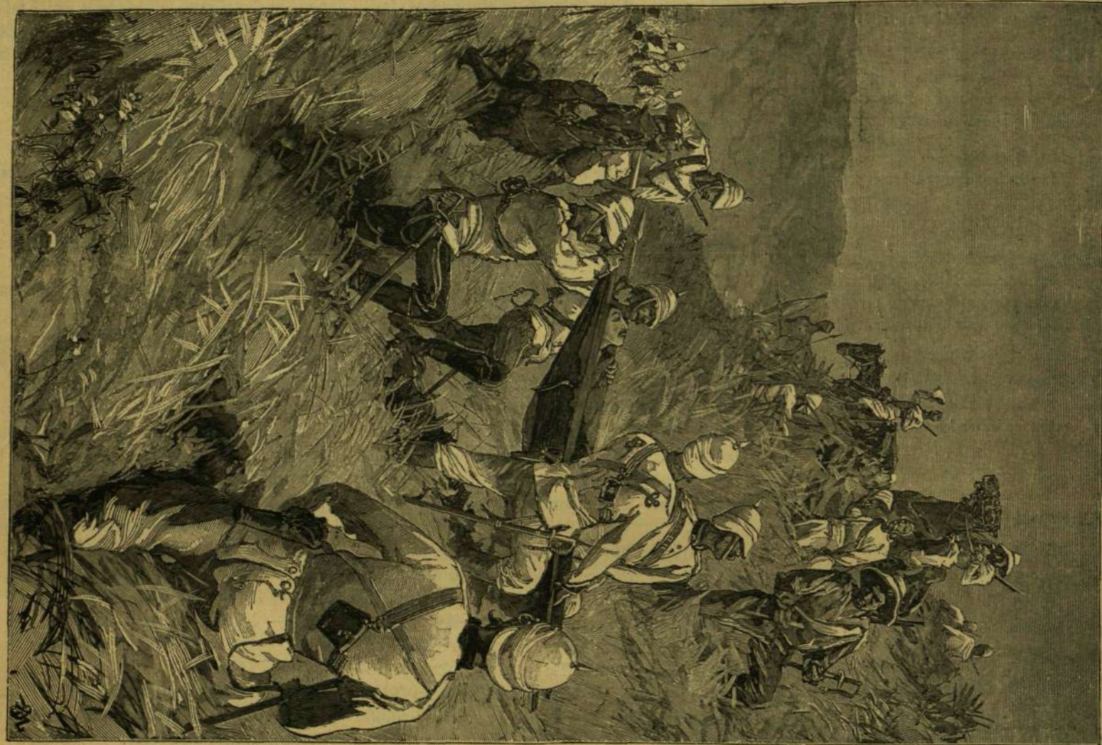
ZULUFÖLD DÖN. A HOLTTEST PÓLTALÁLÁSA.