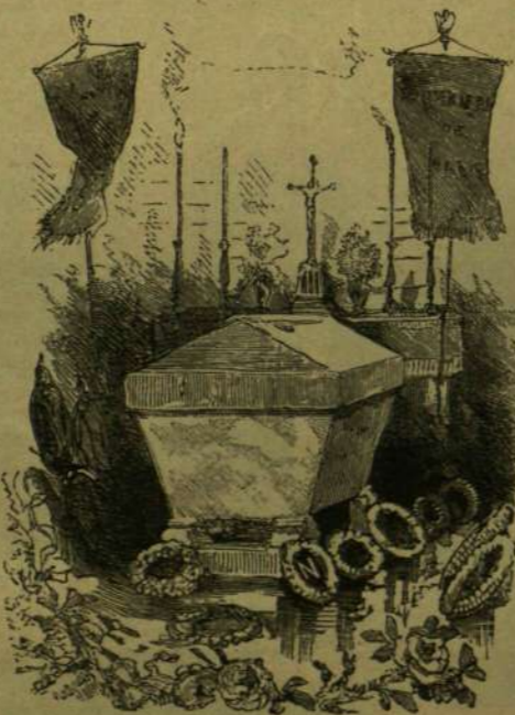
III. Napoleon sirkápolnája Chislehurstban.

Két lovas és két gyalog üteg zárta be a menetet, mely az önkényesek és nézők sorfala között lassu leptekek közeledett az időközben francia és angol notabilitásokkal megtelt temp-