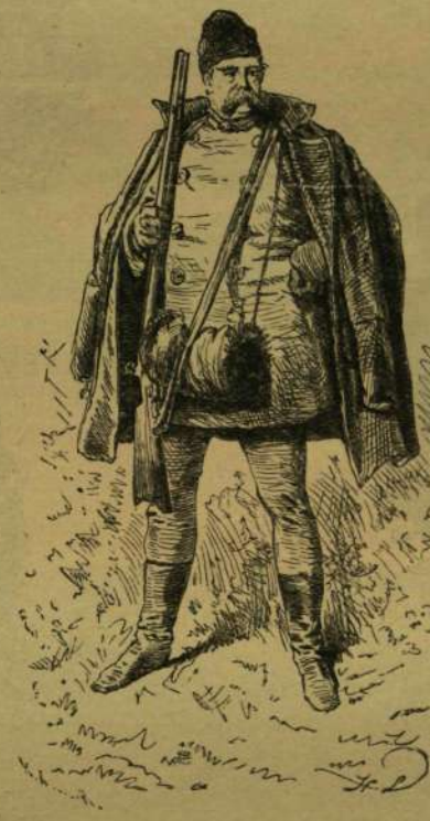
BISMARCK HERCEG MINT VADÁSZ.

Bismarck, daczára hatvannegy évének, még mindig daliás alak, kivált ha lóháton ül. Ugy az osztrák, mint a francia hadjáratot többnyire lóháton tette meg s csak ritkán ült kocsiában. Páris bevételkor is lóháton jelent meg a városban, mikor is a nép fölsimerte, de nem demonstrált ellene. „Egy ember azonban — így beszélé maga a herceg — igen marcona ábrázatot vágott rám, mintha keresztül akart volna szurni a szemével. Egyenesen nekilovagoltam, ugymond, s tüzet kértem tőle, mire az meglepetve ugyan, de kifogástalan francia udvariassággal nyujtotta át égo szivarját.“