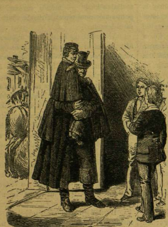
A Plamann-féle nevelő-intézetben.