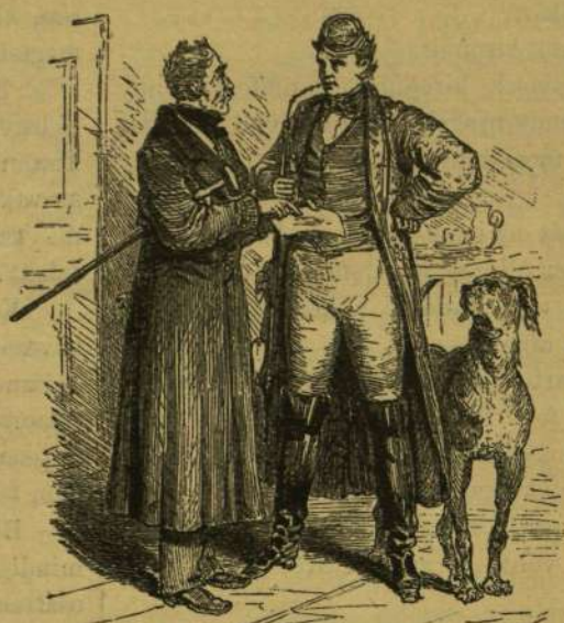
Göttingában. — Az első idézés.