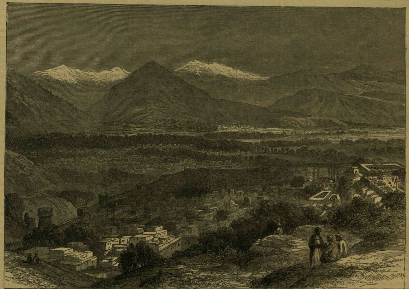
KABUL, AFGHANISZTÁN FŐVÁROSA.

Ennél nehezebb még csak az egy nemzeti színház igazgatósága — volt, mielőtt tudnánk b. Podmaniczky Frigyes még föl nem volt találva. (Miert is nem teszik meg őt kanczellárnak? Hát ha ott is olyan csodát mivelné, mint a nemzeti színházban?)