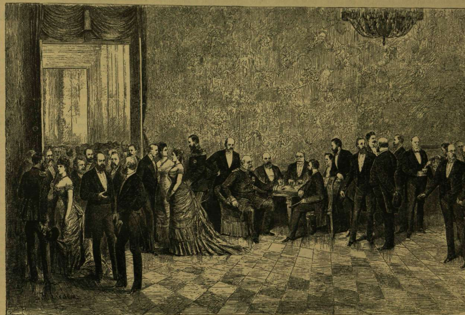
PARLAMENTI ESTÉLY BISMARCK BERLINI PALOTÁJÁBAN.