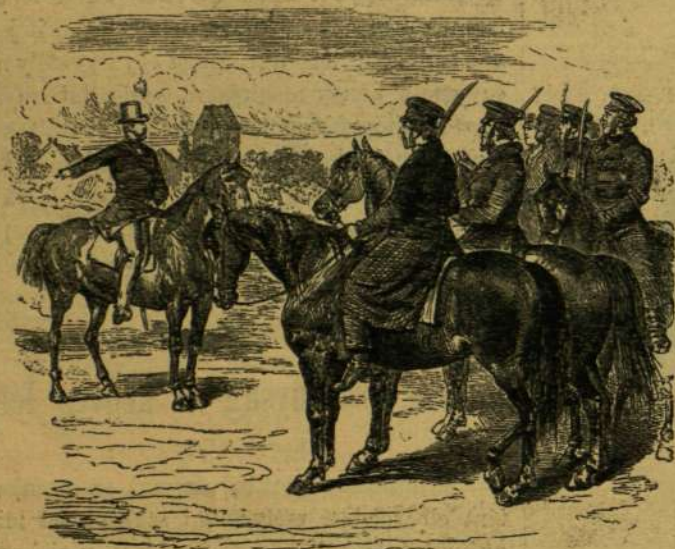
A schönhauseni polgárőrség fegyvergyakorlatán.