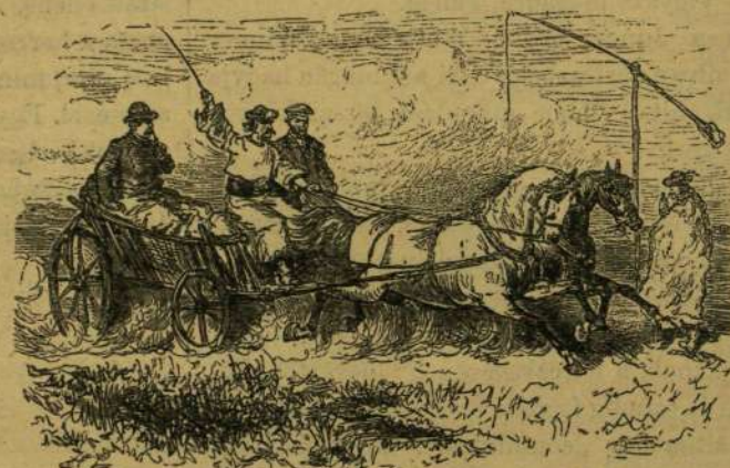
Utazás a magyar rónán.