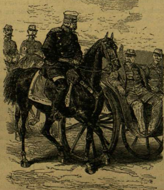
Bismarck és Napoleon Selannál.