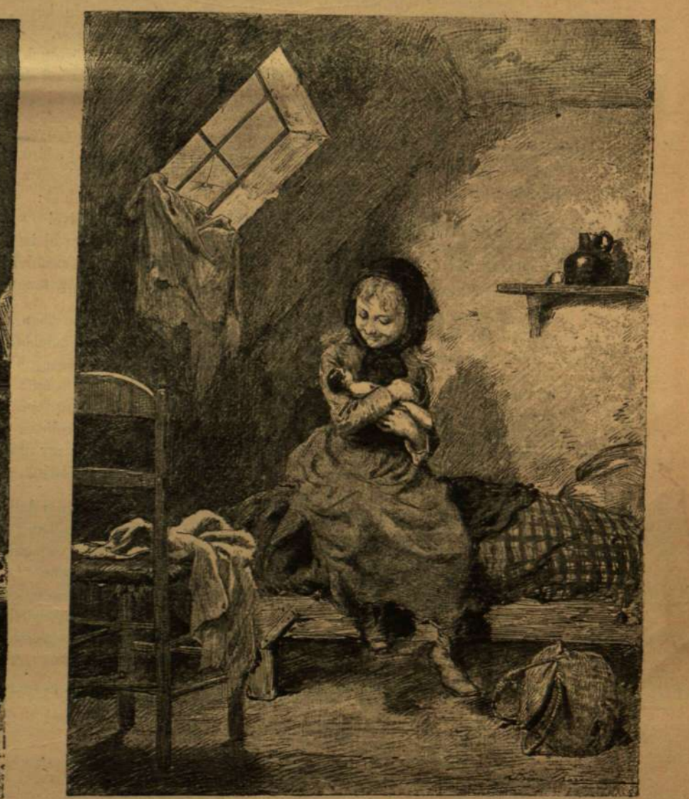
A KASTÉLY TERMÉBEN. A BOLDOG GYERMEKEK. A SZEGÉNY KUNYHÓBAN.