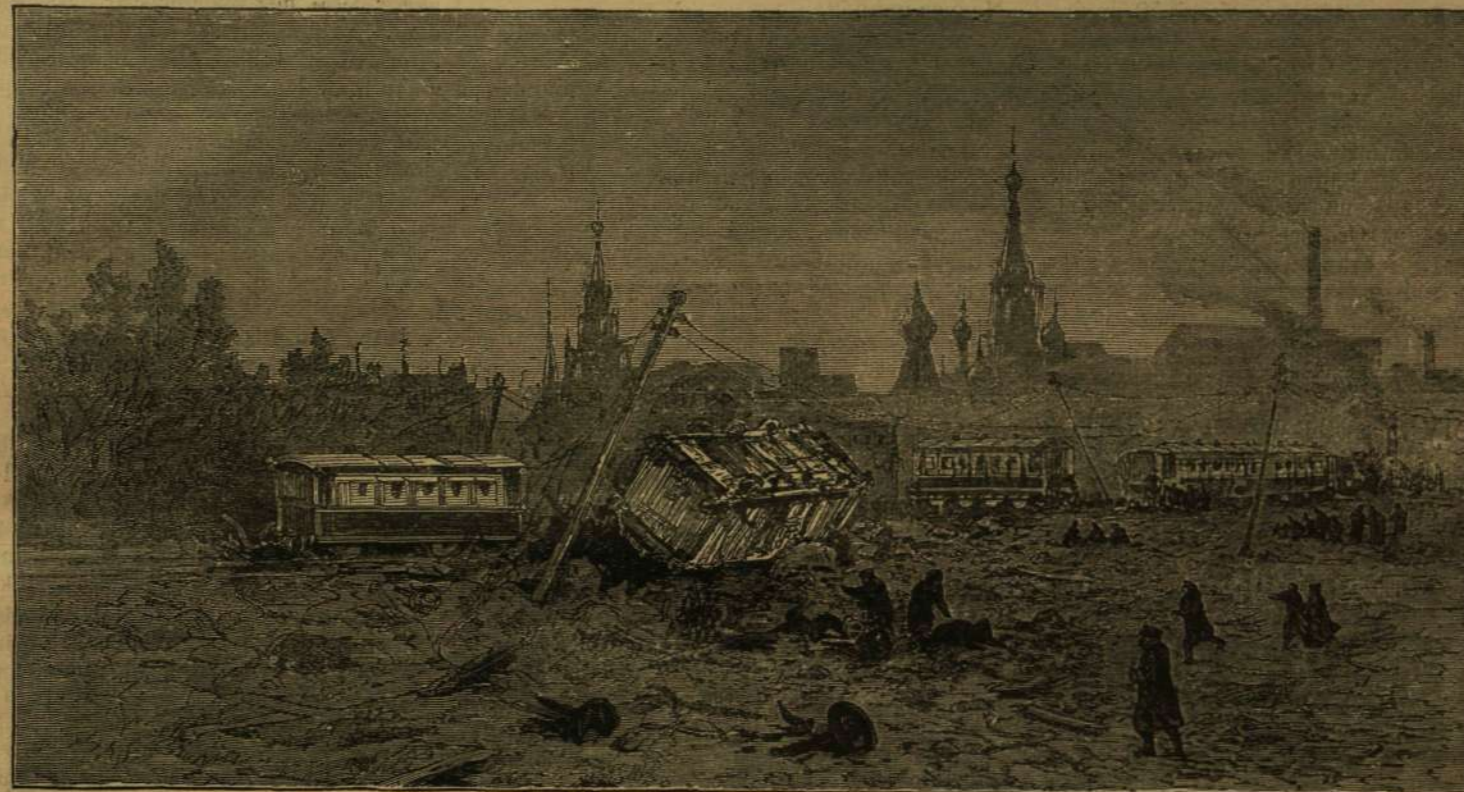
A VASUT A ROBBANÁS UTÁN.

E kis csoport összeesküvők csoportja volt. Házukban 18 láb mélységű gödröt vájtak s azon keresztül s attól vezettek egy akná a föld alatt