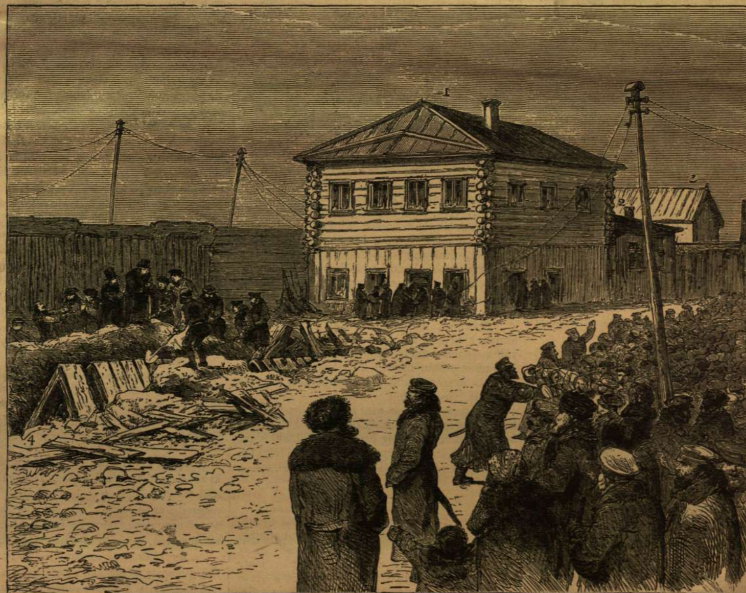
1. A HÁZ. — 2. MELLÉK-ÉPÜLET. — 3. ISTÁLLÓ. — 4. AZ ARNA HELYE.