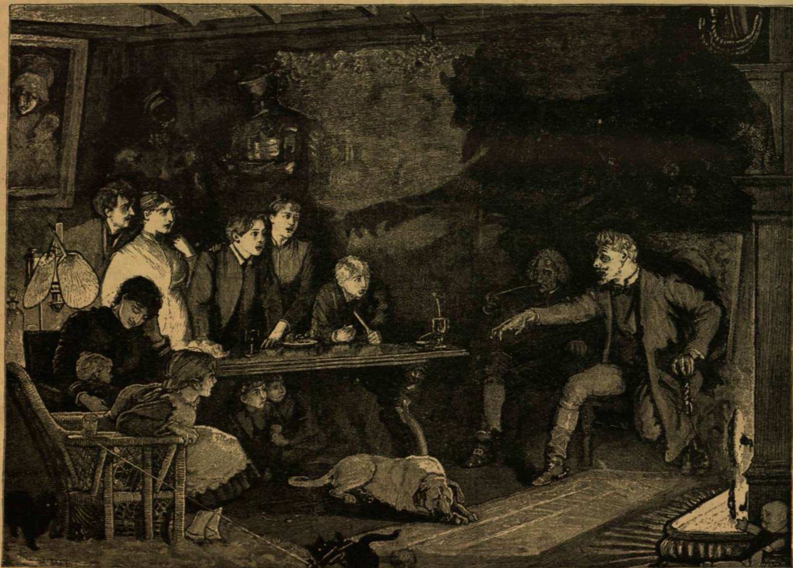
SZILVESZTERI MESÉLŐ. — XOBETH SPANYOL FESTŐTŐL.

A főalak nagy hévvel beszél el valamely rémes történetet. Talán rablókról, hazajáró lelkekről beszél, vagy az ördög viselt dolgait meséli el, — mindegy! Hallgatói szintugy nyelik szavait. Valamennyinek arcán ugyanaz az érzélem, de más és más, jellemző alakban tükröződik vissza. Az elbeszélő árnyéka a falon rémes alakot ölt, a sátán alakját. A világítás, vagy csak a hallgatók fölízgatott képzelme rajzolja a falra árnyát ily rémesnek? Talán mind a kettő. Bizo-