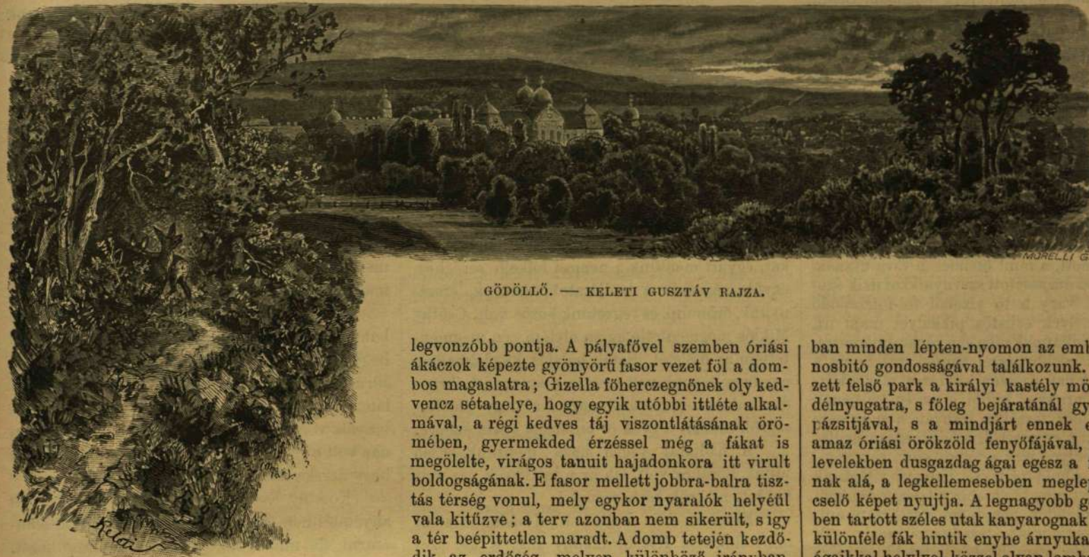
GÖDÖLLŐ. — KELETI GUSZTÁV RAJZA.

A ki Budapest környékének egyik legszebb — bár kissé távol eső — tájékán, a kies Gödöllőn csak egy-két derült napot töltött is, s még inkább az, ki itt üdülést talált vagy a kedves tájnak üde, tiszta levegőjében egészségét nyerte vissza: örömmel fogja megpillantani lapunk mai két tájképet, s úgy fogja köszönteni, mint a hogy kedves ismerősünknek vagy jó barátunknak előttünk egyszerre váratlanul fölmutatott képét szoktuk üdvözölni.