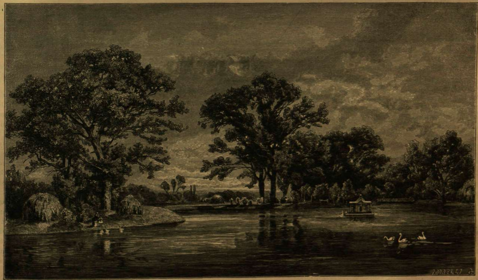
RÉSZLET A GÖDÖLLŐI ALSÓ PARKBÓL. — KELETI GUSZTÁV RAJZA.

E parknak legfestőibb pontja kétségtelenül a tó környéke, melynek délkeleti partját épen képkünk is mutatja. A tó medrét a Szada alatti völgyben fakadó Rákos patakja táplálja vizével, melynek fölöslege aztán a délre fekvő Lid alatt ömöl le egy kisede vízesésben s patak gyanánt folyta'ja tovább útját Isaszeg felé Budapest irányában, s a merre lejt, partjait mindenütt buja