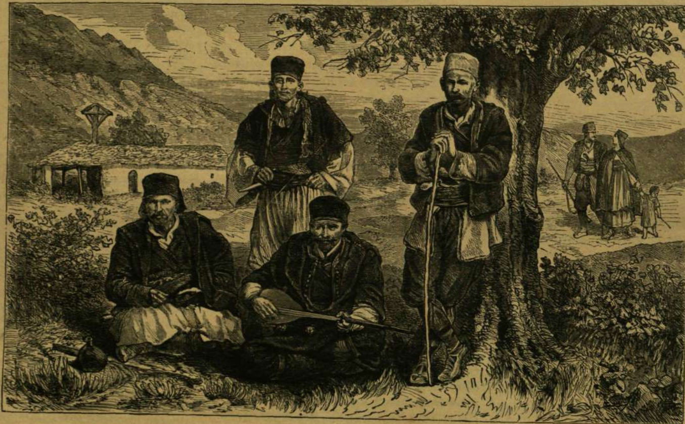
SKUTÁRI-VIDÉKI KERESZTÉNY ALBÁNCOK.