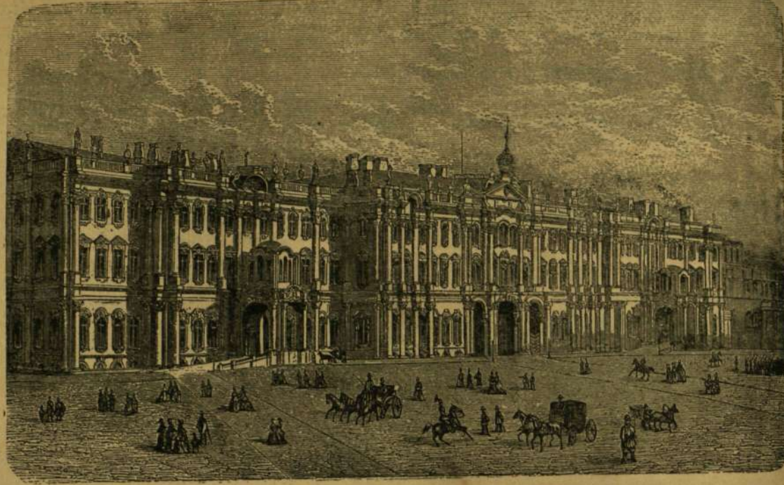
A TÉLI PALOTA SZENT-PÉTERVÁROTT.

Legalább az alulról fölfelé való keréketörés kinos műtételét végig ejtené meg rajtam az én fiatal szomszédokám; akkor legalább annyira tönkre volnék téve, hogy a következő executio gyötrelmei iránt eltompulnék. Eszében sincs! A zengő vallatás váratlanul, egy metsző diszonanciával szakad félbe, hogy tiz perc múlva minden közvetítő átmenet nélkül újból neki eredjen s vagy a rémkirály esábitó hangjai, vagy a megremült gyermek jajkiáltásai közé lökjön oda egész védtelen állapotban. Hogy a «bakfisi» közben miket művel: varr-é, olvas, rajzol, porol vagy csinostítja-e magát, azt nem tudom. Annyi bizonyos, hogy szokatlan, sajátos foglalkozás lehet az, mely anyi zenei félbeszakítást bír el. A præsto agitator remegő triolái megint azt hirdetik, hogy most mindjárt az a kérdés fog a házon végigjajogni: ily késő éjszakán ki lovagol erre a fiával? S borzongva nézek eleje ama pillanatra, midőn a rémkirály tettelegességre vetemedik s a gyermek fölsikolt: «Mein Vater, mein Vater, jettz fasst er mich an!» Ebben a zengő viharban ez az a percz, a mikor beüt a villám. A folyton ismétlődő ges , melyben apjához a gyermek fölajong; tekintetbe nem vétele ama csillagjelnek, mely a pedale pihenését parancsolja; az a hármás f-fel fűszerezett, jól megpaprikázott il più presto possibile s a sempre tumultuoso ,