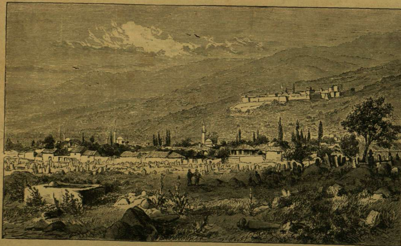
PRIZREN, AZ ALBÁN LIGA SZÉKHELYE.

lényt hordanak; fejükön a fejről nagy fekete bojt csüng alá; míg az éjszakai ghek albánok térdig bő, azon alul szűk abaposztó nadrágot és bocskort viselnek. A pisztolyok és handszárak elmaradhatlanok az albánok övéből. Ezeket már gyermekkorukban kezdik viselni.