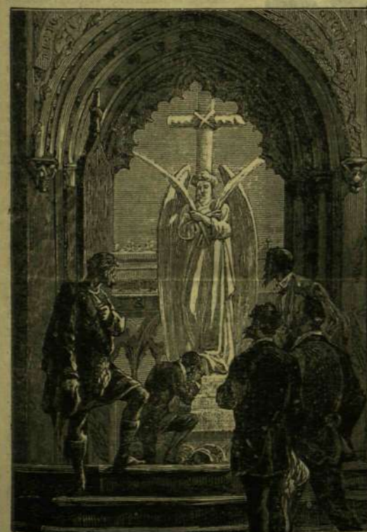
A MÁRVÁNY-EMLEK LÉPOSÓJÉRE LEBORULT.

Ez emlék, s az alatta rejlő kut előtt, melybe a két nő, a Nána Sahib mászórai által összemarazgolva, de talán még élve dobatott