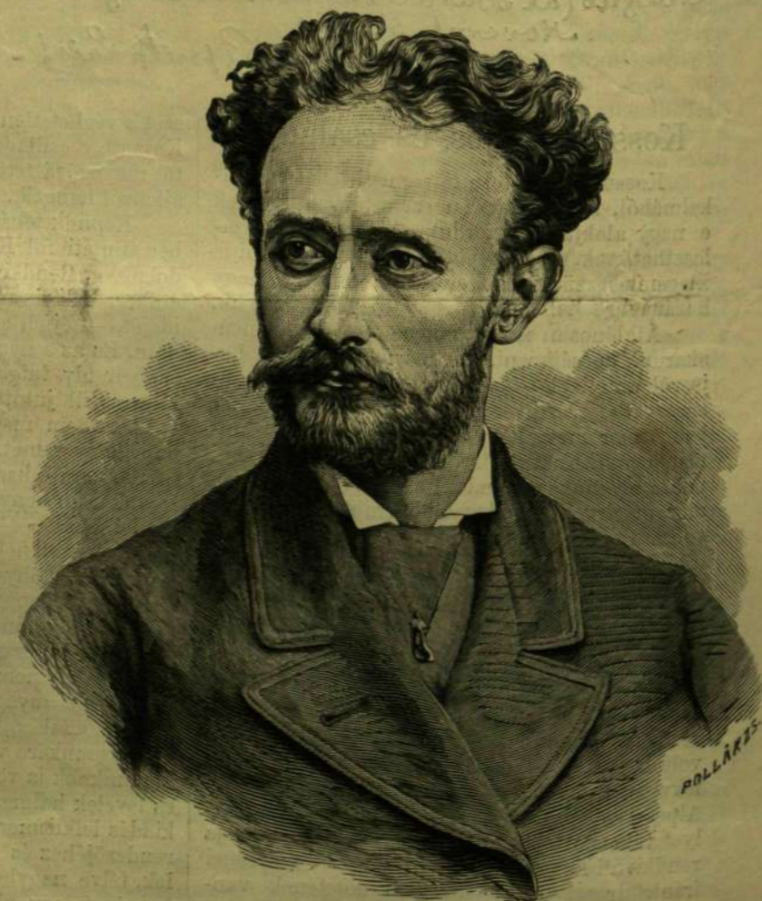
IFJ. KOSSUTH LAJOS.