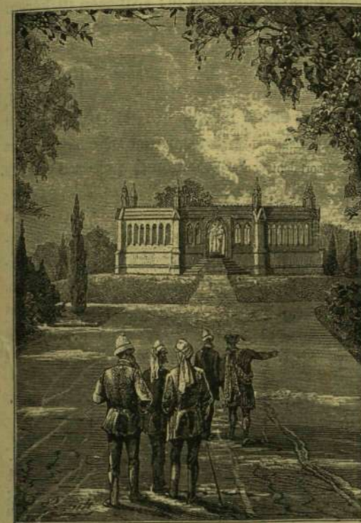
NYOLCZSZÖGŰ ÉPÜLET, GÓT STÍLSEN.

Ennek közepén nyolczszögű épület emelkedik, gót stílusban. Csarnok gyanánt, mint egy nagy mauzóleum, veszi körül azt a kutat, melynek nyílása most kő-építménnyel van elzárva. Ez egy széles talpazat, lépcsőzetesen emelkedve