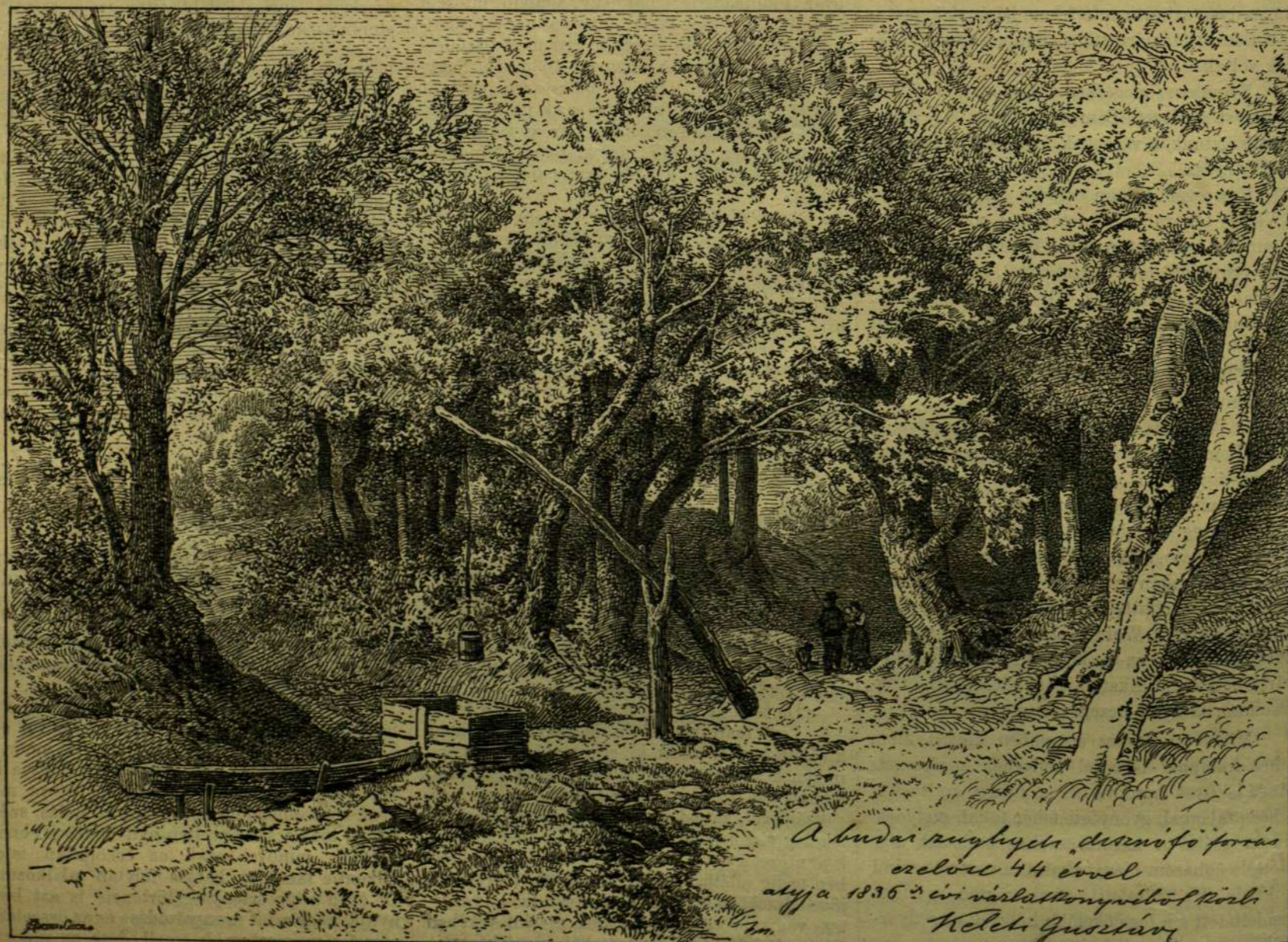
A budai szőlőzet, disznófó forrás ezelőtt 44 évvel alya 1836-bi várlattörvényétől kezdve Keleti Gusztáv

BUDA SZÁZ ÉVVEL EZELŐTT — JÓGYORU METSZET UTÁN.