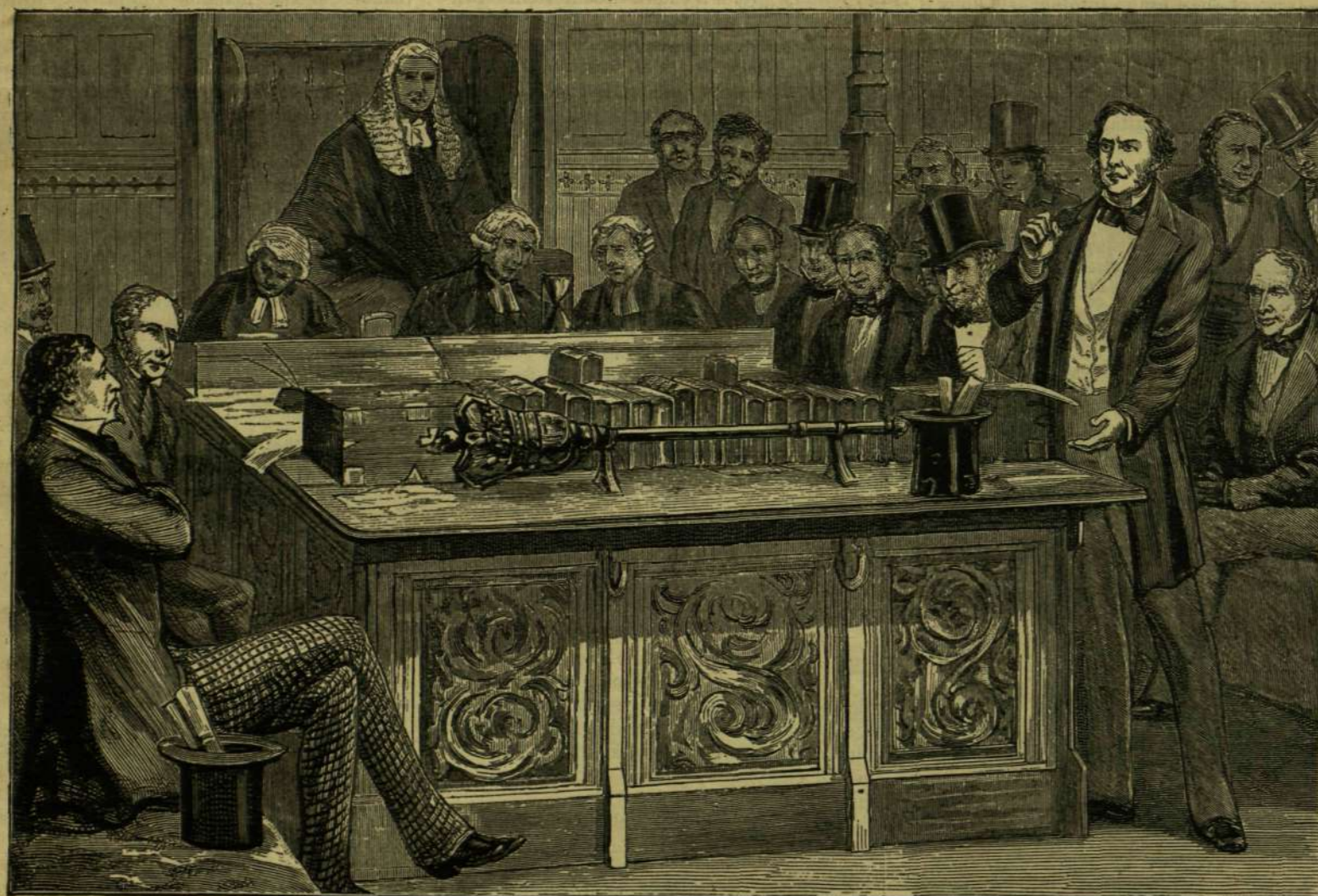
GLADSTONE MEGTÁMADJA DISRAELI ELSŐ KÖLTSÉGVETÉSÉT A PARLAMENTBEN 1852-BEN.

A tavaszi ünneplő vásárig csak délután volt nyitva és esti 11 óráig tartott. A végeladás e hó