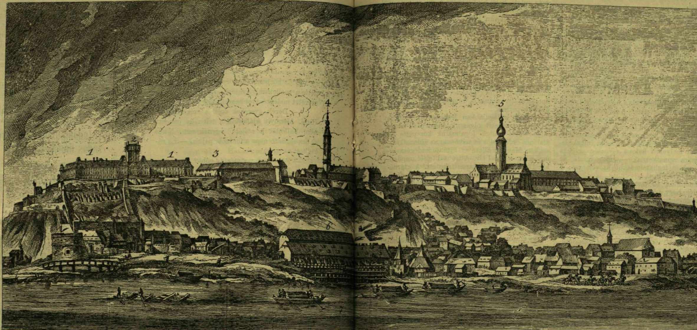
1. A kir. palota, a hol az egyetem székel. 2. Csillagvizsgáló. 3. Szertár. 4. Nagybazony temploma. 5. Ferencziek temploma. 6. Élelmezési raktár. 7. A Duna.

Miben áll a védelem? a hadegészségügy rendezésében. A háborúk iskolájába járt nagy