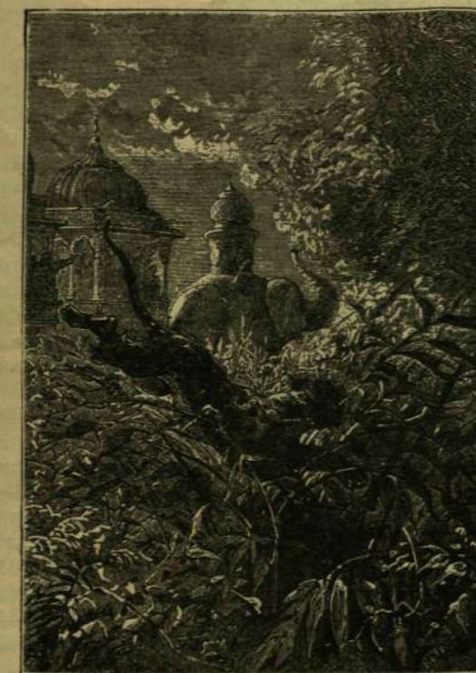
EGY HATALMAS UGRÁSSAL ELTÜNT A BOZÓTBAN.

Június 8-kán már hajnalban elhagytuk szállóhelyünket, mely Rohilkánd egy kis városa mellett volt a hova előtteval este értünk, miután Rewától negyven kilométert jöttünk volt. Vonatunk közepeszerű gyorsasággal haladt csak, az esőktől felázni kezdő utakon. A patakok is feldagadtak s néhol nehéz volt a gázlókön áthatolni. De azért mit sem késtünk meg;