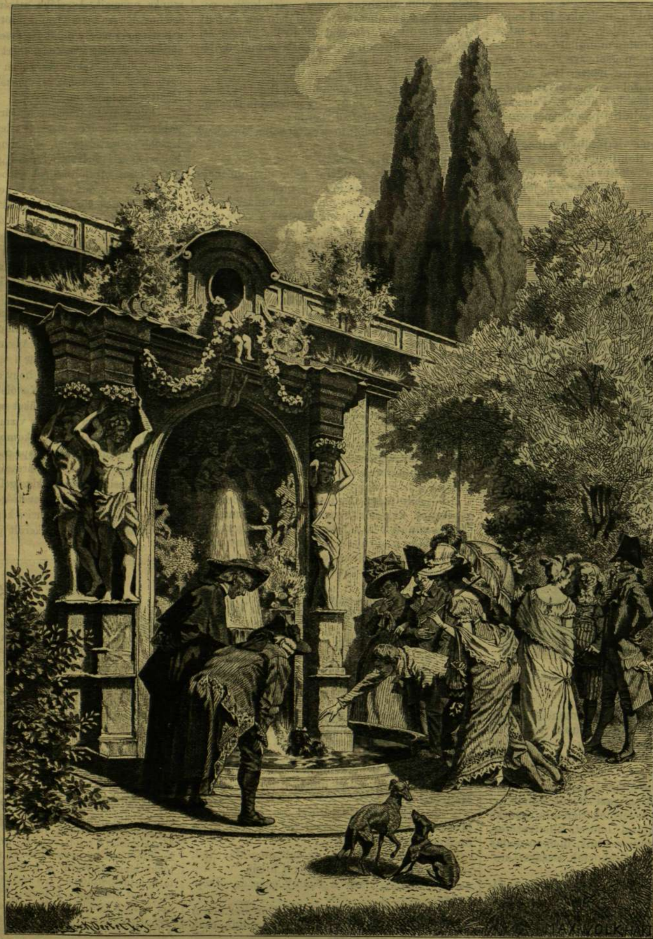
SOK HÚHÓ SEMMIÉRT.