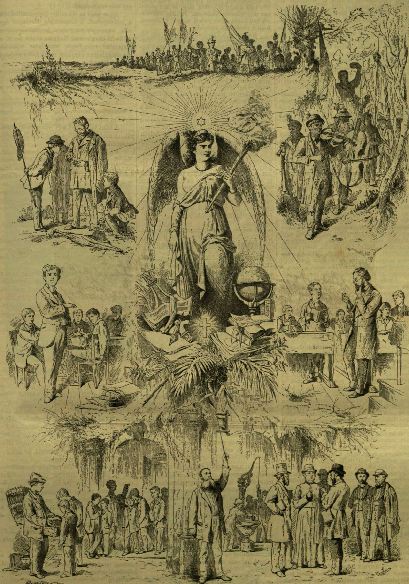
VIVANT VACATIONES! — GYULA LÁSZLÓ RAJZA.