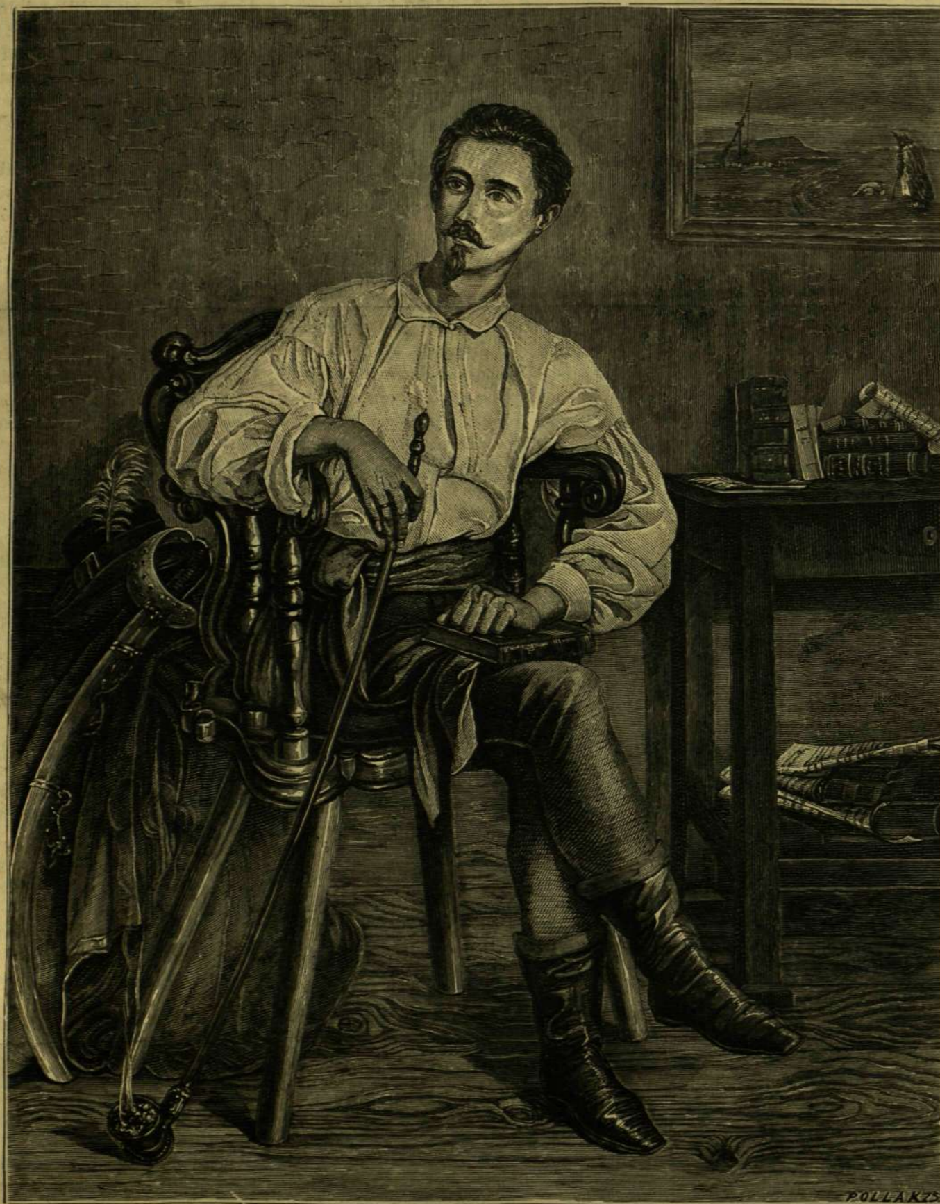
PETŐFI UTOLSÓ ARCZKÉPE. — ORLAY SOMA 1849-RI FESTMÉNYE UTÁN.

«A vonat indul 3 óra 52 perczkor budapesti középítőben» vagy: «érkezés 9 óra 18 perczkor budapesti középítőben» ilyes és ha-