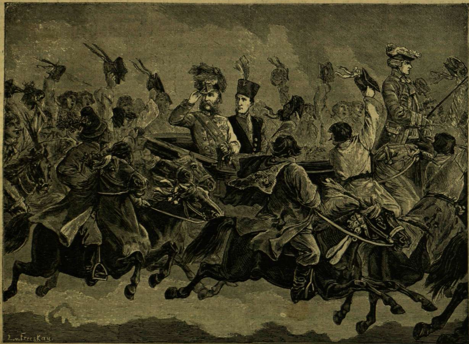
A KRAKUZOK BANDERIUMA A KIRÁLY KOCSIJA KÖRÜL.

Belügyi államtitkár ez évben nevezte ki őt a király. Azon bizottságokban, melyek a belügyminiszteriumban az új, nagy szerves javaslatokat készítik állami rendőrségről, köztisztviselők hivatali kvalifikációjáról, a közigazgatás