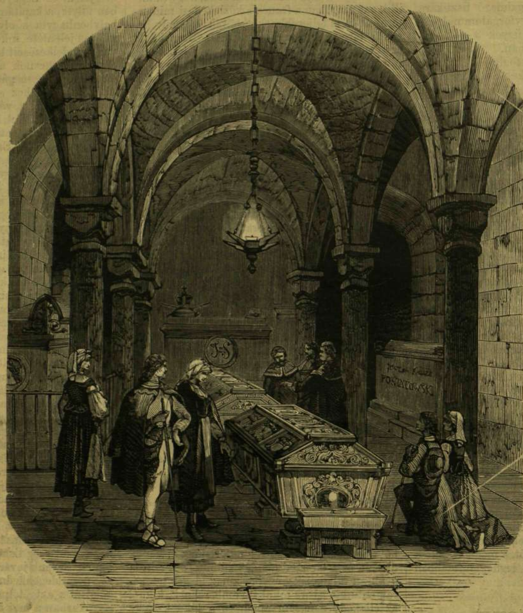
SZOBIESZKI SIRJA SZ. WENZEL EGYHÁZÁBAN.

A szabadságharc befejezte után ő is bujdosott, 1850-ben amnesztiát nyert ugyan, de internáltatott s rendőri felügyelet alatt állt. Ez idő alatt visszavonulva élt, de látogatója volt a híres eskői vadásztársulat telepének, hol a sport inkább csak takarója volt a haza ügyei fölötti bizalmas eszmecseréknek. 1860-ban az októberi diploma korszakában Nógrád megye főispánjának nevezetett ki, de ő ez állást több, hasonló «kitüntetés»-ben részesített elvártaival egyetértésben nem fogadta el. 1861-ben a borsod-mező-keresztési kerület képviselőnek választotta, mely alkalom-