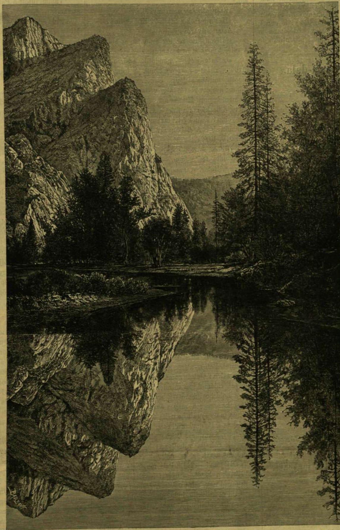
A TÜKÖR-TÓ YOZEMITI VÖLGYÉBEN (KALIFORNIÁBAN.)

«Nemzetgazdaságtan», «Pénzügytan», «Vasuti különbözőzeti tarifa», «Kereskedelmi szakoktatás», «Az osztrák-magyar monarchia vámpolitikája» című munkákkal gyarapította, melyből több akadémiai díjat nyert s az utolsó különösen nagy elismeréssel találkozott. 1870-ben miniszteri titkár, 1874-ben osztálytanácsos, 1878-ban miniszteri tanácsos, s ugyanezen évben a Lipót-rend lovagjává lett. Az európai nyelv-