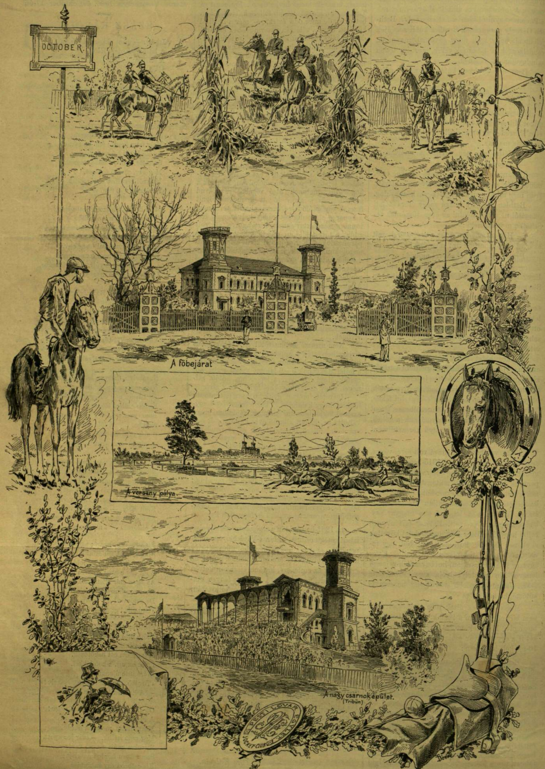
AZ ÚJ LÓVERSENYTÉR. — DÖRRE TIVADAR RAJZA.