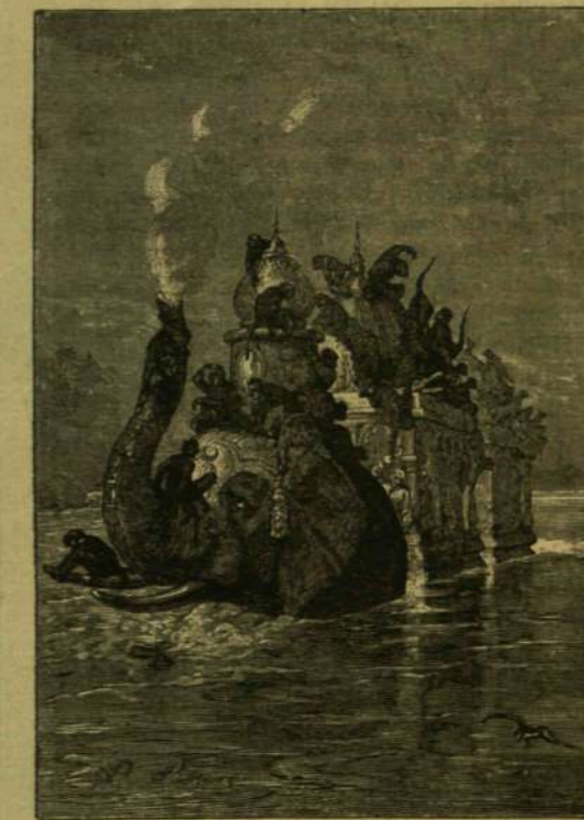
AZ USZÓ ELEFÁNT.

A mint visszatértünk, Banks már minden előkészületet megtt az indulásra. A folyam, hatalmas áradásban levén, nagy erővel folyt s