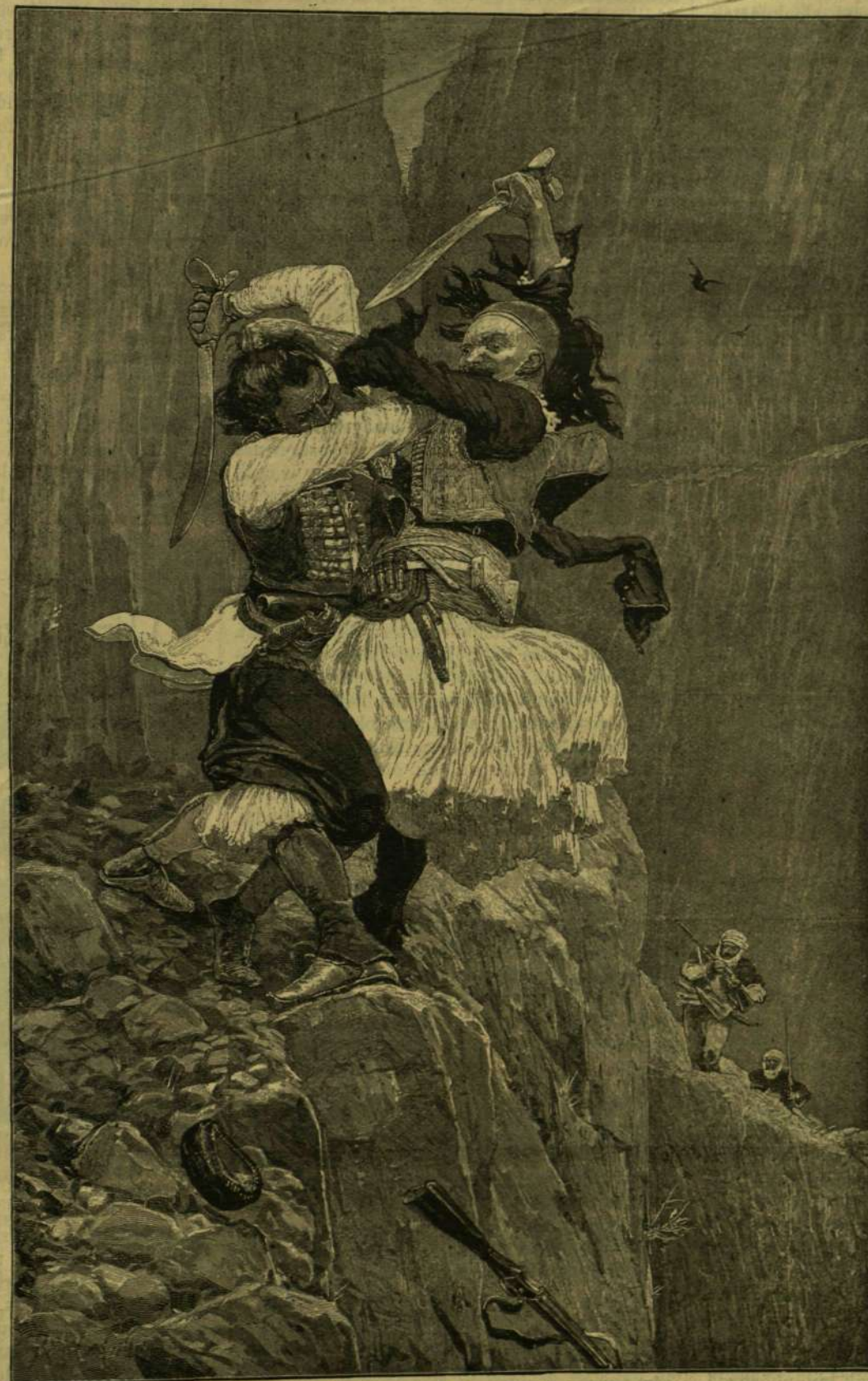
KÜZDELEM A HATÁRÉRT.

Más országok fővárosainak környéke egész mértőföldre csupa paradicsomkert, mosolygó villákkal, árnyas, lombos fákkal. Itt, a merre ellátsz, csupa aszu homok, a melyen még kutyatej sem terem. Az országutat szegélyező fákat be-