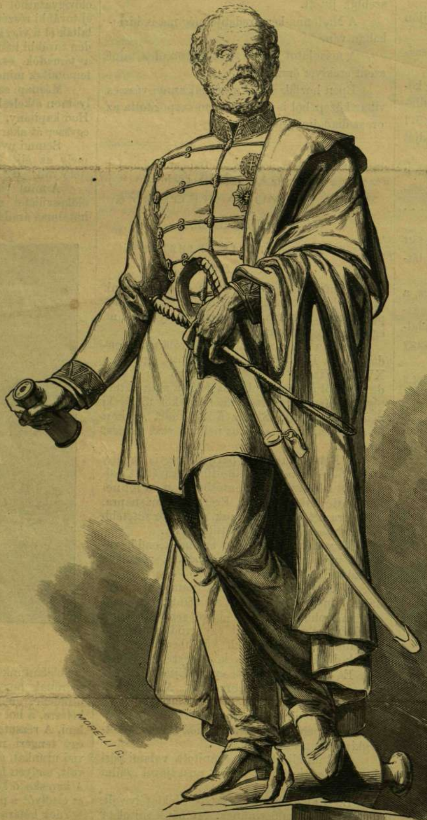
BEM SZOBRA. — HUSZÁR ADOLFTÓL.

* Október hónapot a régi naptárakban vállán zásokot vivő férfi által szokták jelezni, mintegy emlé-