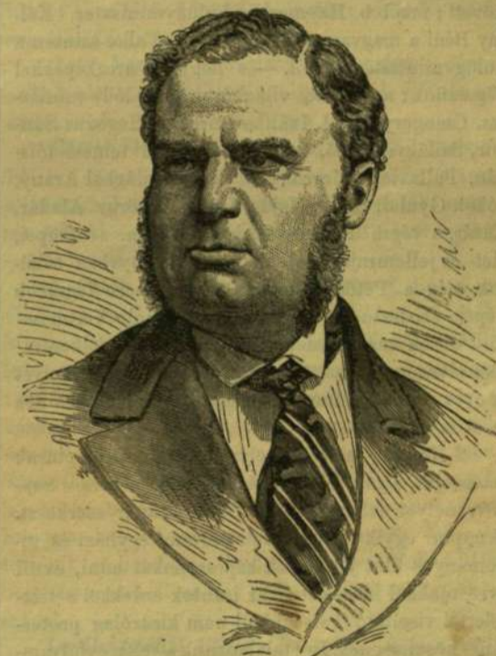
SEYMOUR LORD, a tengerügy, a nemzetközi flotta parancsnoka.

Dulcigno, a tengerről nézve, meglepő látványt nyújt és kis vízhoz hasonlít a nélkül, hogy az volna. Még ha a sáncok és várakal jobb karban volna is, se volna az erőnek jelentősége, mert a musurai és golenczai körülvekvő magaslatokról teljesen belátható. A várakalon belül van a régi és tulajdonképi város, mely mintegy 80 igaz török házból és házacskákból áll, melyen görbe, meredek és nyomorultnak kövezett utcákkal mennek keresztül-kasul. Nehány épület egy-emeletes, pompás kilitást nyújt a tengerre és rendszeren a helység gazdagabb családjainak tulajdonát képezi. A vársánc déli bástyáján még megtalálhatók egy régi, sziz Máriának ajánlott még megtalálhatók egy régi, sziz Máriának ajánlott még megtalálhatók maradványai, melyek e katolikus templom régi eredetére mutatnak. A régi város közepén egykor magas, négy-szögű torony állt, mely