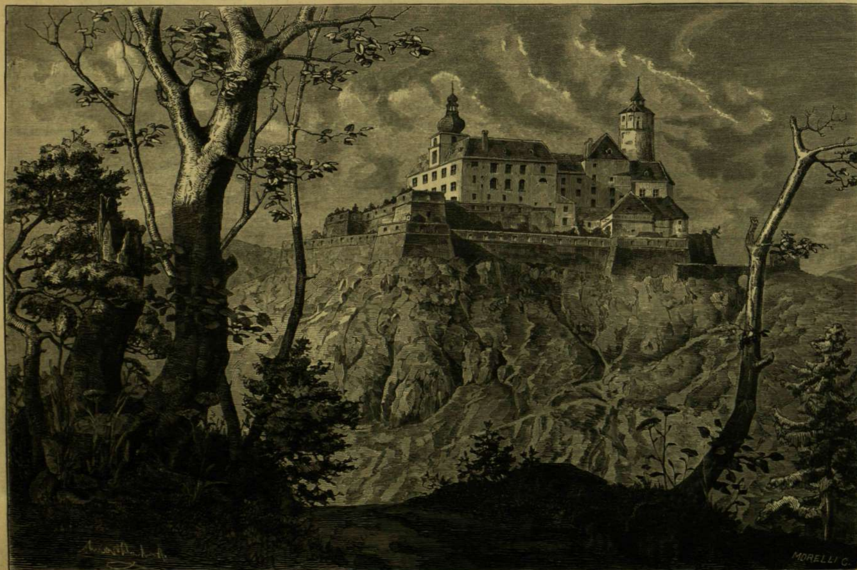
FRAKNÓ VÁRA. — ARNOLD NÁNDOR RAJZA.

Mindjárt első fölleptével oly hírnévre tett szert, annyira a közbecsülés tárgya lett s magát a vezetésére álló iskolát is oly népszerűvé tette, hogy bár csak tizenhat tanulóval, mikor a nógrádi esperességnek losonczy algy-