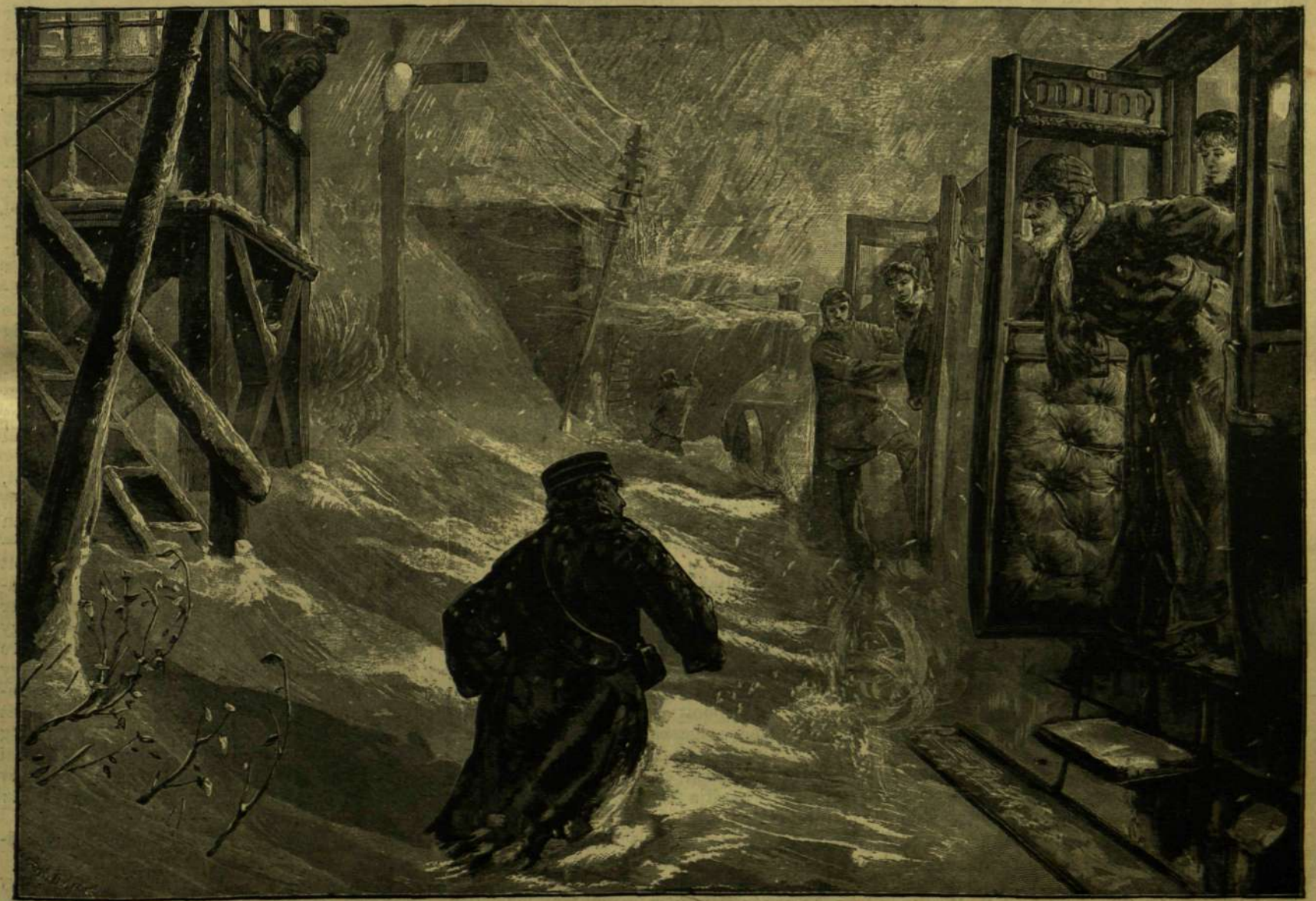
A NAGY HÓZIVATAR LONDONBAN. — EGY VASUTI VONAT FENNAKADÁSA.