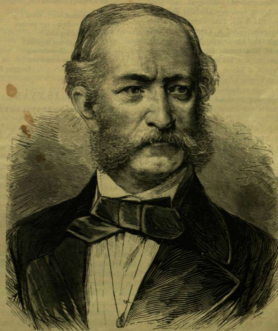
BÁRÓ HAYMERLE KÜLÜGYMINISZTER.

1857-ben Athénben volt diplomáciai tit-kár, majd Ausztria ügyvivője. 1861-ben Drez-dába ment, két év múlva pedig a frankfurti szövetségi követ mellé osztatott be. Majd a dán udvarnál lett ügyvivő s 1866-ban követtségi titkár, a midőn Frankfurtba hivatott a orosz-osztrák békealkudozásokhoz. Ezek befejeztével már a berlini udvarnál lett ügyvivő, migsem Beust a külügyminiszterium-hoz hívta meg szolgálateltelre. Több kisebb állomás betöltése után végre 1877-ben római nagykövetté lön, s a berlini kongresszus alkal-mával Andrásynak lett jobb keze s 1879. szept-emberében otóda a külügyminiszteri széken.