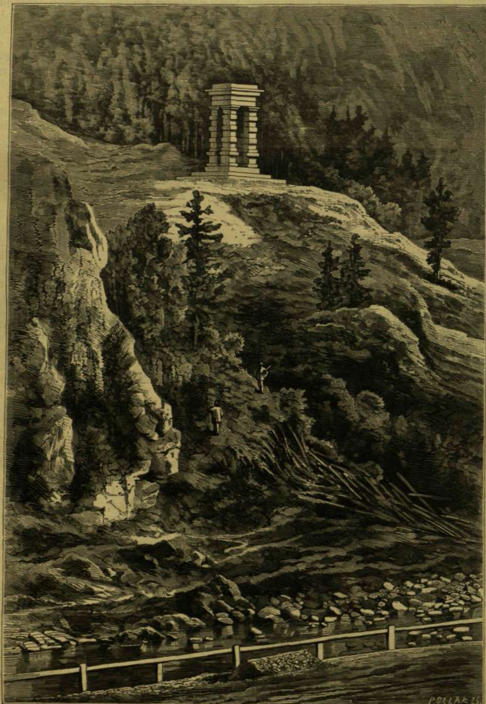
HONVÉD-EMLÉK A TÖMÖSI SZOROSBAN.

* Minta egészséges városok akar építeni dr. Richardson Benjamin Angliában a Sussex partjain. Már részvénytársaság is alakult e célra. A tervezet szerint, egy nagy fogadót kivéve, mindenféle kocsma kizáratik innen. A csatornázásra és építésre nagy gondot fordítanak. Egészben 1600 házat építenek