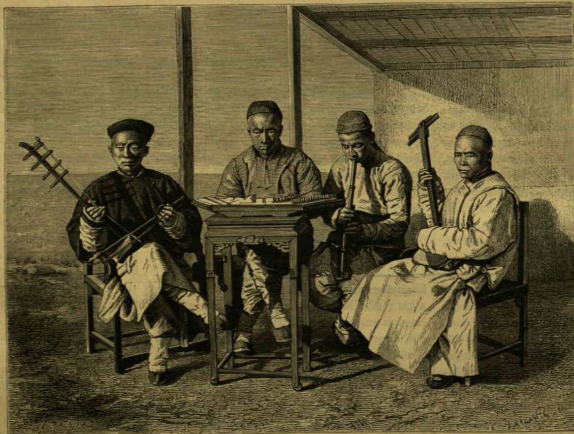
KÉPEK PEKINGBŐL. — KHINAI ZENEKAR.