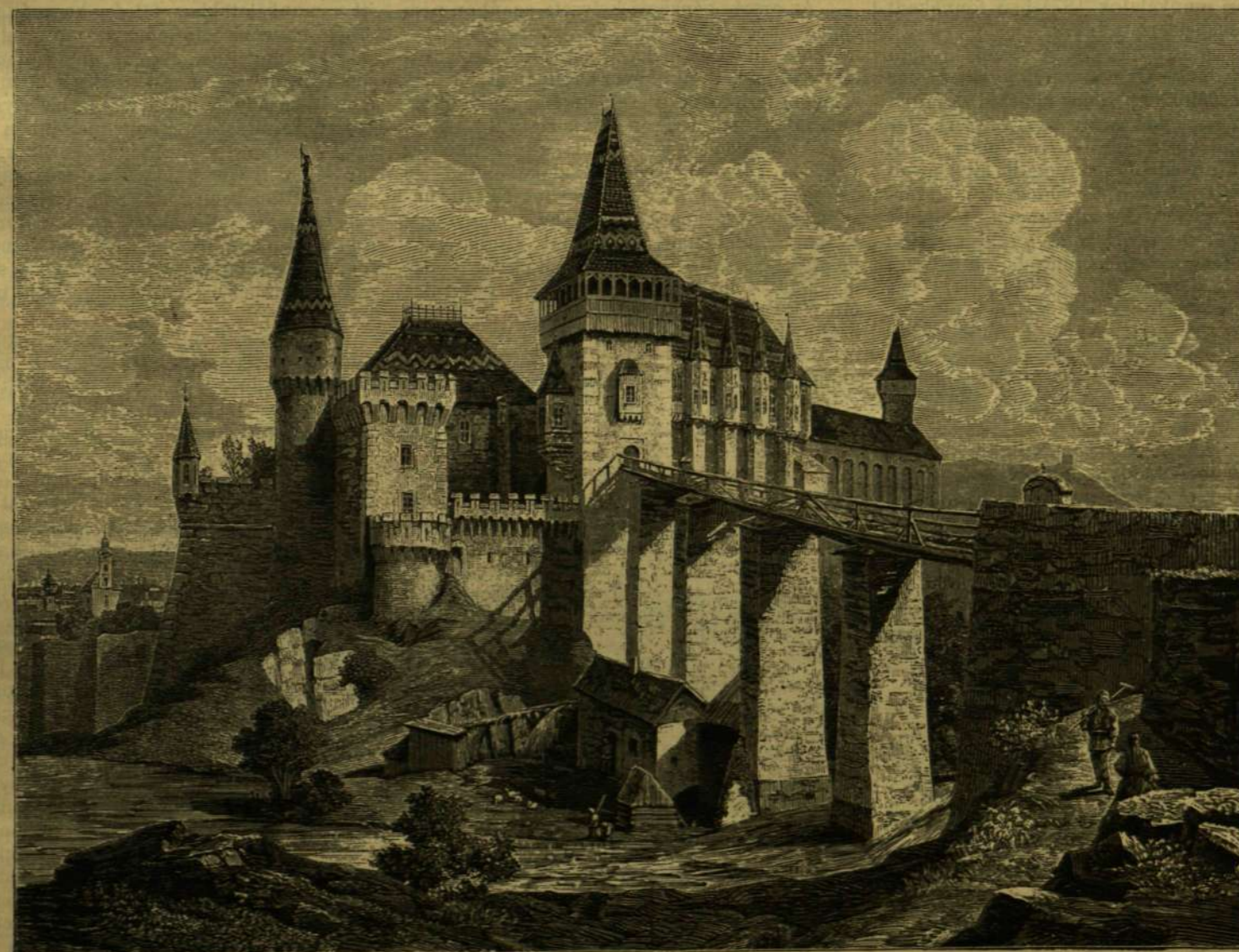
VAJDA-HUNYAD VÁRA, A MILYEN MA.