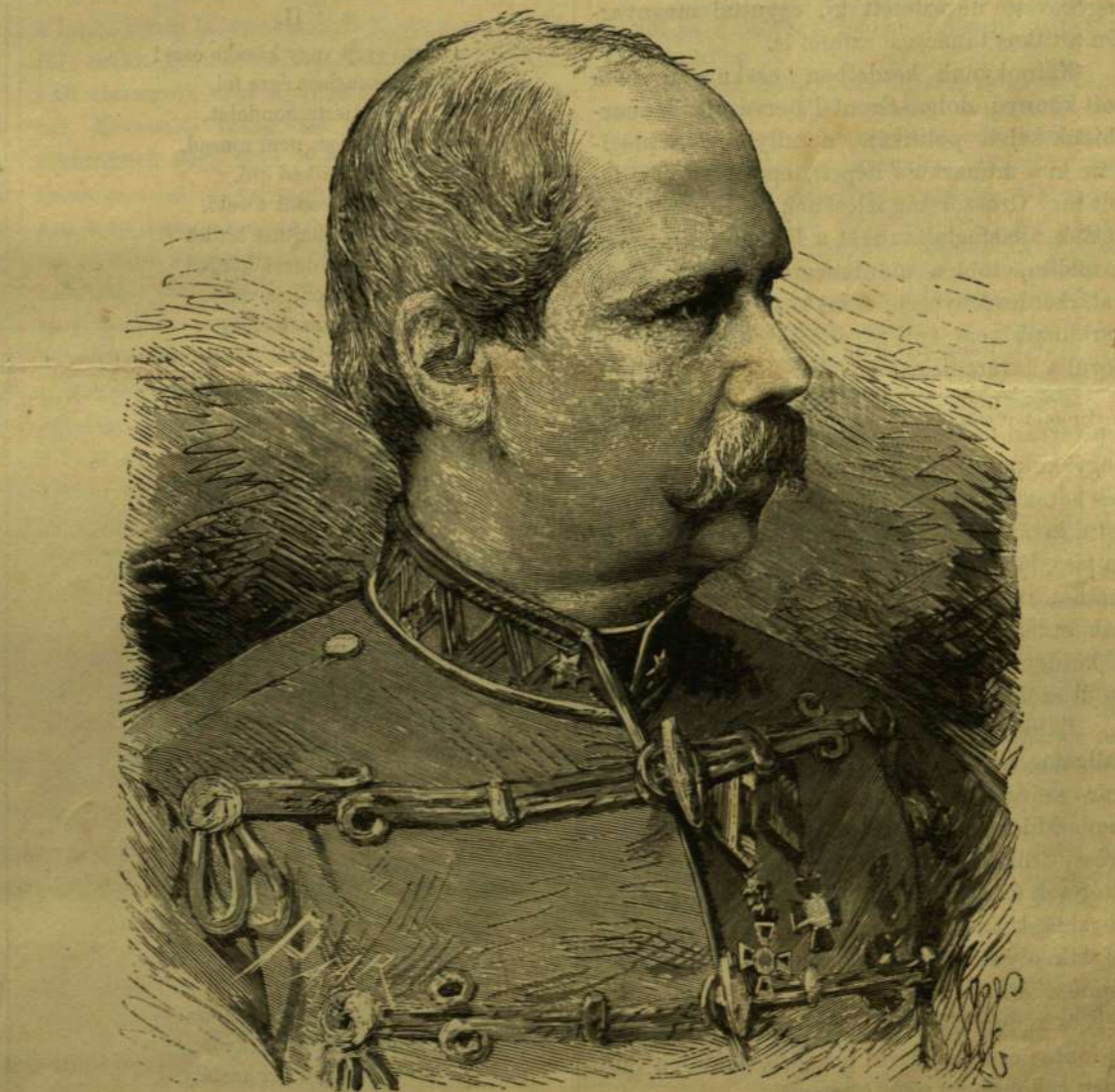
GRÓF KÁLNOKY GUSZTAV.

Kálnokyról a világ eddigéig nem sokat tudott. Nagy tehetségre valló tettek nem jelölték diplomatai pályáját. Előnye volt, hogy neve magyar hangzásu, születése morva; hogy ki-