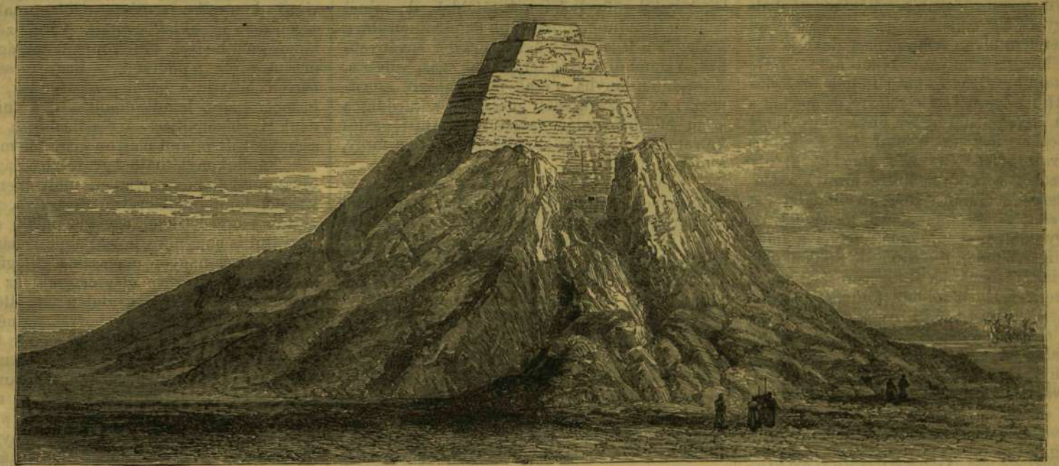
MEYDUM GULÁJA. (KINYITATTOTT 1881. DECZ. 13-ÁN.)

* Tengeralatti alagutat akarnak létesíteni Olaszország és Szicília között is a messzinai szoros alatt.