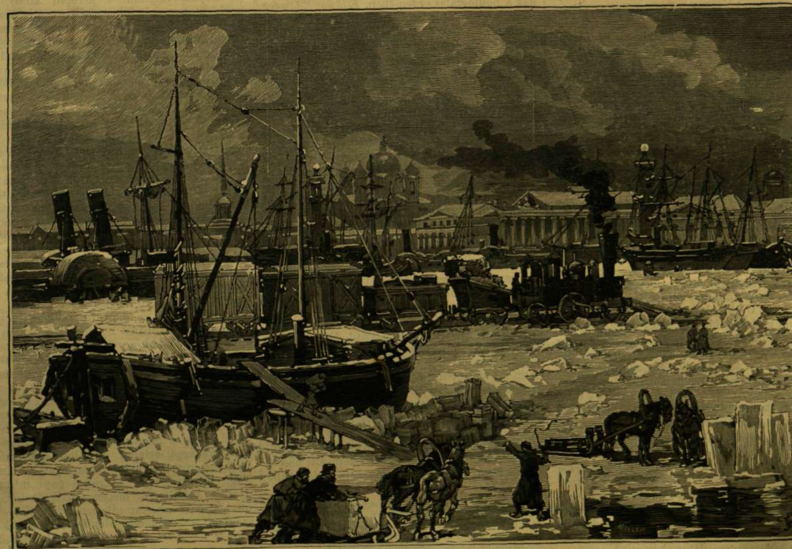
VASUT A NÉVA FOLYÓ JÉGÉN.