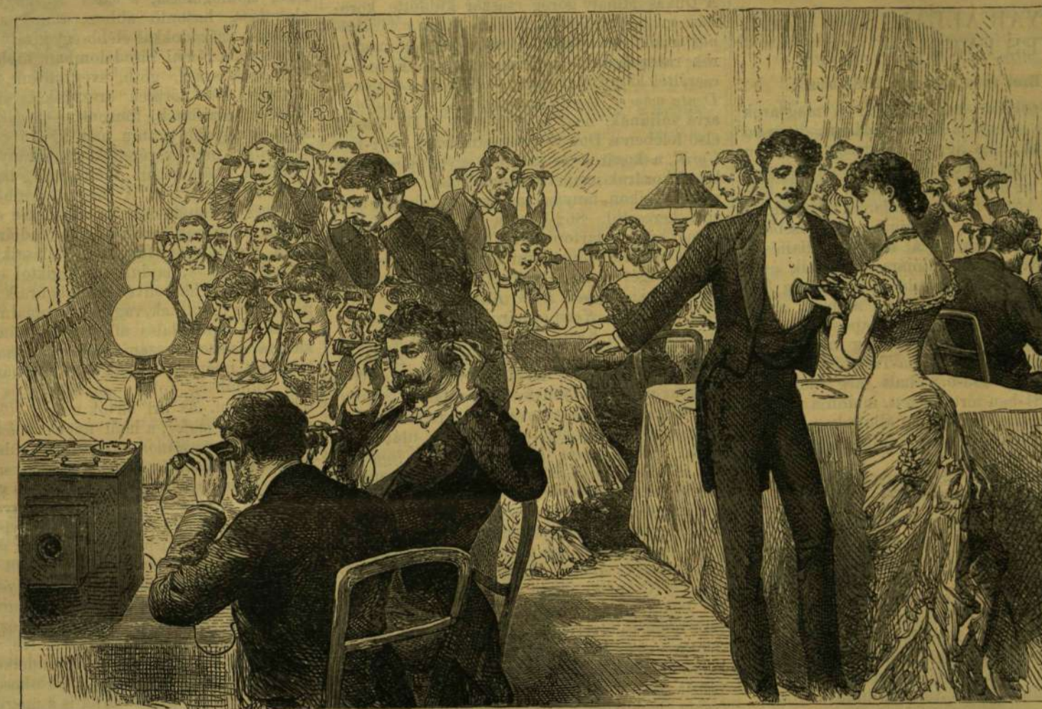
ÚJÉV KÖSZÖNTÉSE TELEFON ÁLTAL A LONDONI WESTMINSTERBEN.

Történt a dolog úgy, hogy a Balti-tengeren és a Néván közlekedő hajók legtöbbször ott érte a vizen a hirtelenül beállott jég. Nem lehetett sem előre, sem hátra haladni. A hajókon töméntelen áru volt felhalmozva, azt sem lehetett a partra, és onnan tovább szállítani. Síneket raktak tehát a jégre, a hajók között. A dolog hamar ment, hiszen sem vízszintezni, sem alépitményt csinálni, sem slippereket lerakni nem vala szükség. A vasut gyorsan készült, s minden fennakadás nélkül ment rajta a forgalom.