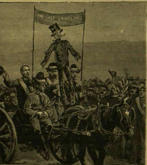
Az „utolsó földesur” képe.