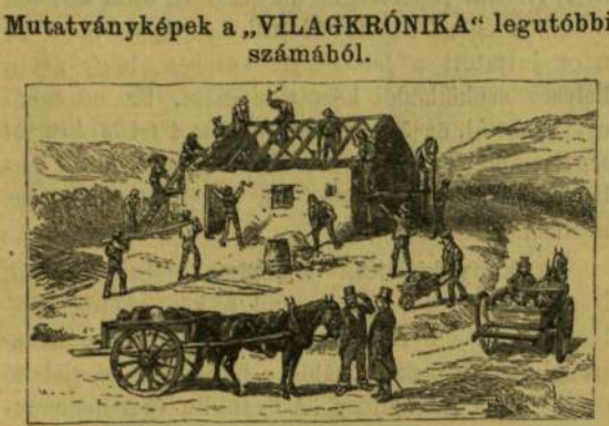
A landliga tagjai házat építenek Kerry megyében.