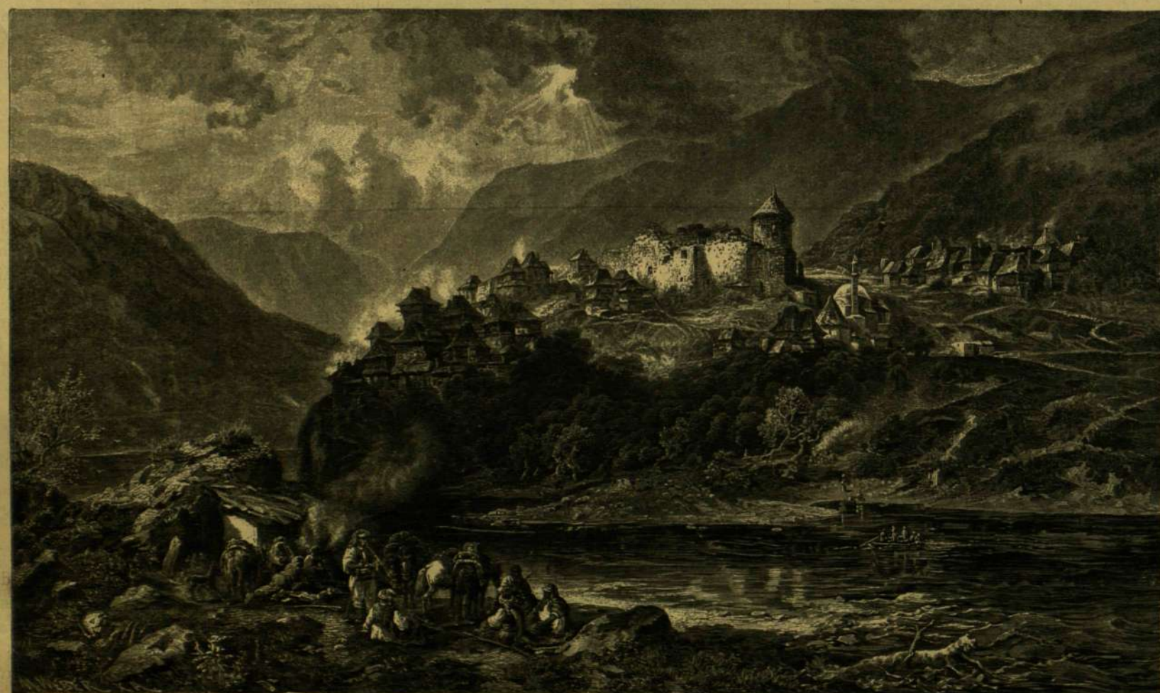
VRANDUK VÁRA BOSZNIÁBAN.