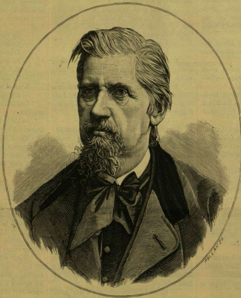
KERTBENY KÁROLY.

Kertbeny az irodalom azon munkásai közé tartozott, kik — mohó vágytól üze — idő előtt, kellő készület nélkül lépnek föl s még mikor hasznosan működnek is — évek során arra vész nagy része fáradságuknak, hogy első fellépésök hibáit feledtessék, tévedéseit helyre hozzák, esorbáit kiköszörüljék. Ha néhány évvel később,