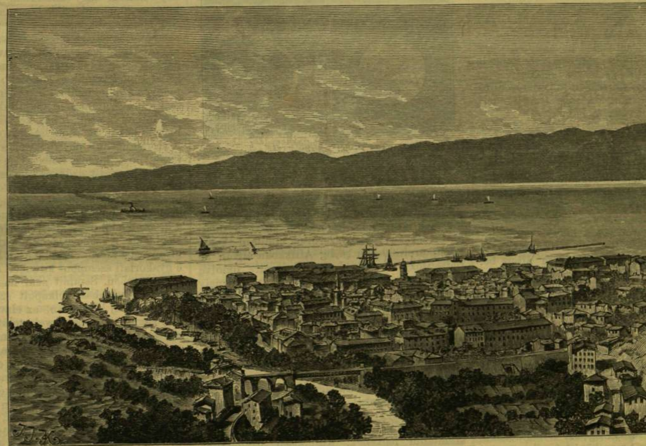
A Hartleben kiadásában most megjelent magyarországi úti kalauzsból.

* A francia váltópénzt, mely eddig bronzból készült, most nickellé alakítják át, a mely anyagot használják Belgiumban, Svájcban és Németországban is. Az új váltópénz nyolczszegletű lesz, hogy az ezüst daraboktól könnyen megkülönböztethessék.