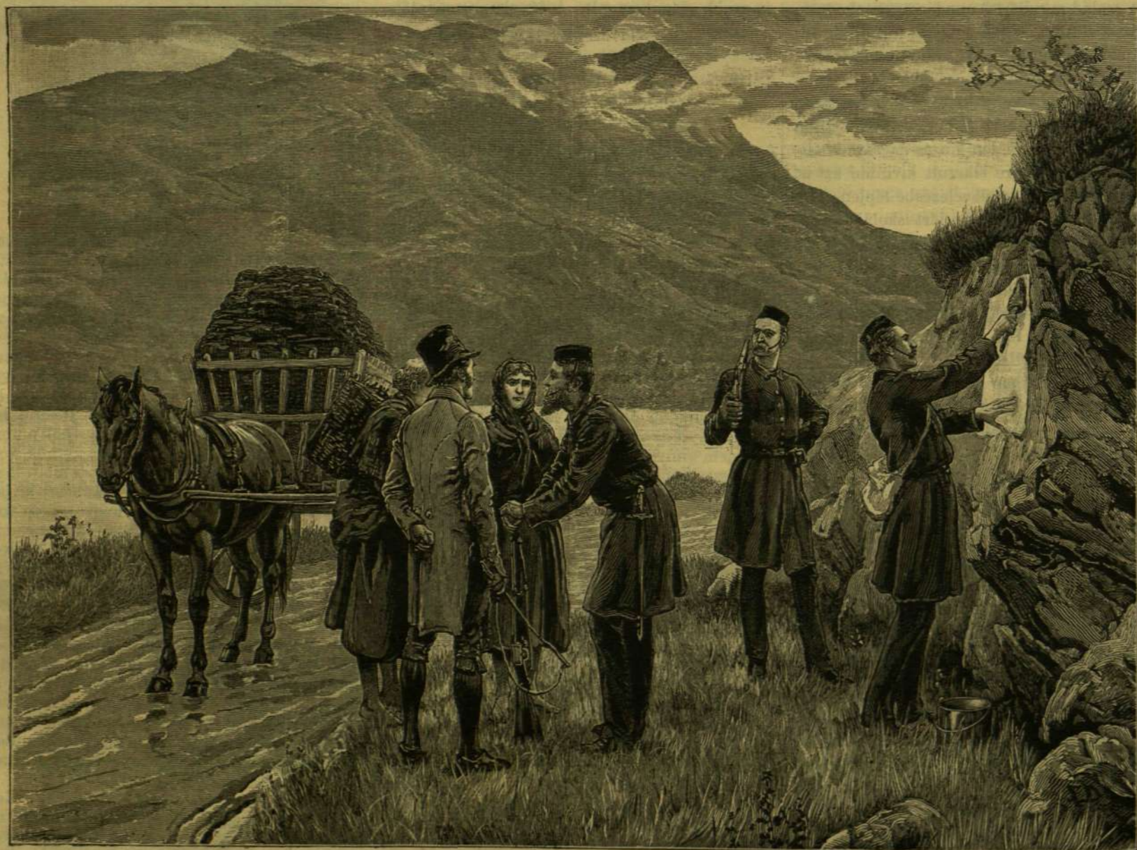
KORMÁNYRENDELET KIFÜGGESZTÉSE CONNEMARÁBAN. AZ IRLANDI MINISZTERGYILKOSSÁG.