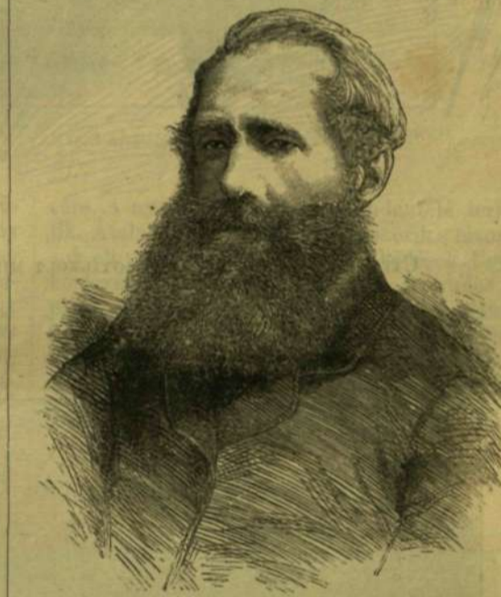
Sir John Poyntz Spencer, Irland alkirálya.

Irlandi kormányzóknak vagyis alkirálynak (lord Neutenant) sir John Poyntz Spencer gróf,