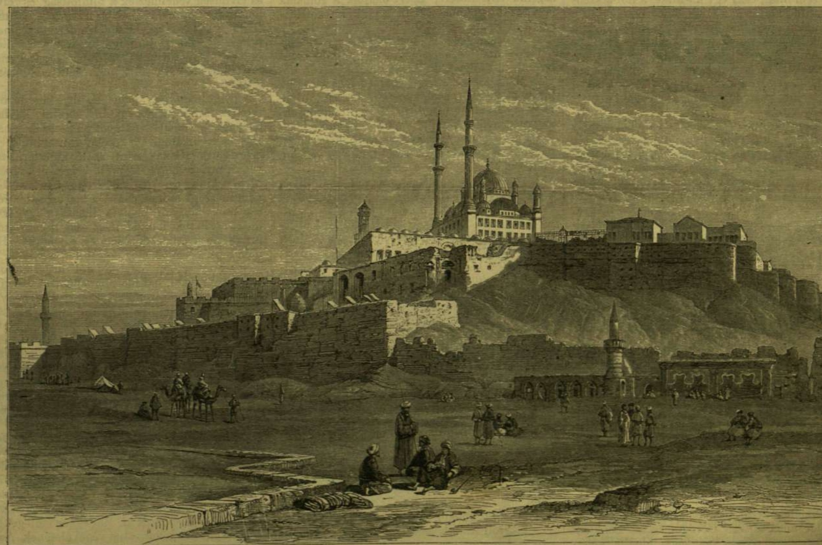
A KAIRÓI CZITADELLA.

sére. A nyomozó leveleket mindenfelé terjesztik. Általában Irlandban egymást érik a lázongások elnyomására irányzott intézkedések. Egy ily körlevél kifüggesztését ábrázolja legutolsó képünk. Három rendőr ment ki e végre a vadon helyre Connemaraba. Tettöket kíváncsi parasztok és nők nézik. A kép a meredeken emelkedő sziklakkal s a tó vizével elég hű képét adja Irland elhagyott s oly kevésbé népes vidékének.