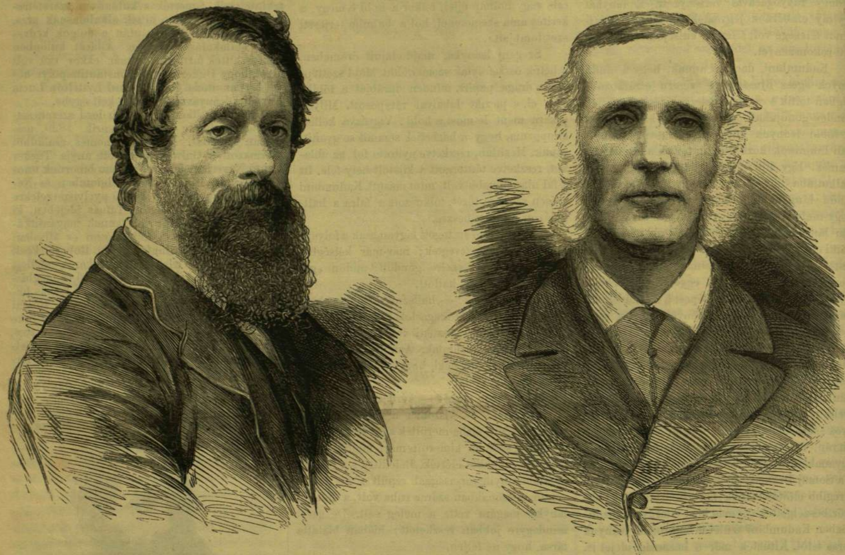
CAVENDISH LORD, IRLAND MEGGYILKOLT MINISZTERE.