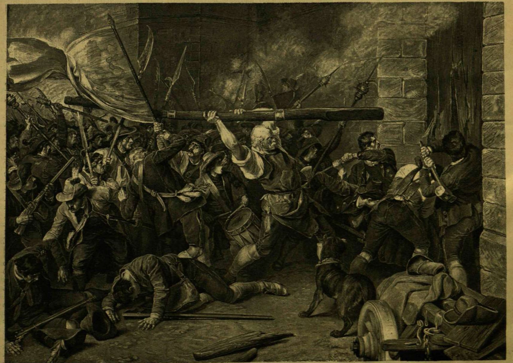
A MÜNCHENI VÖRÖS-TORONY OSTROMA 1705. KARÁCSONY HAJNALÁN. — DEFREGGER FESTMÉNYE.