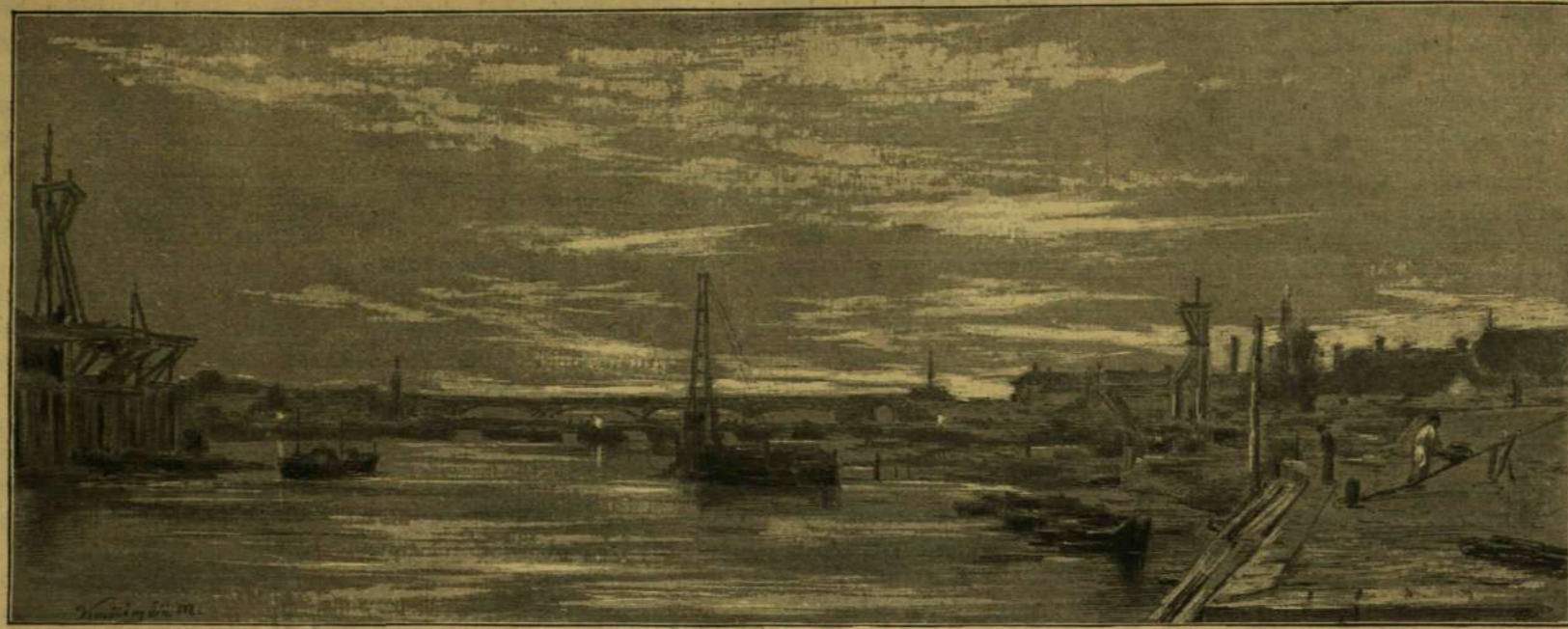
HIDÉPÍTÉS A TISZÁN, A HAJÓHID ÉS VASUTI HID A HÁTTÉRBE.