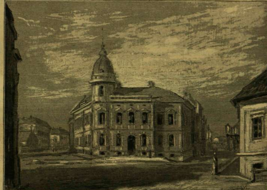
VÁROSI ELEMI ÉS POLGÁRI LEÁNYISKOLA.