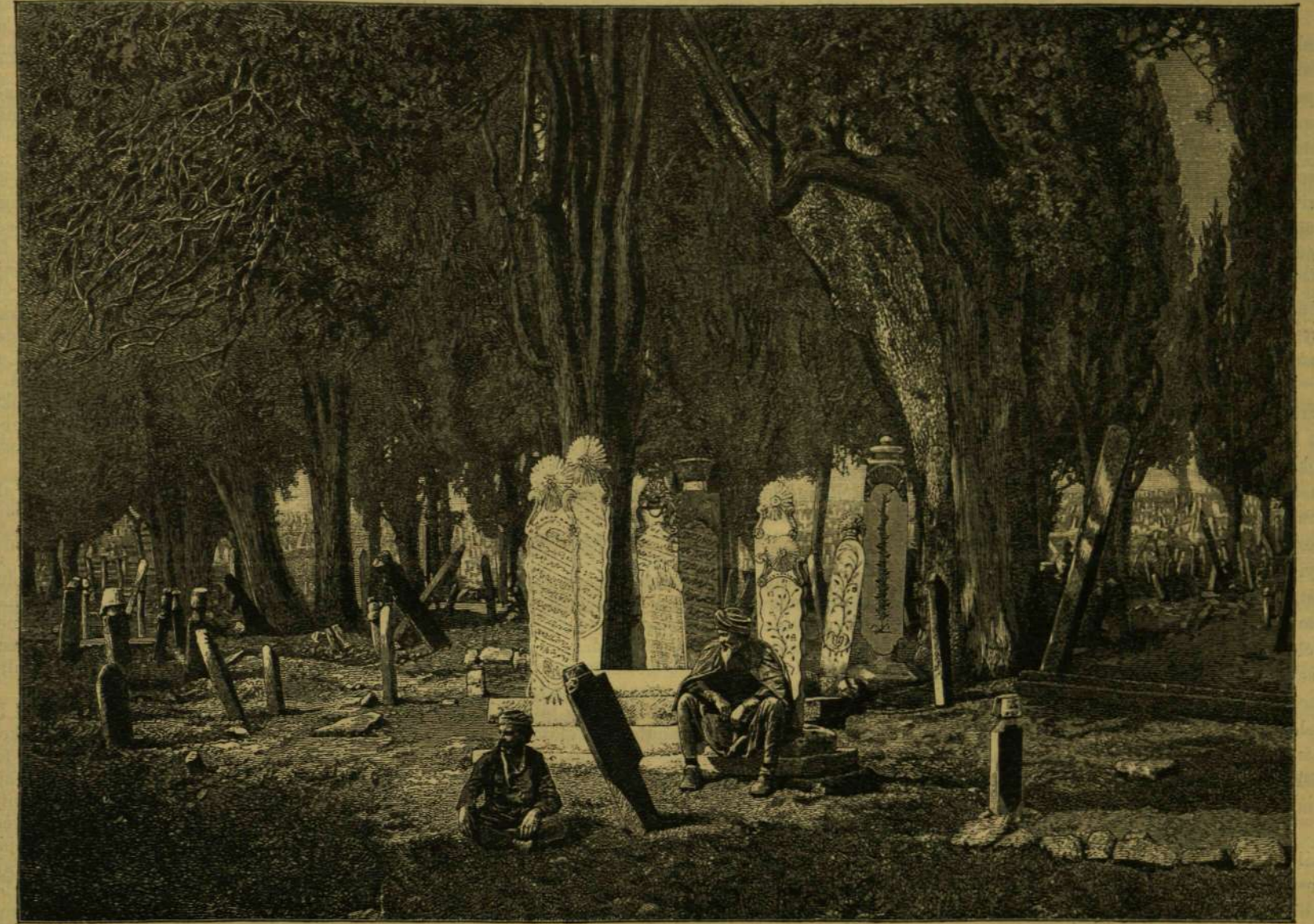
SKUTARI-I TÖRÖK TEMETŐ.