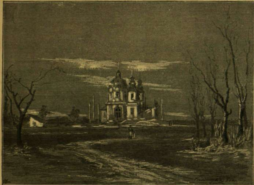
AZ ÚJ KALVÁRIA-KÁPOLNA ÉS KÖRNYÉKE.