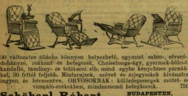
30 változatos állásba könnyen helyezhető, egymint salonn-, olvasó-, dohányzó, rokkant és betegszék, Chaiselonge-ágy, gyermek-bölcső, kandelabó, támlány- és tolokoci stb. mind egybe kényelmes párnákkal, 30 frttól feljebb. Mintarajzok, szövet és árjegyzékek kívánatra ingyen és bérmentve. ORVOSOKNAK: különlegesek műtét- és vizsgáló-székekben, mindennemű betegszék. 750

A legcélszerűbb karácsonyi ajándék: a Schöberl-féle egytetemes szék