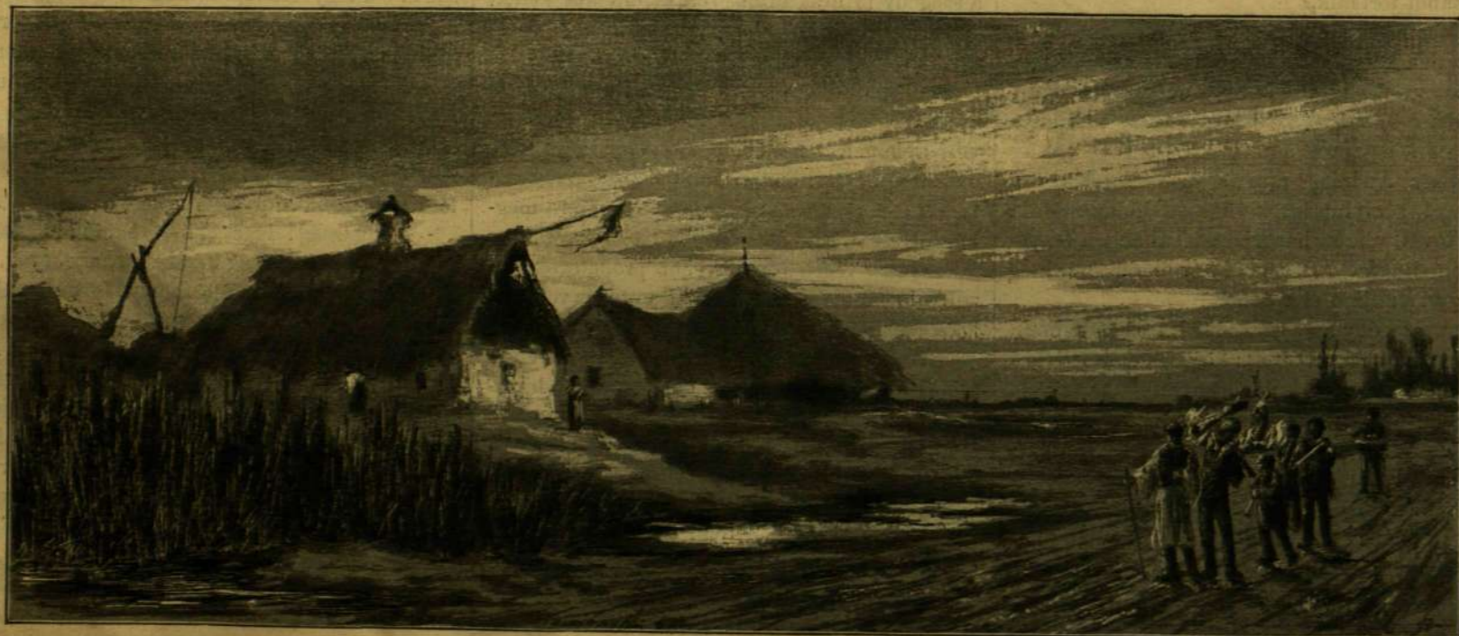
RÉGI CSÁRDA SZEGED KÖRNYÉKÉN. — KACZIÁNY ÖDÖN RAJZA.