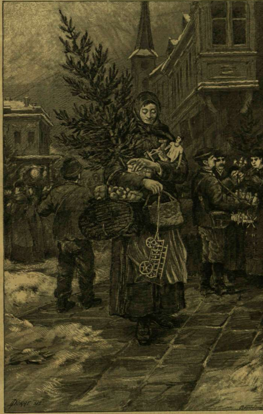
Dörre Tivadar rajza.

Karácsony szombatja közeledtével az utcákat vízzel tölt kádak és dézsák szegélyezik, melyekben szörnyű nagy angoluák viczkáncóznak, és a nápolyi utcai kiabálásokat e haltartók tulajdonosai szaporitják e fölívással: Capitoni! Oh! che bei