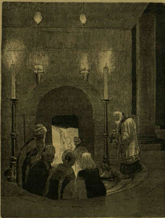
Lépcső a Megváltó születési kápolnájához a bethlehemi templomban.

A látogató-jegyek küldözése, ujévi üdvözlét fejében, az olasz tehetősebb osztálynál oly nagy mérvben divik, hogy ezek számára minden évben külön postai vitelbért hirdetnek. E jegyeket küldözik családoktól is; a római cselédség igen ügyesen megtudja kimélni magát a házról-házra járás fáradságától: összegyűlnek a Piazza Navona-n s itt kiseréltik gazdáik üdvözlő névjegyeit; mindegyik cseléd egymás után ki-kiáltja a kezében levő névjegyves levélké cím-zetét s átadja azon cselédársának, a ki a kikialtott névre felel.