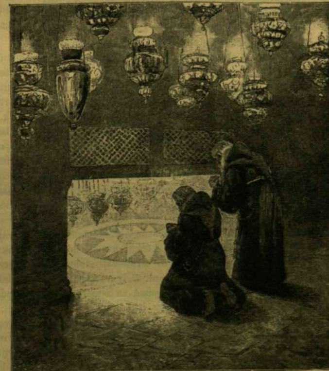
Az ezüst csillag Jézus születése helyén a bethlehemi templomban.

Még jobban kiérdemlik e hálát azok, kiket ez a csekély anyagi haszon sem ösztönöz. Nincs működésöknek más rugója, mint a jótékony-ság, a segíteni vágyás, a részvét. Ez tartja őket tal-pon hosszú hideg napokon keresztül, mi alatt elhagyva rendes foglalkozásukat, őrzt állanak, ez tartja őket ében veszes, viharos éjszakákon, hogy mikor megkondul a vészharang intő szava, kézuél legyenek. Egy pillanat csak, s ők mindent feledve rohannak a veszedelem hely-lyére. Vészfáklyák és lámpások világítják be