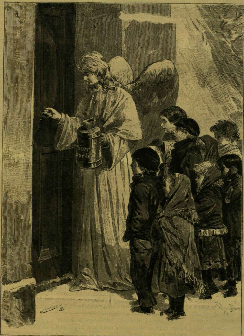
SZEGÉNY GYERMEKEK KARÁCSONYA.

találkozásunk óta. A mindennapi vásár megkezdődik. Sok mindenféle kínálnak, fegyvert, prémot, ékszer, játékok, halat, halcsontot, stb. Mindezekért most csak «kouka» (kenyér) kell nekik. A vásár után a tisztiszalón tagjai visszavonulnak s munkájukhoz látnak. Néhányan kajütjükben dolgoznak, mások a közös teremben. Átdolgozzák a meteorologiai megfigyeléseket, átnézik a gyűjteményeket, írnak; hébe-hóba tréfás beszéd szakítja meg a munkát. A legénység a jól befűtött földközön foglalkoztatódik, s a szakács hozzá lát az ebéd készítéséhez. A legénység ebédjéhez lát, — a csukcsok odatalulnak a bejárathoz. Egyik leveses csészét a másik után nyujtják föl s mohón kiüriti, a ki elkaphatja. Ép így osztozkodnak a kenyéren, huson, czukordarabokon. Végül a szakács megjelenik a nagy katlannal, melynek még tekintélyes levesmaradék van a fenékén. Mint a