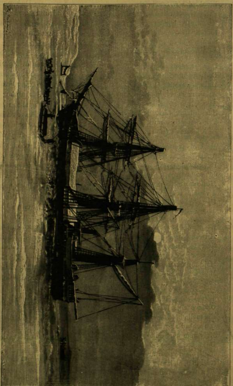
A 'VEGA' HAJÓ TELI SZÁLLÁSON A BIRNING-SZÖRÖS FÖLÖTT.