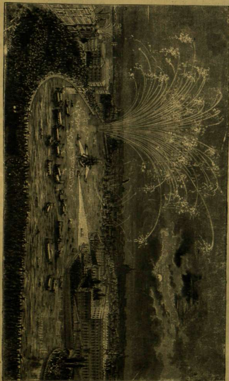
A 'VEGA' ÉNNEFÉLÉYES FOGADTALYASA, STOCKHOLMBAN.