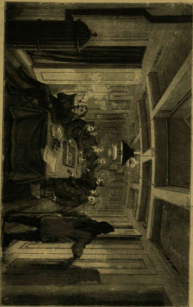
A 'VEGA' TISZTI SZOBÁJA.