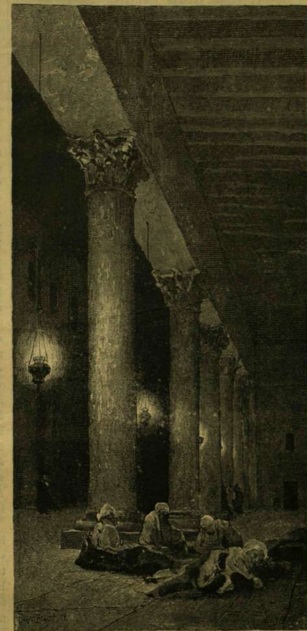
A bethlehemi templom csarnoka karácsony éjjelén.

Néhol úgy állították azt fel, mint állami vagy közigazgatási intézményt, máshol mint jótékony-ságit. De jótékony az a társadalomra ebben és abban az esetben egyaránt. Néhol maga az állam vagy a város a saját költségére gondos-kodik róla, hogy külön e célra fizetett emberei övják az emberek életét és va-gyonát. Köszönet ezeknek a férfiaknak is. Azzal az anyagi haszonnal, mely részük, bármekkora volna is az különben, nincs megfizetve az életveszély, mely-lyel naponta játszanak. A pénz meg nem jutalmazhatja fáradozásukat, midőn éj-jel és nappal őrzt állva, folyton készen vannak bemenni a legnagyobb vesze-delemből, hol a mig ők mások életéért