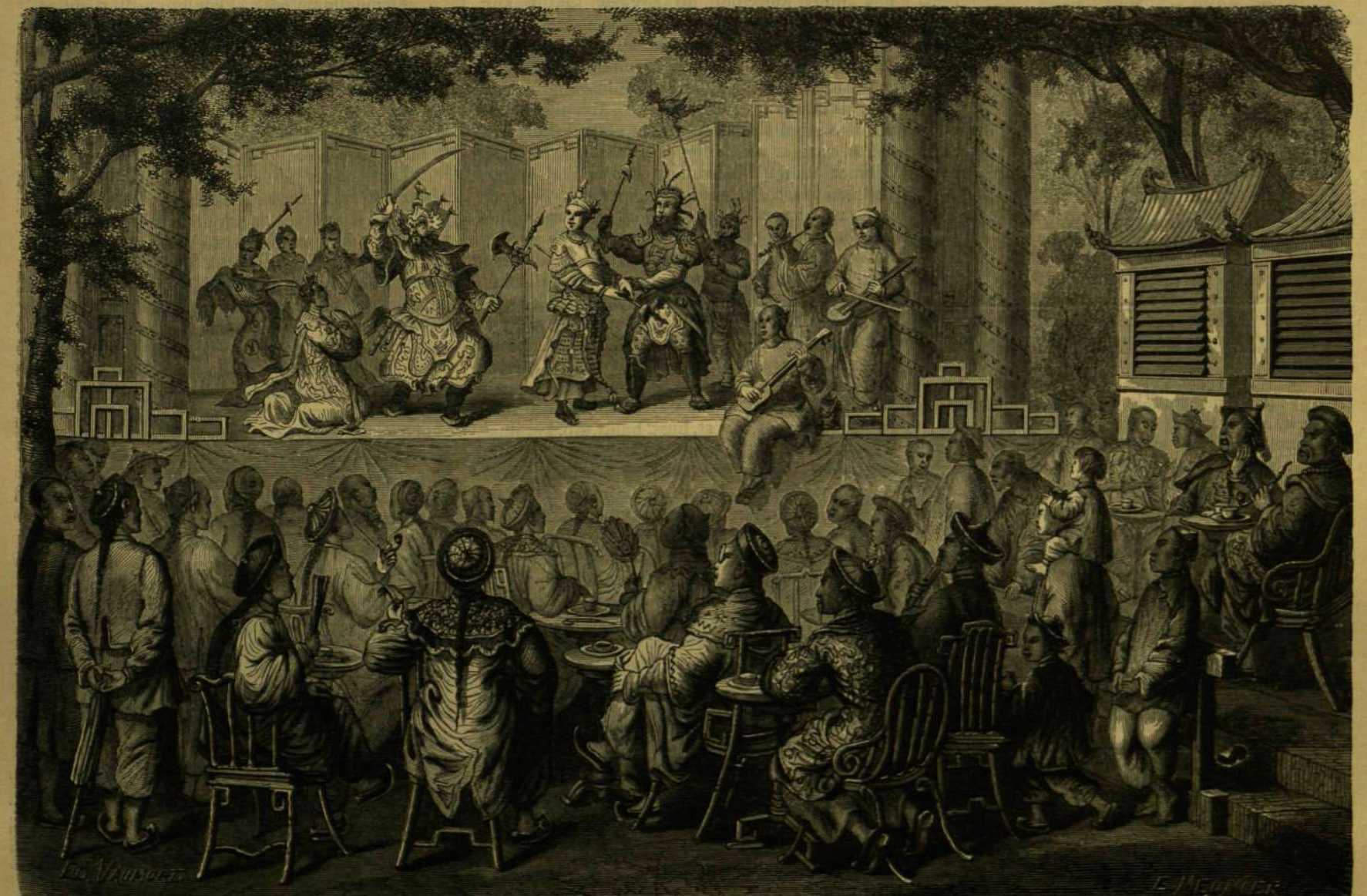
TÖRTÉNETI SZINMŰ ELŐADÁSA EGY PEKINGI SZINHÁZBAN.