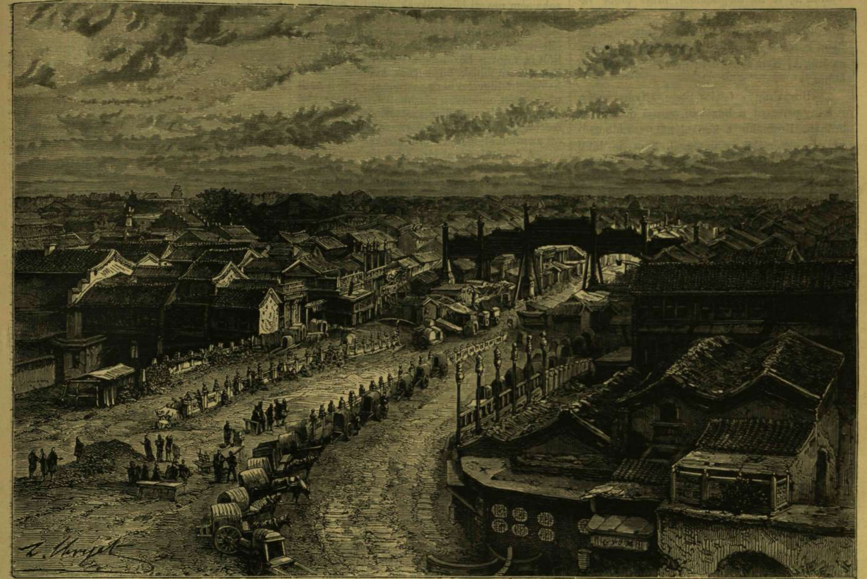
A KOLDUSOK HÍDJA PEKINGBEN.