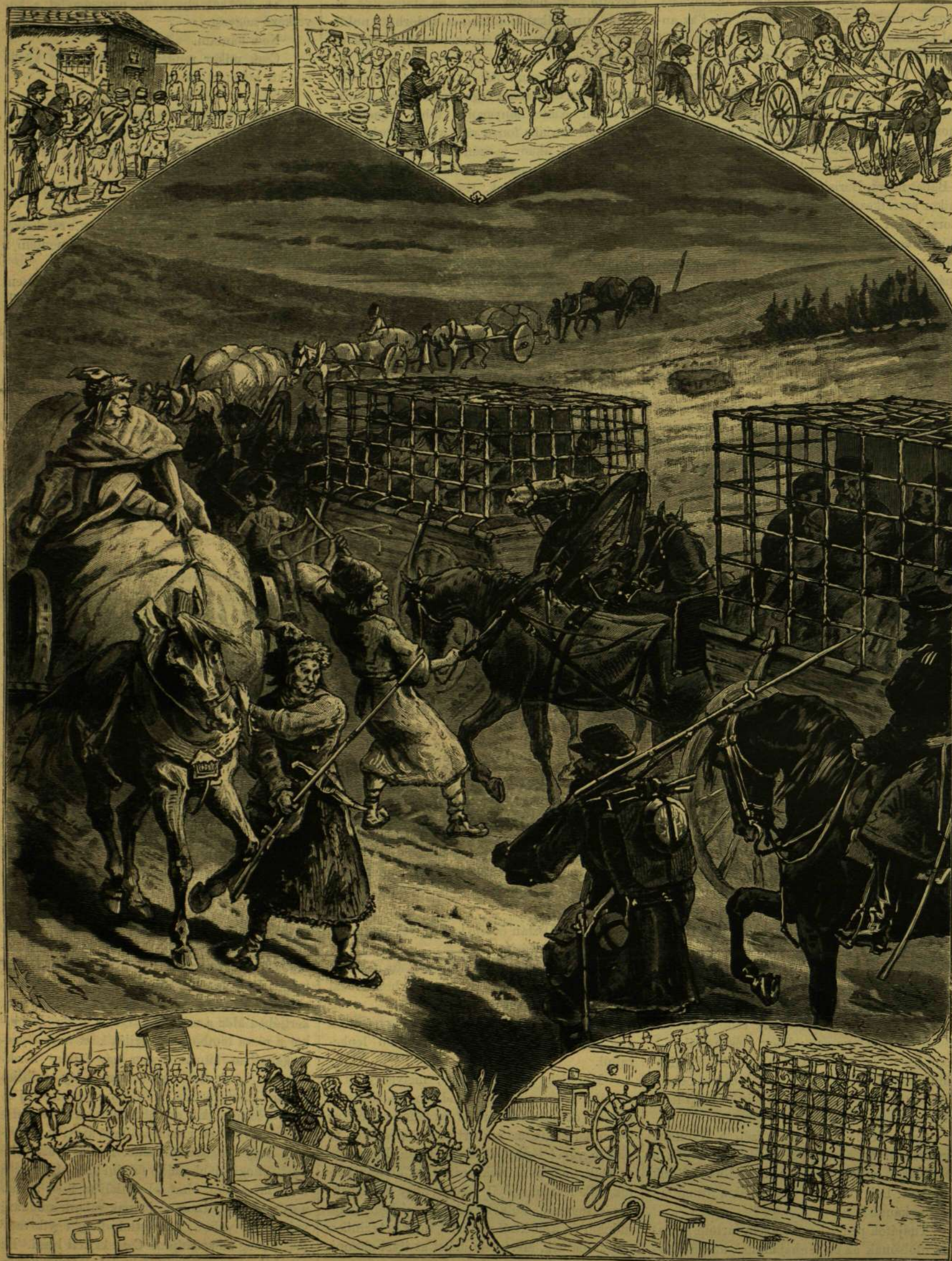
A foglyok hajóra szállása.