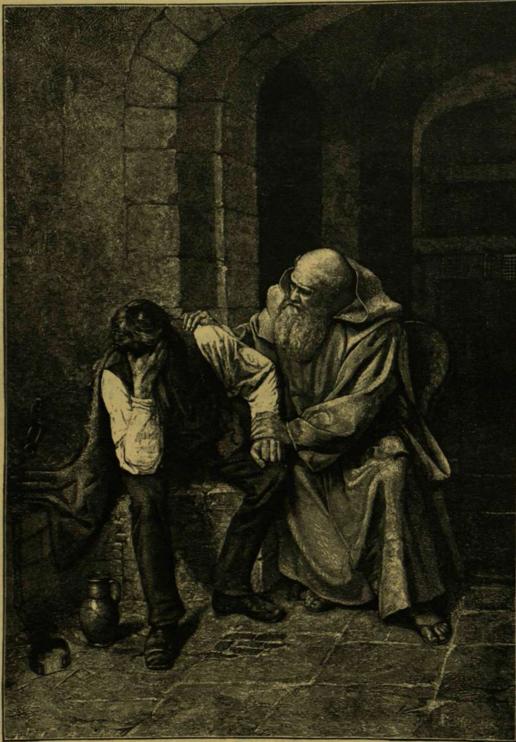
AZ ELTÉLT. — STEPHANI FESTMÉNYE UTÁN.

A pünkösdi ünnepektől elválhatlanok a rózsák, ezért közönségesen «Pasqua rosa»-nak nevezik. A pünkösdi isteni tisztelést egy sajátos szertartás kíséri a Pantheonban (vagy leg-