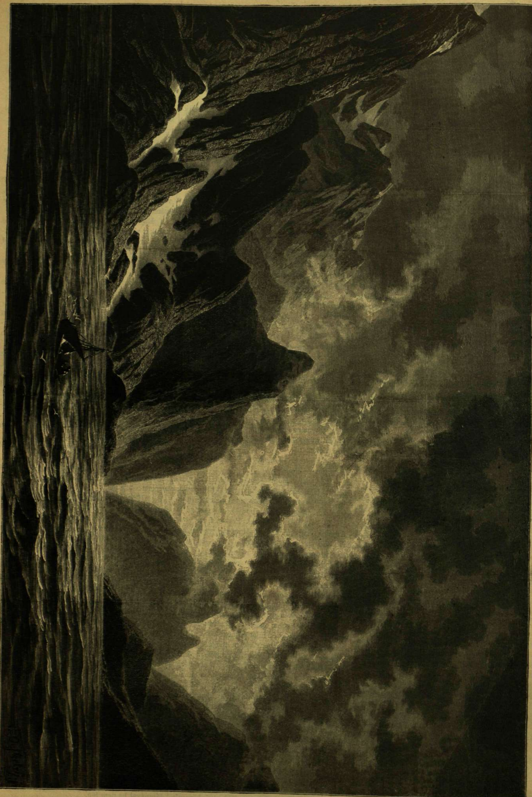
AZ ÉJFÉLI NAP A LOFODI SZIGETEKNEK.

Ott látott engem Ödön karjain, s kérde nézett atyámra. «Kedves Stein ur!» szolt apám a kérdő tekintetre, «ön annyira szíven viseli a vállalat érdekeit, hogy nem mulasztom el önt az első alkalommal az igazgatósnál előleptetésre ajánlani. Továbbra is jó barátunk, s ön az én jobbkezem marad. Viszonyásul csak azt kérem, szolgáltassa át Ödönnek azt a kulcsot, melylyel Bettykémet bilincsbe verte.»