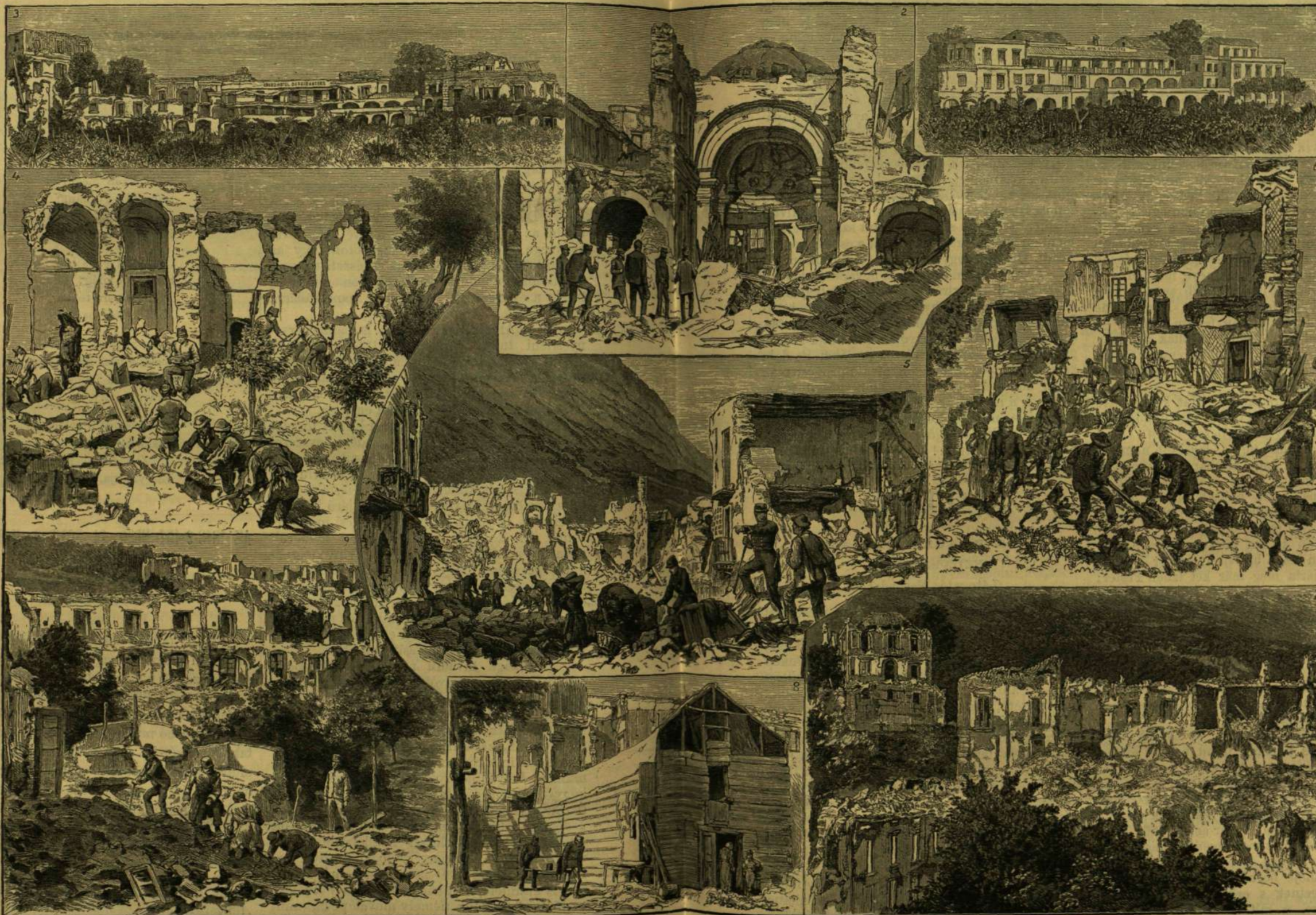
1. A külföldiek szállódjája Casamicciolában a földrengés előtt. — 2. e szálloda kapuja, és — 3. maga a szálloda a földrengés után. — 4. A Mangin-tér romjai Casamicciolában. — 5. Lacco Ameno. — 6. Garibaldi-ütege, Casamicciolában. — 7. Barbieri-villa. — 8. A fa-színház. — 9. A külföldiek szállódjájának romjaiból.

Midőn ütegem ezen, fájdalom, utolsó előnyomulására elindult, engem Csaplár Ignác hadnagy a két hosszú vetőágyúval — miután azok egyike kerekében megrongáltatott, tőlényeiből pedig mindkettő kifogyott, — úgy azoknak biztoságba helyezése, mint az általánosossá lenni kezdő löszerbiány pótlásának sürgetésére, a csataterrel visszavonulni rendelvén, az üteget ért végcsapásnál jelen nem lehettem.