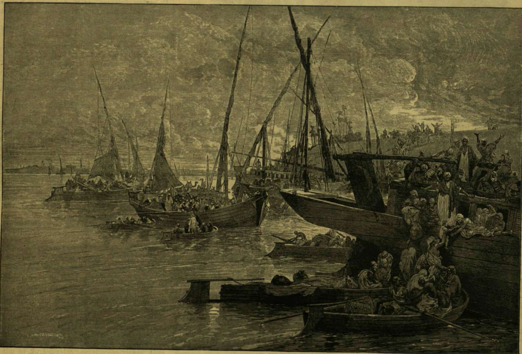
A KHOLERA EGYIPTOMBAN. — KAIRÓI LAKOSOK HAJÓRA TÓDULÁSA A NILUSON.

S réá emelve nagy és mély kerek szemekt, kérdőleg folytatá: