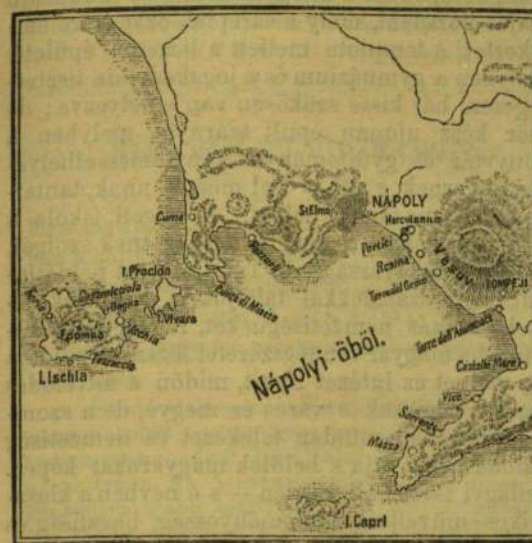
A nápolyi öböl térképe.

Casamicciola tájképi szépségei s ritka természeti adományai világszerte nevezetessé-ké lettek elpusztulásuk óta. Maguk a képek, melyek közül ismét bemutatunk néhányat, eléggé tanu-sítják a híres fürdő szép fekvését s igazolják a «la regina dei bagni» (a fürdők királynője) büszke nevet. Nápolyból a St.-Elmo alatt elvo-nuló hosszú alaguton keresztül menve, a vul-kánikus tünetekben oly gazdag Pozzuoli felé, csaknem mindenütt magunk előtt látjuk a regényes Ischia szigetét, látjuk a hid által a szigettel összekötött erőd csillogó épületeit s a maga-san emelkedő Epomeo hegységet. Casamicciola kissé el van fedve, de később az is előtűnik, vagyis — előtűnt az előtt; mert ma már a fényes paloták egész sorozata csak rom.