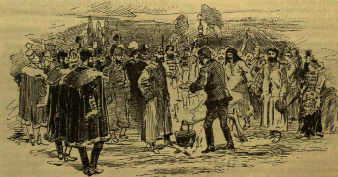
A KIRÁLY A SZEVEDI NÉPNÜNNEPEN.