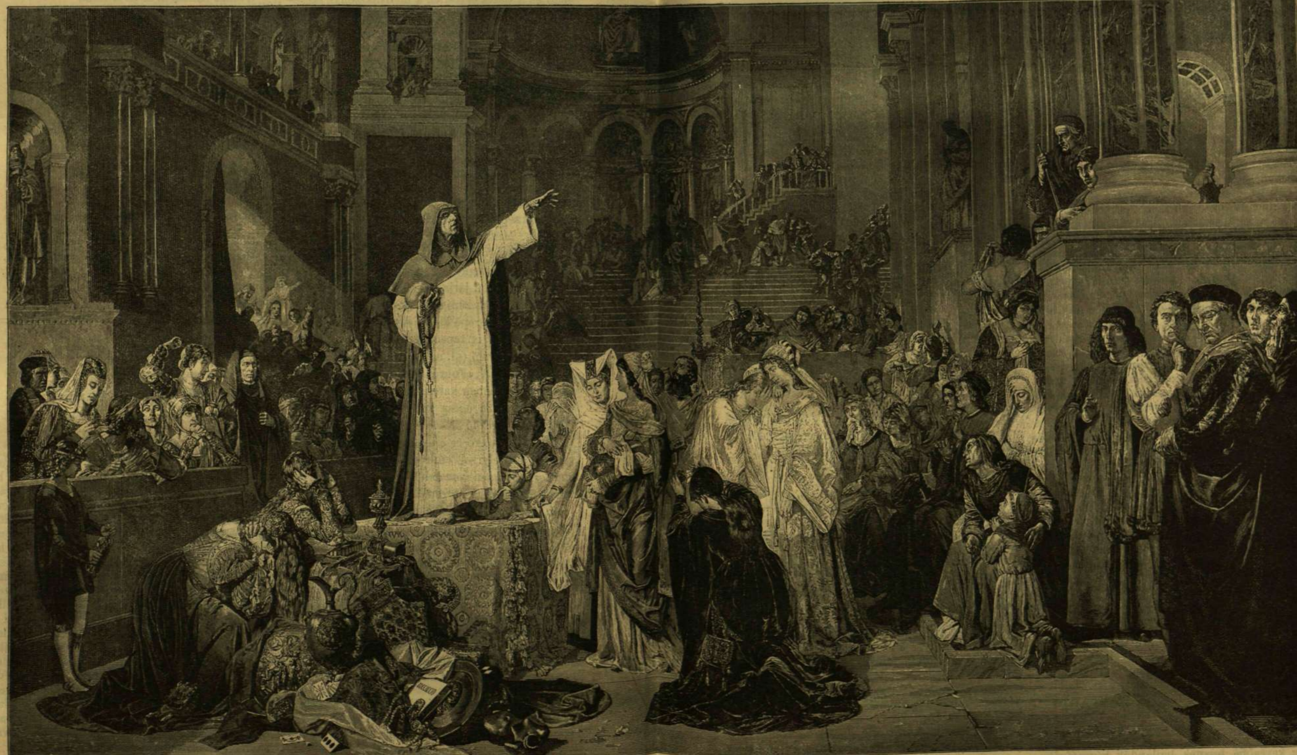
Langenmantel Lajos festménye.