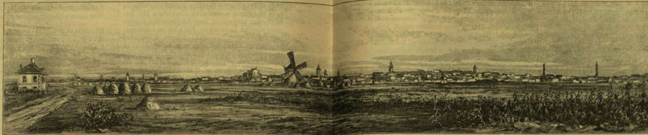
SZEGED. — A NYUGATI OLDALBÓL, A NAGY KÖRTÖLTÉSÉRŐL NÉZVE.

Akadtak, a kik egyenesen felszólították Lőrincz fejedelmet, hogy ne tűrje a szerzetesnek ily magaviseletét. De ez, igazi fejedelmi nagy-