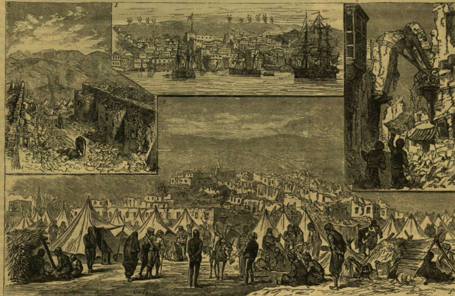
1. Csesme városa és kikötője. — 2. Reis-Dere falva, boomlott házaival. — 3. Egymásra omlott szemközti házak. — 4. A sebesültekről gondoskodó pasák és orvosok.

Itt újra megkezdődtek az önfentartás nehez küzdelmei és erőfeszítései. Már eleitől fogva tisztán állott előttem, hogy minél nagyobb az épületek és minél több az ember vala-hol, annál nehezebb ott ismeretségeket szerezni s annál kevésbbé érdeklődnek mások helyzetem iránt. Három évig maradtam itt, majd cseléd minőségben, majd szakácsnöket, szobalányokat s más tudományosomjas egyéneket tanítgatva. Annak a szép városkának az, a két Duna mel-lett, minden utczaköve beszélhetne valamit, ha szólni tudna, a nyomorról, melyen keresztül mentem. De az ifju kor mindent el bir viselni.