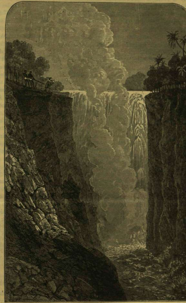
Mozi-ot-tunya, a Zambezi nagy vízesezt.

A Zambezi vízesezt a bensülöttek Mozi-otunya vagy Mezi-ot-tuna néven hívják, a mi szeszto nyelven «nagy víz»-et jelent. A Mozi-ot-tuna hosszú, óriási és mély hegyszakadék, melybe az 1978 yardnyi széles Zambezi bele rohan. Mielőtt a szakadékhoz érne, a folyót két sziget három ágra osztja. A legnyugatibb ág 196 láb széles és 262 lábnyi mélységbe zuhog a víz. Ez a zuhatag legkisebb, de legszebb ága, mely a többi oly borzasztó, hogyha ez óriási szakadékok ismerik a bibliai korbán, bizonyosan így festettek volna a pokol képeit, melyben iszonyatosabb a sötétség és víz, mint a tűz és a forráság. A keleti ág 218 yard széles és 393 láb