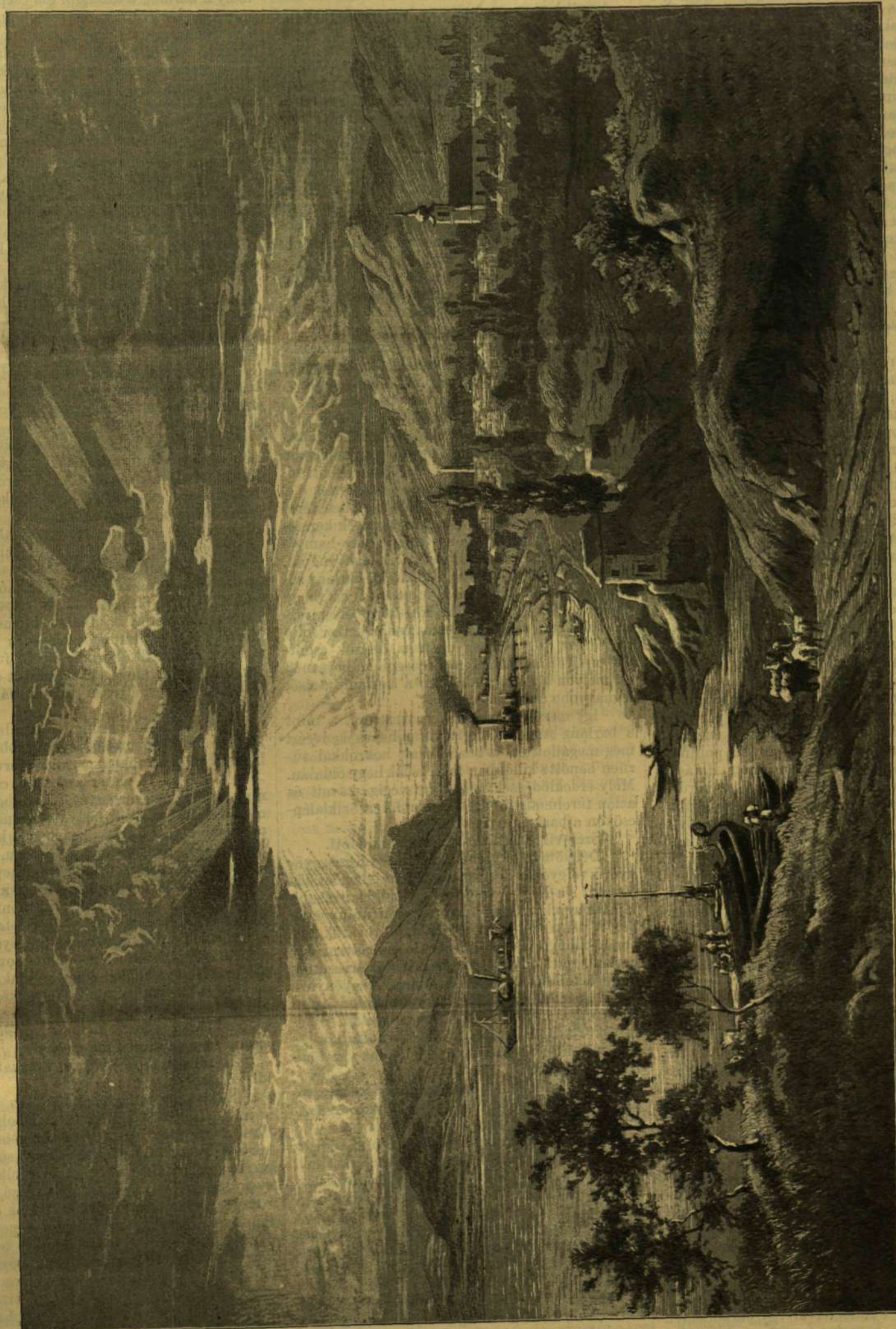
SZOB A DUNA MELLETTI. — LIGETI ANTAL FESTMÉNYE.

pel. Parlamenti tevékenysége 1869-ben kezdődött, midőn úgy, a cseh tartománygyűlésnek, mint a birodalmi tanácsnak tagja lett. Mint politikus meleg szószólója a csehországi német-ségnek, e mellett azonban «szűkebb hazája» iránt is ragaszkodással viseltetik s gyakran hangulyozza Csehország történetét és külön nemzeti sajtóságait. Szónoklata erélyes, de mérsékelt. Utolsó beszédjében egy Prágában létre hozandó második német színház fölépítésének országos segélyzését sürgette, mely indítványa azonban, ép úgy, mint az ellenpárt sürgetése egy cseh nyári színház föllállítása iránt, visszatartott.