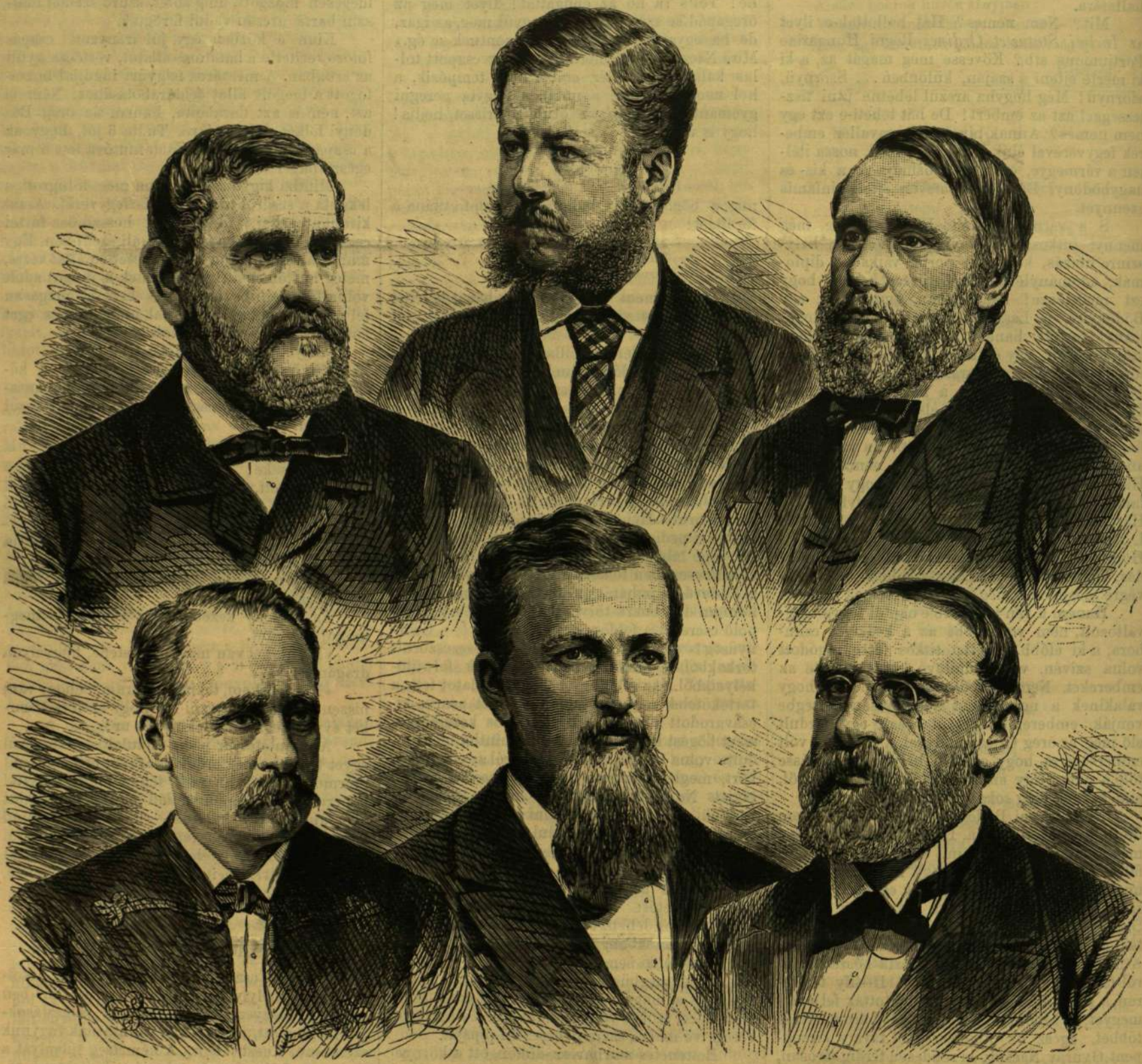
Rieger László. Gregr Eduárd.